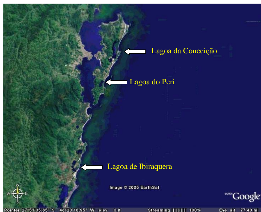
Figura 2 - Localização da Lagoa de Ibiraquera em relação a Florianópolis, e sua dimensão comparada a Lagoa do Peri e Lagoa da Conceição.

A Lagoa apresenta um contato com o mar através de um canal que tem sua abertura controlada pela ação antrópica e é composta por quatro bacias: Lagoa de Cima , Lagoa do Meio , Lagoa de Baixo e Lagoa do Saco .