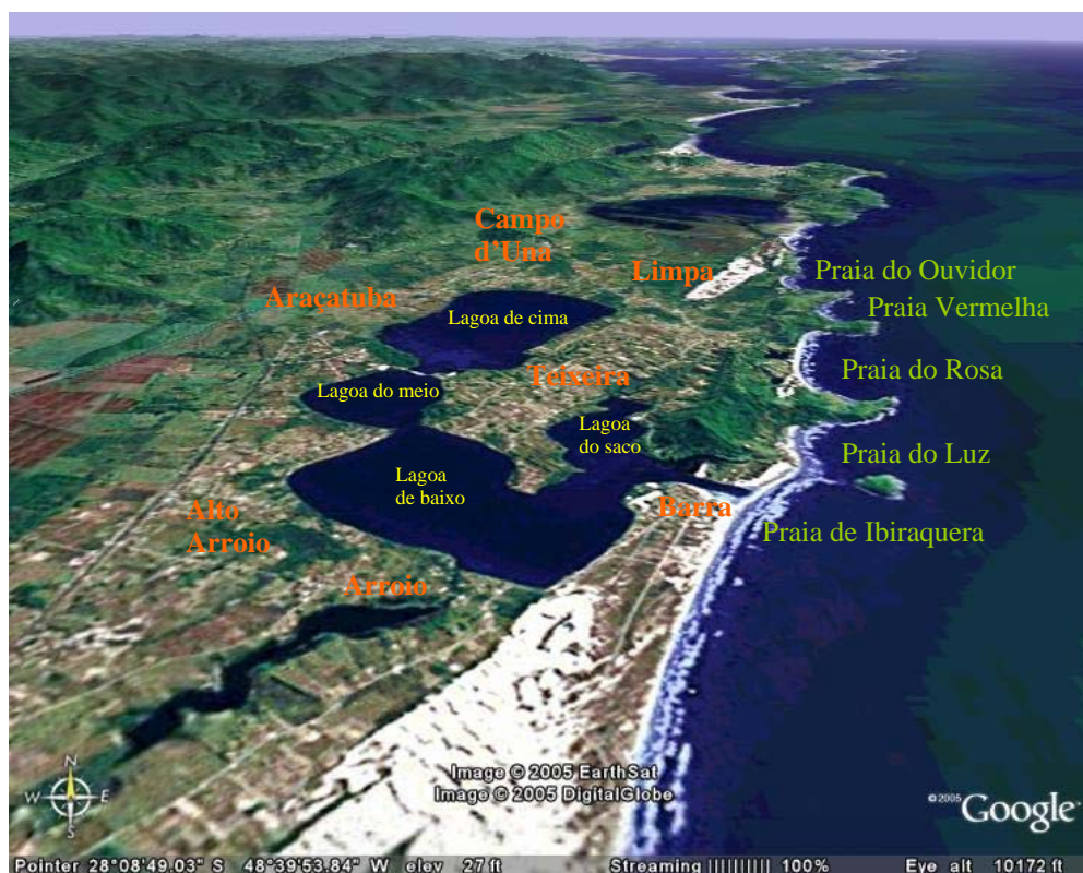
Figura 3 - Vista geral da Lagoa de Ibiraquera.