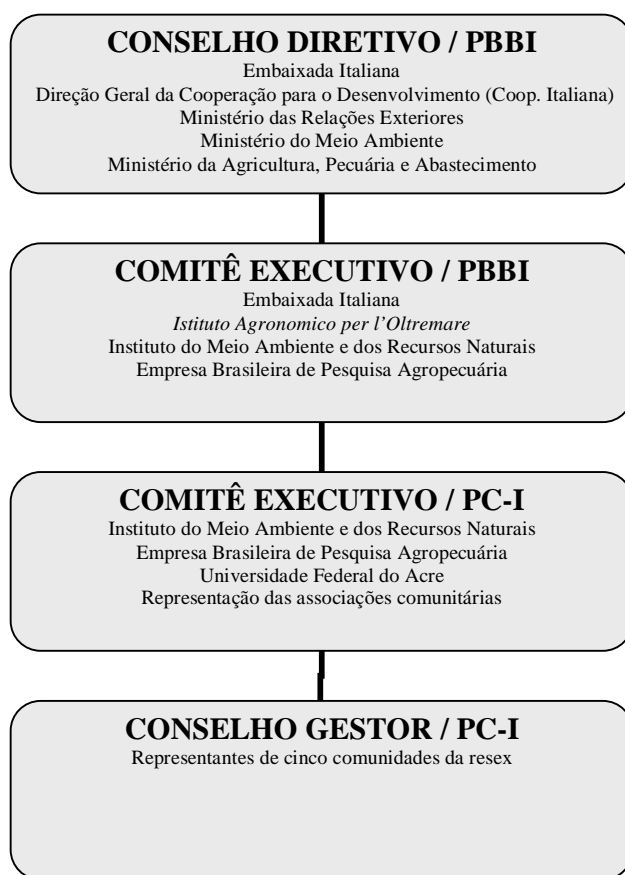
Figura 2: Organograma da estrutura de gestão

O Conselho Diretivo, órgão superior de norteammento e monitoração, é composto pelos representantes brasileiros do Ministério da Agricultura, Pecuária e Abastecimento (EMBRAPA), do Ministério do Meio Ambiente (MMA) e da Agência Brasileira de Cooperação; e pelos representantes italianos da Direção Geral da Cooperação para o Desenvolvimento e da Embaixada da Itália no Brasil.