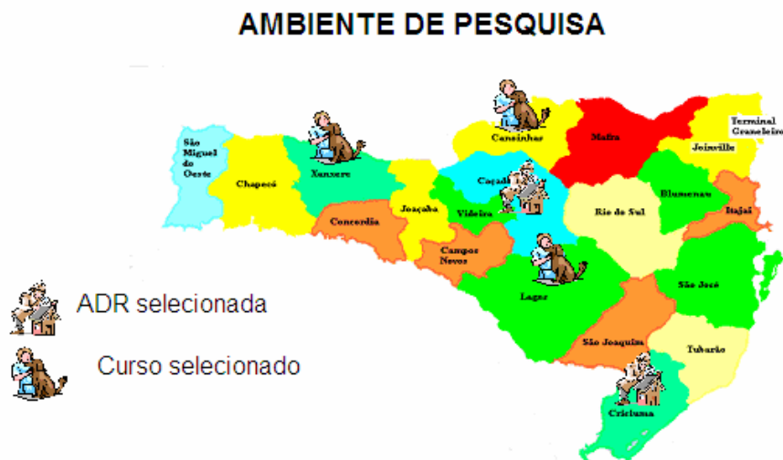
Figura 1: Distribuição das ADRs, dos cursos de Medicina Veterinária e das áreas de trabalho, no espaço catarinense. CIDASC 2006, adaptado.

O trabalho ocorreu nas ADRs da CIDASC de Caçador e de Criciúma e nos campi universitários de: Lages, Xanxerê e Canoinhas (Figura 1). Definiram-se os critérios de seleção das áreas, grupos de profissionais, produção de informações e dados primários, coleta de dados secundários, análise e interpretação do material produzido.