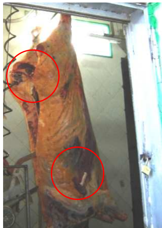
Figura 7. Lesão de ísquio e paleta

Sobre as condições nos estabelecimentos de abate, quando defrontados com a situação presente, os posicionamentos foram mais incisivos em relação ao desembarque (Fig. 8 e 9), à estabulação dos animais (Fig. 10 e 11), à condução dos animais para o sacrifício (Fig. 12 e 13) e ao processo de insensibilização (Fig. 14 e 15), onde esta última operação, na maioria dos