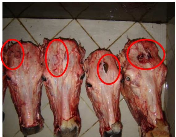
Figura 16. Insensibilização imperfeita (observe-se o chifre do animal em destaque) Figura 17. Lesões resultantes de insensibilização por marreta. (Foto: Nilton D. de Farias, maio/2007)