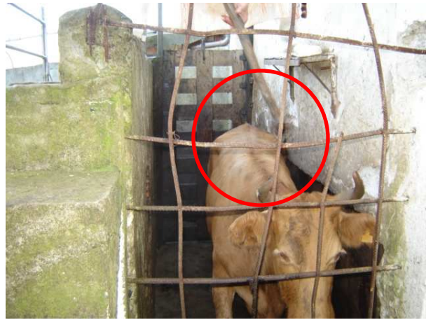
Figura 14. Métodos de insensibilização: martelete pneumático. Figura 15. Métodos de insensibilização: marreta