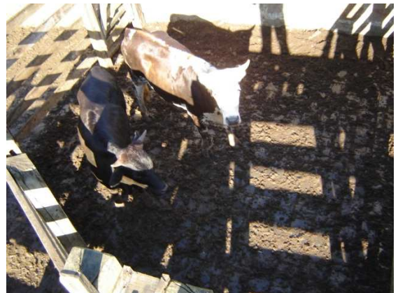
Figura 10. Mangueira de espera correta, divisórias com material não traumático. (Foto: Fábio de Carvalho Ferreira, maio/2007) Figura 11. Mangueira de espera incorreta (Foto: Nilton Driessen de Farias, maio/2007)