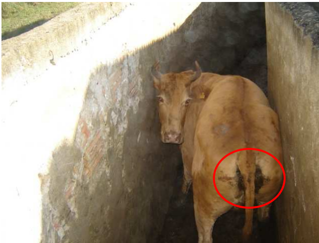
Figura 4. Lesão de transporte: ísquio