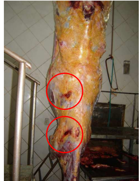
Figura 5. Lesão de pescoço e cernelha