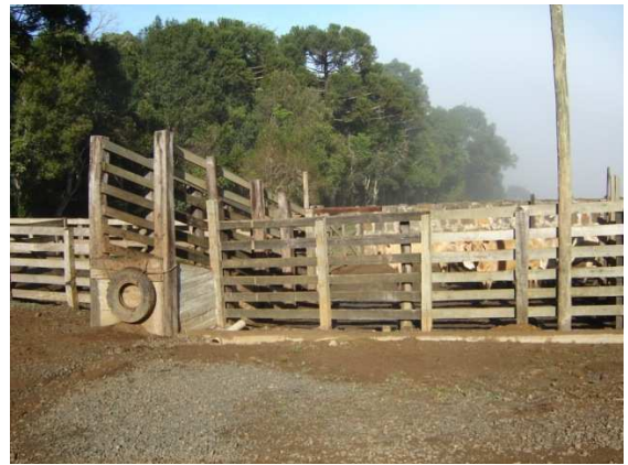
Figura 8. Descarregador correto compatível com a altura dos veículos e piso com antiderrapante