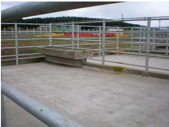
Figura 9. Descarregador incorreto incompatível com a altura dos veículos, sem piso antiderrapante, Nilton Driessen de Farias, maio/2007)