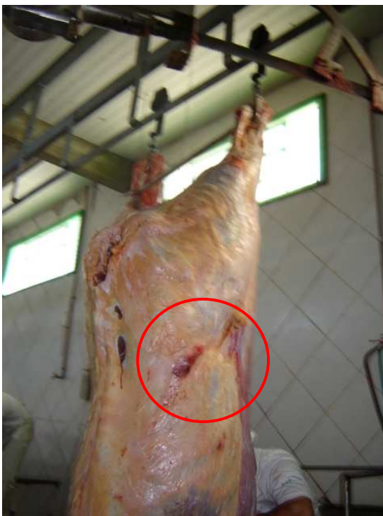
Figura 6. Lesão de costela (Fotos: Nilton Driessen de Farias, maio/2007)