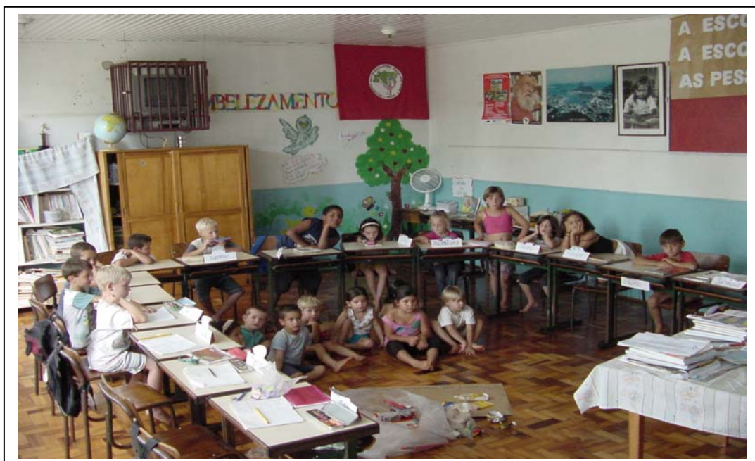
FIGURA 5 - OS ALUNOS DA ESCOLA CONSTRUINDO O CAMINHO DISCUTINDO O TEMA GERADOR 'EMBELEZAMENTO'.