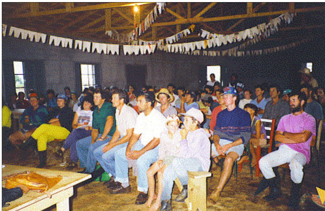
FIGURA 4 – MOMENTO EM QUE OS ASSENTADOS DISCUTEM PROPOSTAS REFERENTES À POLÍTICA, PRODUÇÃO E AO CONSUMO NO ASSENTAMENTO.