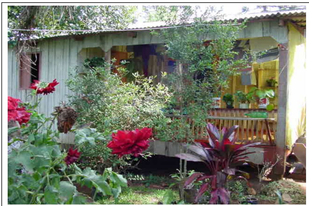
FIGURA 2 – MODELO DAS PRIMEIRAS CASAS CONTRUÍDAS NO ASSENTAMENTO