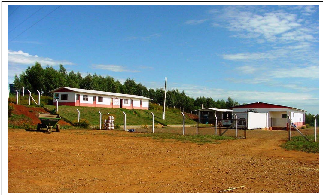
FIGURA 6 – ESCRITÓRIO E UNIDADE FRIGORÍFICA DE ABATE DE FRANGO .

Assentados têm do seu trabalho, e de sua condição social.