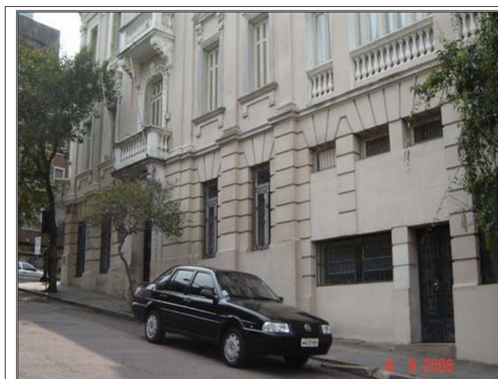
Figura 2 - Local da Auditoria em relação à rua

A sede da 1ª Auditoria da 3ª Circunscrição Judiciária Militar encontra-se na esquina das Ruas Duque de Caxias e General Portinho, centro de Porto Alegre, RS. É um prédio imponente, com um pé direito (altura) maior do que todos a sua volta.