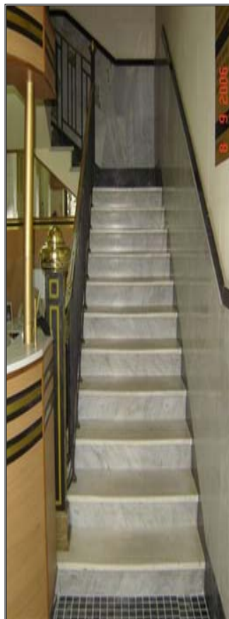
Figura 4 - Escadaria de acesso ao 2º andar da Auditoria Militar

Ao adentrar na Auditoria Militar, impressionado pela majestosa arquitetura do prédio, isolada por uma porta de ferro fechada e guarnecida por uma sentinela, terá ainda que subir dois lances de degraus, em mármore, pedra sagrada, até