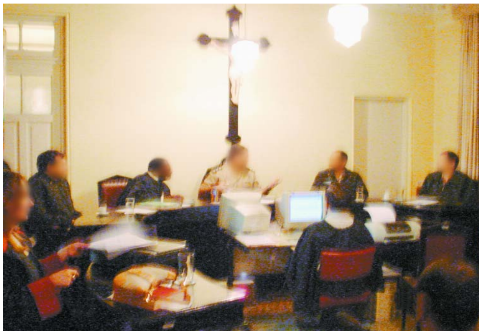
Figura 12 - Disposição e composição do Conselho de Justiça Permanente

O Conselho de Justiça Permanente é composto por 1 (um) Juiz-Auditor (civil) e 4 (quatro) Juízes-Militares, 3 (três) Juízes oficiais de posto de capitão ou capitão-tenente e pelo seu presidente, um oficial superior. Os Juízes-Militares que irão compor o Conselho por um trimestre serão sorteados dentre os oficiais da carreira que estejam prestando serviço na área da Circunscrição da Auditoria, em audiência pública, na presença do Procurador e do escrivão, passando a atuar após o recebimento da denúncia no processo.