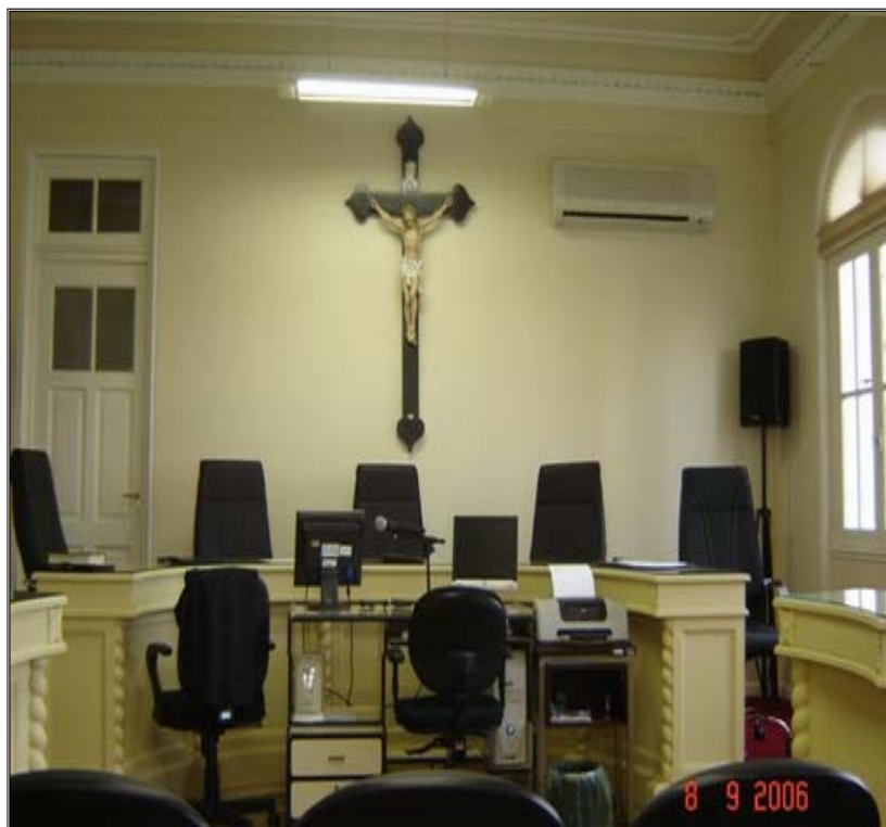
Figura 7 - Disposição interna da sala de sessão de julgamento (pós-reforma)