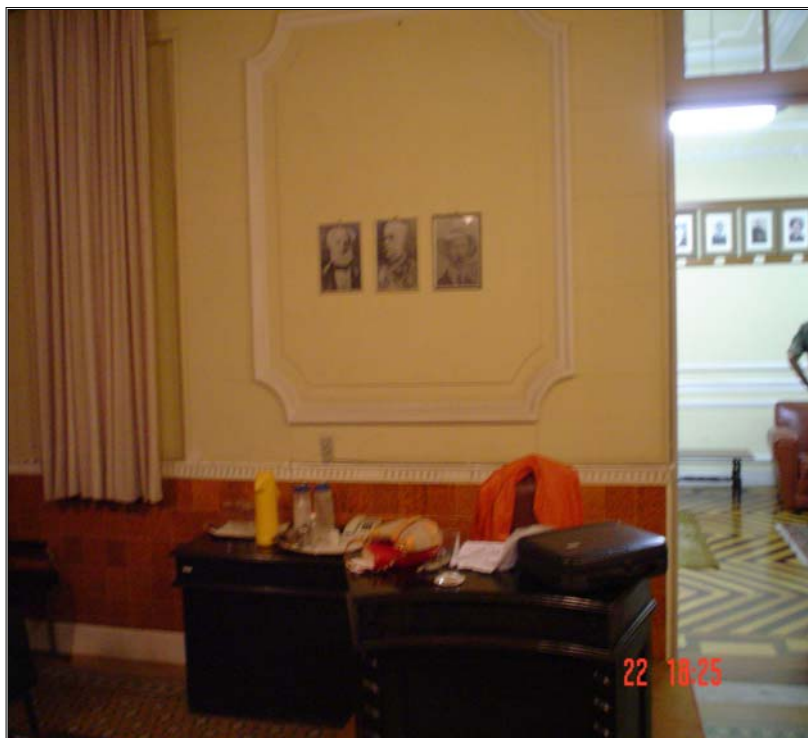
Figura 11 - Local em que fica o Ministério Público Militar