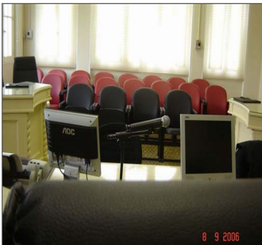
Figura 9 - Visão do Juiz-Militar Presidente