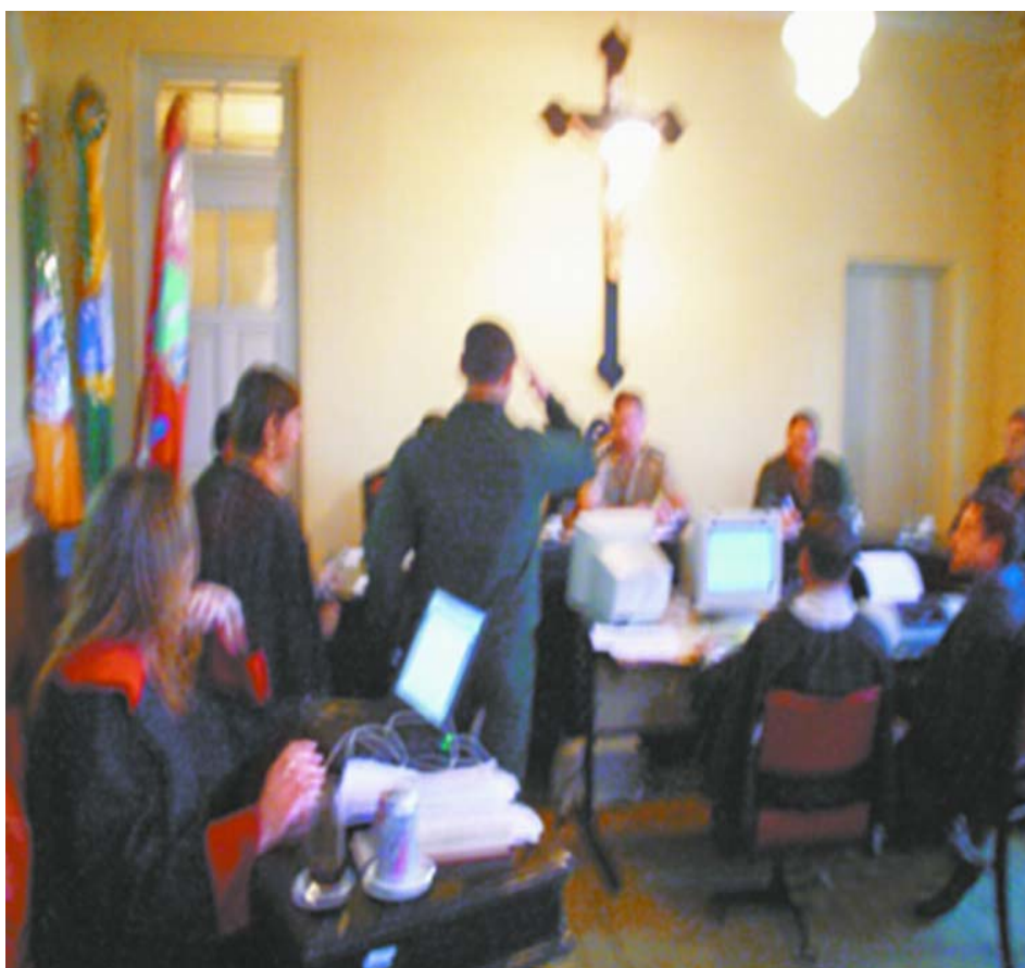
Figura 13 - Soldado/acusado apresentando-se ao Conselho de Justiça Permanente

No dia e hora designados para o julgamento, reunido o Conselho de Justiça e presente todos os seus juízes e o procurador, o Presidente declarará aberta a sessão e mandará apresentar o acusado. Já na redação do art. 431 do Código de