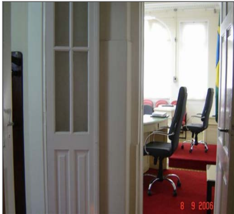
Figura 6 - Sala dos Juízes-Militares

Os Juízes-Militares percorrem o mesmo caminho que todos os outros atores, porém permanecem em uma sala separada, atrás da sala de audiência e além da sala de espera, em que ficam as testemunhas, o acusado e o público em geral. Desta forma, não têm contato com o impuro. Esta sala é reservada, em tese, para que estudem o processo antes do julgamento, tendo em vista que o Conselho de Justiça Permanente, que é o competente para julgar o soldado, tem duração de um