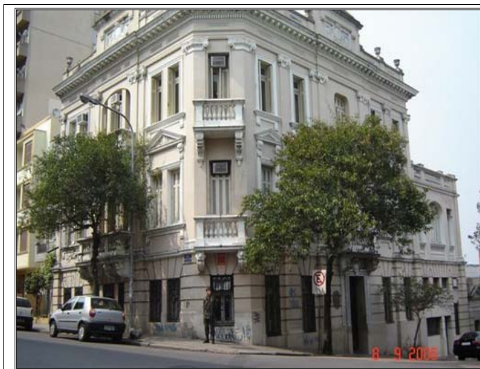
Figura 1 - Fachada da 1ª Auditoria da 3ª Circunscrição Judiciária Militar

(soldado) já está sendo preparado para ocupar o lugar ou estado neste ritual judiciário específico.