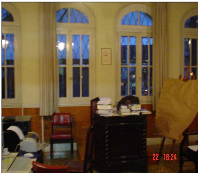
Figura 10 - Local em que fica a Defesa