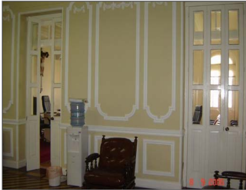
Figura 5 - Sala de espera

O acusado, ao cruzar a porta de ferro na entrada da Auditoria que separa o mundo profano do sagrado, como os demais, até então experimenta um temor imposto pela altivez da arquitetura em que está inserido; começa a fazer parte do ritual da sessão de julgamento, muitas vezes sem notar. Após, ele irá subir os dois lances de escada e adentrar em uma sala de proporções enormes em relação às outras divisões internas da Auditoria, local em que se espera a realização da sessão de julgamento. Até este momento, em tese, todas as pessoas seriam iguais (se é que existe igualdade). O que vai diferenciá-los, a partir de então, serão vestes, posturas, falas e como serão chamadas no outro recinto, ou seja, a sala de audiências.