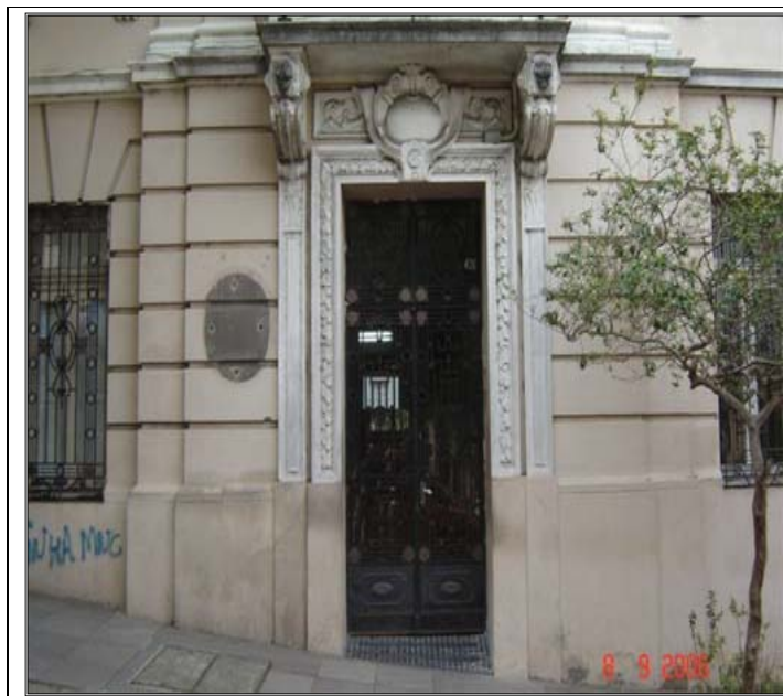
Figura 3 - Porta de acesso ao prédio da Auditoria Militar

A porta 200 de acesso à Auditoria, de ferro, na maioria das vezes fechada, não trancada, guardada por uma sentinela que faz a segurança nos arredores da sede da Justiça Militar da União, demarca o espaço ou a ruptura do mundo profano com o do sagrado 201 . Tem a função de evitar qualquer contato involuntário e inopinado com o sagrado. Define o limite entre o espaço judiciário e o profano da cidade. Representa os atributos sagrados do templo da justiça. Interessante notar que não está no mesmo nível da rua, e, sim, acima deste, no ponto mais elevado, começando ali a escalada ao local mais alto, através de degraus que simbolizam uma ascensão a um local mais sagrado de um lugar sagrado. Assemelha-se a um caminho ou peregrinação espiritual a