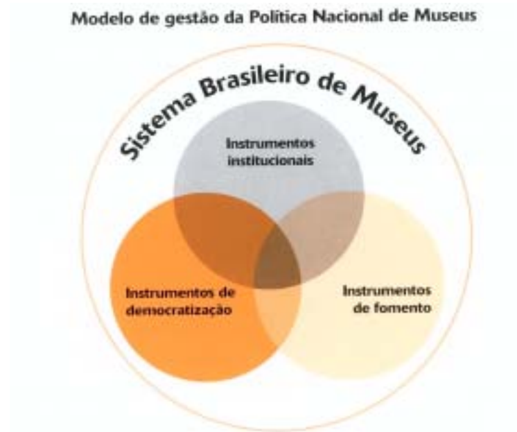
Figura 2: Modelo de gestão do Sistema Brasileiro de Museus

construção, buscando uma museologia alinhada com o contemporâneo e que mantenha uma posição crítica e peculiar em relação à Nova e à Velha Museologia.