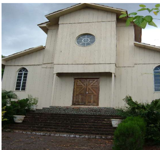
Primeira igreja de Cascavel construída na década de 50.

Familiarizarmos com nosso contexto de estudo significa sermos remetidos a um passado que traz à tona a questão da origem italiana. Isto pode ser notado seja nos nomes de fundadores presentes nas placas de fundação, os quais foram homenageados com nomes de ruas e bairros, seja nos sobrenomes de seus moradores mais antigos, os quais compõem o cenário da tradição da cidade. E, em termos de tradição, a seguir há uma fotografia representativa de um momento histórico do município.