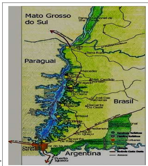
Mapa da região lindeira –

Na região oeste do estado há diversos municípios localizados às margens do lago de Itaipú – denominada de “região lindeira”. Nestes locais há uma “efervescência” lingüística em que outras línguas, além do português, são faladas. Na maior parte dos casos, na modalidade oral.