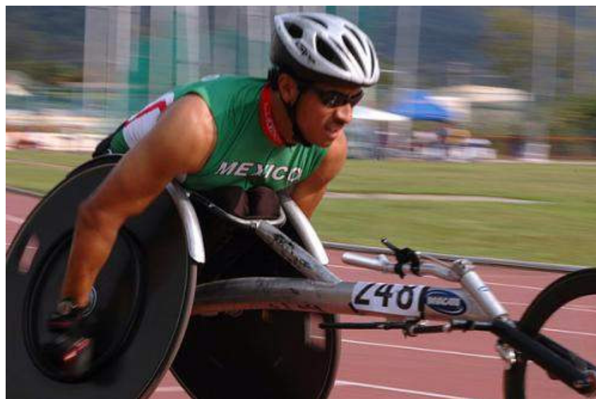
Ilustração 17: Corredor cadeirante em prova de pista.

Entretanto não me parece ser o que se estabelece nas competições entre pessoas com deficiência e, de certa forma, o sentimento que atravessa as falas destacadas anteriores. Pelo que depreende do enunciado podemos constatar que entre os cadeirantes que não vencem as provas, possivelmente não encontramos derrotados. Numa perspectiva psicológica, Samulski (2002) afirma que uma derrota não é por si, uma experiência de fracasso, apontando semelhanças entre as experiências de êxito e as vitórias propriamente configuradas. O êxito, por sua vez, tem uma relação muito próxima com as possibilidades de o atleta atingir o rendimento esperado, independentemente de sua colocação na competição e, no contraponto, as experiências de fracasso são percebidas através de diferenças entre o resultado esperado e o resultado obtido ( idem , p. 145).