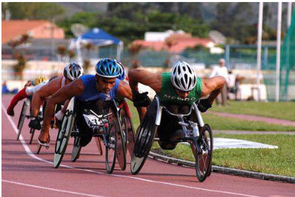
Ilustração 6: Prova final dos 800 metros nos Jogos Mundiais em Cadeira de Rodas e Amputados. Rio de Janeiro, Brasil, setembro de 2005.