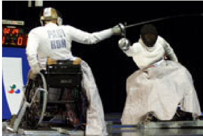
Ilustração 1: Competição de esgrima na paraolimpíada de Sydney em 2000.

atletas, a partir da potencialização de seus corpos, estabeleçam a ação de superar-se duplamente, enfrentando além dos limites de sua materialidade, aqueles inerentes ao esporte de rendimento, e o fazem, talvez, na busca pela maior de todas as conquistas: a manutenção de sua dignidade.