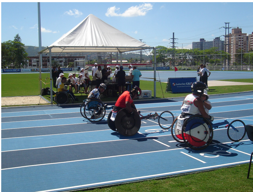
Ilustração 4: Largada de uma prova de corrida de pista.

Foi na função de “estafeta” que consegui capturar informações importantes para a pesquisa. Na verdade – fui me dando conta disso vivendo e experimentando as situações neste tipo de evento – a função de Coordenador Técnico foi importante, especialmente, nos momentos que antecederam a competição, no período de planejamento do evento, nos contatos em busca dos locais adequados, dos equipamentos necessários à realização das provas, enfim na estruturação dos aspectos técnicos imprescindíveis à operacionalização do evento. Logo após o início dos jogos, indiferente a minha condição de coordenador/organizador do evento, me transformei em staff, procurando ajudar em todas as situações inerentes as condições da competição. Como tal pude observar a preparação dos atletas e dos equipamentos nas provas de pista do Atletismo, por exemplo.