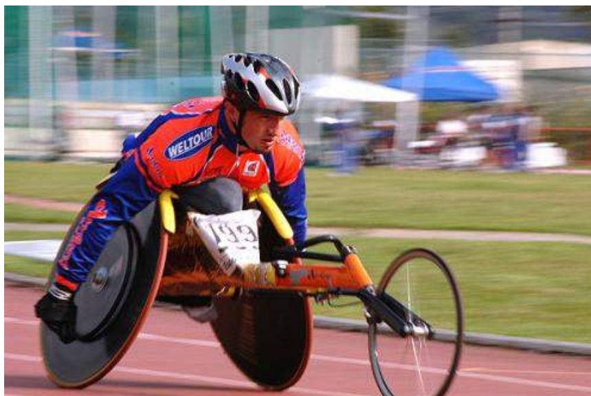
Ilustração 18: Corredor cadeirante em uma prova de pista.

A análise empregada nesse capítulo relacionou o corpo do atleta com deficiência a partir de sua interação e integração com as práticas corporais esportivas, com a potencialização produzida pela ação tecnológica e com sua performance, percebendo a intencionalidade de sua busca por rendimento destacando, sobretudo, sua capacidade de superação. Em todas as etapas da análise entendemos o corpo do atleta cadeirante como um corpo híbrido, que se constitui, especificamente por sua explícita conexão com o artefato protético, um corpo preenchido pela tecnologia.