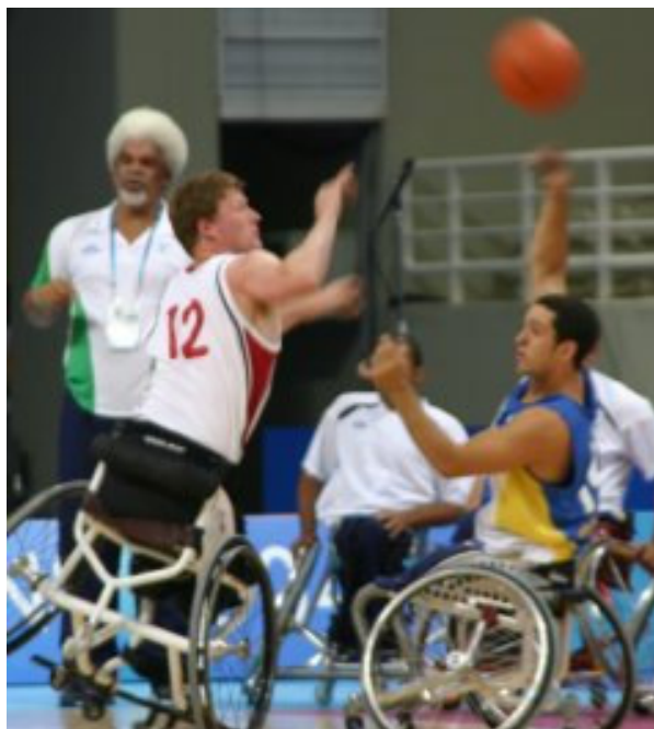
Ilustração 3: Basquete em cadeira de rodas.