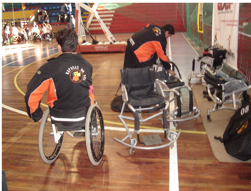
Ilustração 15: Preparando as próteses de performance.

Esse corpo exige, portanto, uma política ciborgue, baseada na luta contra a existência de um código único, “uma teoria universal, totalizante” ( ibidem , p. 108), francamente favorável às fusões biotecnológicas entre homem e máquina, onde ressalto o caráter dinâmico dessas tecnologias e suas redes como instrumentos para a imposição de novos significados.