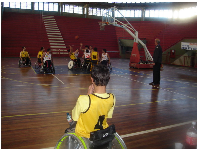
Ilustração 14: Competição da Liga Sul 2006 de basquete em cadeira de rodas.

cadeiras funcionais, acessórios, peças e outros equipamentos para manutenção. Este local é, onde também, fazem a troca das próteses. Na saída do ginásio dois cadeirantes deslocam-se rapidamente até o local de embarque dos ônibus gerando comentários no grupo: "onde vão com tanta pressa, seus chumbados" , alguém comentou. "O ônibus já vai passar, e se a gente perder vamos ter que ir para casa tocando cadeira" , responderam.