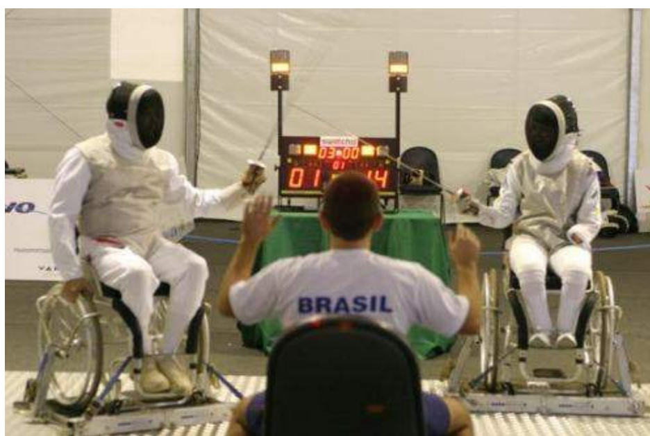
Ilustração 16: Competição de esgrima nos Jogos Mundiais do Rio de Janeiro.

Chovia forte e a estande de tiro estava concorrida. Quatro a quatro os atiradores iam revezando-se, disputando ponto a ponto cada alvo durante o treino de tiro de pistola. No salão principal da sede, um concorrido treino de esgrima adaptada chama minha atenção e dos atiradores que aguardam o momento do treino. O contato das lâminas flexíveis das espadas produz um som eletrizante dando realismo e emoção ao embate, os grunidos de esforço dos atletas precedem esquivas de tronco entre um golpe e outro. A fixidez das cadeiras junto ao “trilho” impossibilita a fuga do esgrimista, evidenciando a coragem e a exigência técnica que a prática da modalidade solicita. Por fim, a máscara de proteção, um equipamento obrigatório que, além de dificultar a visão do atleta, acentua o desgaste provocado pelo calor e complementa o cenário da luta.