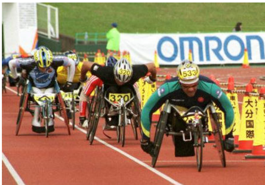
Ilustração 2: Maratona de Tóquio no Japão, 2001.