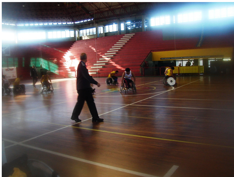
Ilustração 7: Equipe do RS Paradesporto atuando pela Liga Sul 2006.