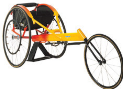
Ilustração 13: Cadeira de performance, de fabricação nacional, para corridas em pistas e ruas.

Vale ressaltar que as próteses de performance fabricadas no país, em especial as cadeiras de rodas, são superadas tecnologicamente pelos equipamentos construídos na Europa e nos Estados Unidos, por exemplo. Isso acaba trazendo um enorme prejuízo ao esporte adaptado brasileiro praticado sobre cadeira de rodas. A constatação é de Marcelo Rubens Paiva, escritor e jornalista, autor de Feliz Ano Velho (1982), obra autobiográfica que narra o acidente em que ficou tetraplégico, em 1979, aos vinte anos. Paiva foi convidado pelo Comitê Paraolímpico Brasileiro para fazer algumas crônicas durante a Paraolimpíada de Atenas, na Grécia e, em uma dessas crônicas questiona o abandono dos investimentos em tecnologia, por parte de países como o Brasil, que poderiam ser aplicados no desenvolvimento de equipamentos a serem utilizados na construção de próteses de performance para nossos atletas. O autor relata: