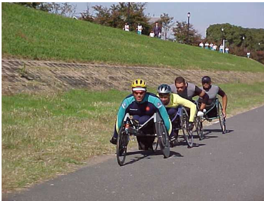
Ilustração 10: Corredores cadeirantes disputando uma prova de rua.

duas rodas laterais (as que ainda lembram uma cadeira de rodas) são construídas a partir de um material composto por fibras de carbono e alumínio com tecnologia aeronáutica. Uma terceira roda auxiliar, localizada na parte anterior, dá a forma triangular a esta máquina que pode atingir a velocidade de até 50 km/h em pista plana. O treino, do ponto de vista do observador, tem características bem semelhantes ao dos ciclistas. São trabalhados percursos fixos com a performance vinculada ao tempo, sempre alternando com períodos de recuperação. Hoje, provavelmente pela temperatura elevada, o corredor terminou seu treino antes do programado, alegando desconforto e cansaço. “ Tem momentos que não sei nem se sou eu que corro ou é a cadeira que corre por mim ”, relata o cadeirante durante um intervalo de recuperação no seu treinamento.