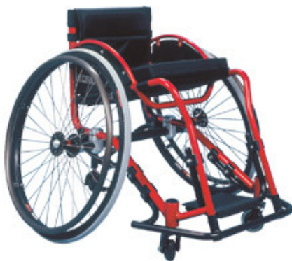
Ilustração 12: Prótese de performance nacional utilizada para a prática do Basquetebol em Cadeiras de Rodas.

pela estabilidade do conjunto, é forjada em poliuretano de 2 polegadas. O estofamento em nylon impermeabilizado de alta resistência, vestindo à estrutura da cadeira através de faixas com velcro que permitem o perfeito ajuste, uma almofada de alta densidade incorporada ao acento e o acabamento em pintura eletrostática, completam o conjunto. Seu preço está em torno de dois mil e setecentos reais.