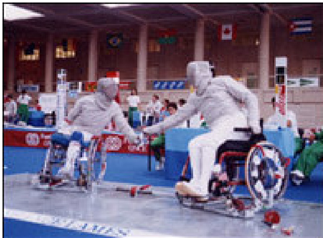
Ilustração 5: Competição de esgrima, Copa do Mundo, Etapa de Viena, Áustria, 2004.