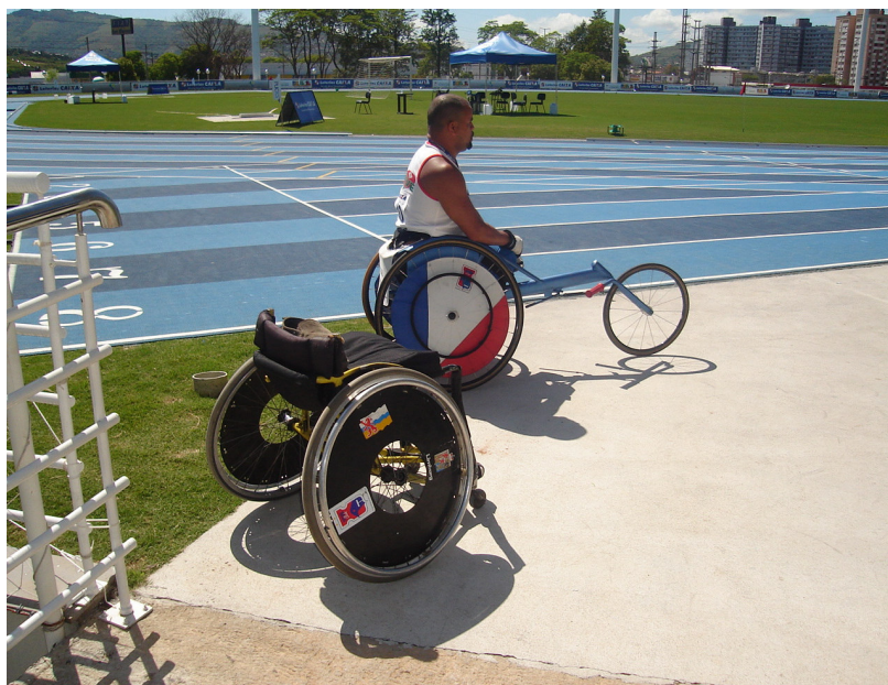
Ilustração 11: Corredor após a troca de cadeiras.