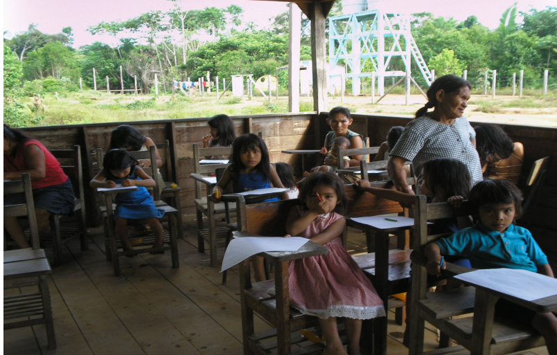
Sala de aula

A Escola Municipal (Indígena) Santo Antonio está inserida no contexto das casas da comunidade e sua construção, de forma arejada e aberta nas laterais, lembra a forma de construção das casas dos Apurinã, embora seja construída de madeira.