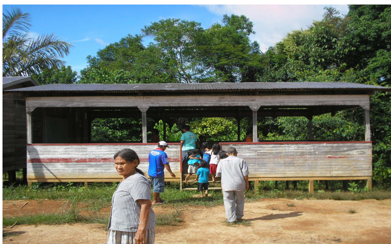
Escola Municipal (Indígena) Santo Antonio