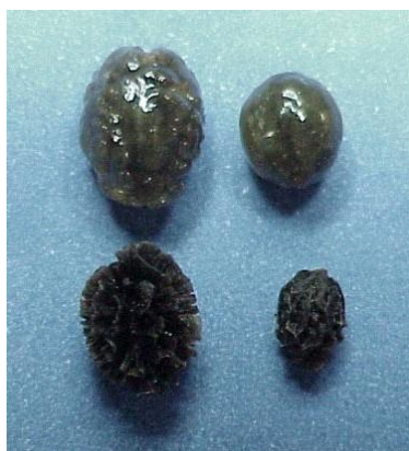
Figura 1 – Sementes referentes a frutos do grupo Formosa e Solo, da esquerda para direita, com e sem sarcotesta.

As sementes provenientes dos frutos do grupo Formosa, cultivares ou híbridos, normalmente são maiores em relação às sementes de frutos do grupo Solo. Na Figura 1 essa diferença pode ser observada em sementes com e sem sarcotesta.