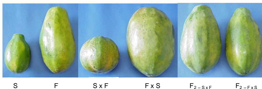
Figura 1 – Frutos correspondentes aos diversos tratamentos utilizados para a extração das sementes.

Na Figura 1 encontram-se os frutos utilizados para a extração das sementes. Os frutos S, F, F_{2-S \times F} e F_{2-F \times S} foram oriundos de flores hermafroditas, por isso apresentam formato piriforme e, S \times F e F \times S originários de flores femininas, com formato mais arredondado.