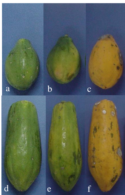
Figura 1. (a) Fruto do genótipo Solo sem repouso; (b) Fruto do genótipo Solo armazenado por 10 dias a 10° C; (c) Fruto do genótipo Solo armazenado por 10 dias a 25° C; (d) Fruto do genótipo Formosa sem repouso; (e) Fruto do genótipo Formosa armazenado por 10 dias a 10° C; (f) Fruto do genótipo Formosa armazenado por 10 dias a 25° C.

Os resultados do teste de germinação encontram-se na Figura 2. A amostra de sementes do genótipo Solo armazenados por 10 dias a 25° C, alcançou o maior percentual germinativo, 93,5%, ao passo que, para as amostras de sementes de frutos sem repouso e armazenados a 10° C, os percentuais foram iguais a 31,5% e 46,0%, respectivamente. Para as amostras de sementes do genótipo Formosa os percentuais de 91 e 97% foram obtidos com as sementes dos frutos armazenados a 10° C e 25° C, respectivamente, seguido por 46,5% correspondente às amostras cujas sementes vieram dos frutos que ficaram sem o repouso. O armazenamento contribuiu para um aumento no percentual germinativo das amostras de sementes de ambos os genótipos. Todavia, para os frutos do genótipo Formosa a temperatura não foi um fator significativo para a melhoria da qualidade das sementes, ao contrário dos frutos do genótipo Solo,