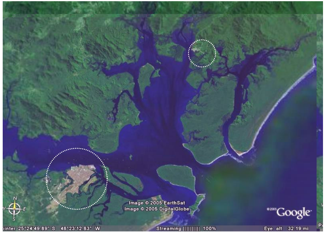
Imagem 1: Baía de Paranaguá