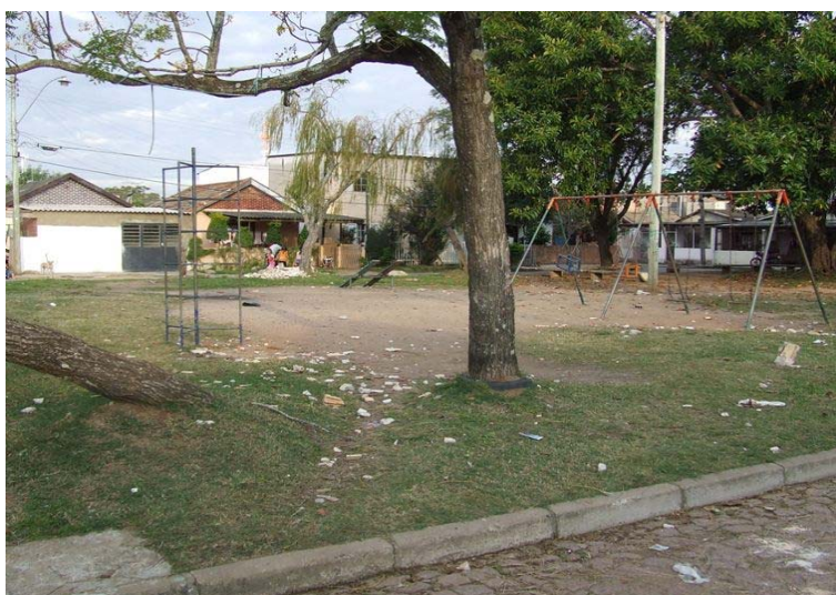
Fig. 7 – Praça Norberto C. da Silveira