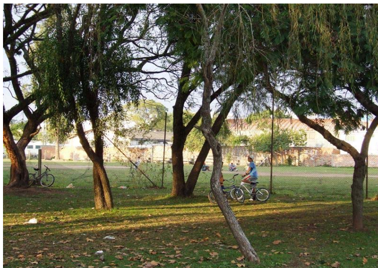
Fig. 9 – “Praça do SESI”