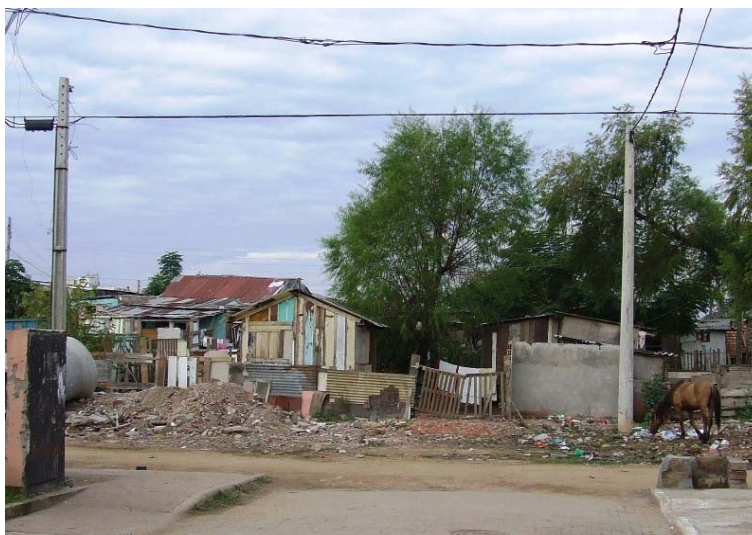
Fig. 2 – Vila Aparecida