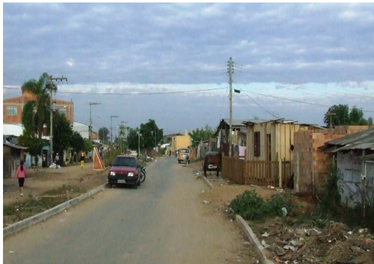
Fig. 3 - Rua Gen. Marcos Kruchin