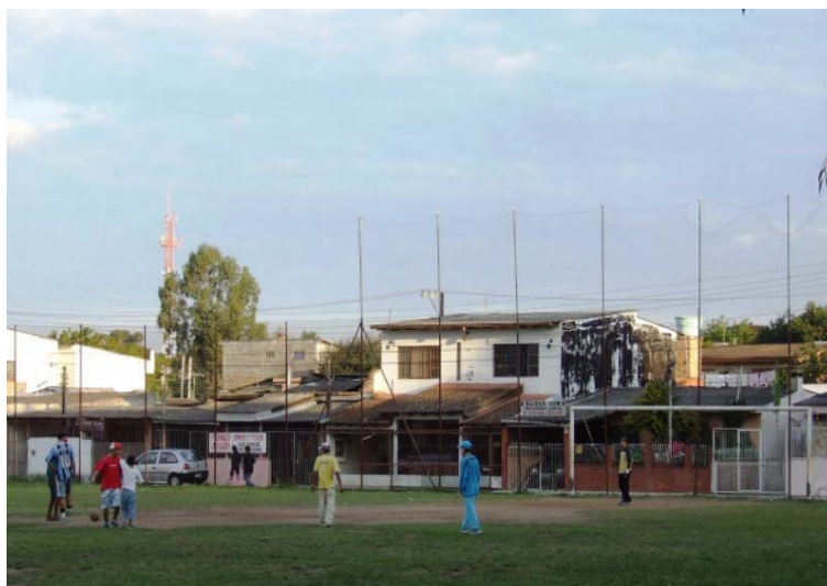
Fig. 11 – Campo de futebol (“Praça do SESI”)