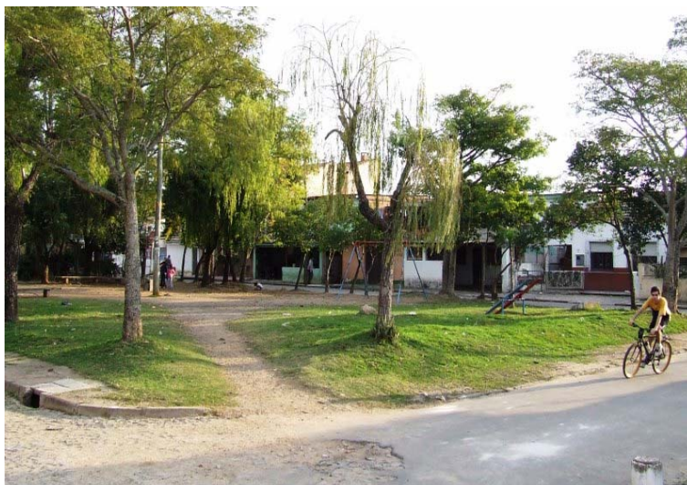
Fig. 6 – Praça Carlinhos Hartlieb