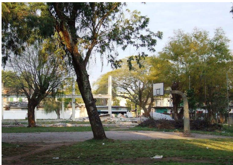
Fig. 10 - Quadra de basquete (“Praça do SESI”)