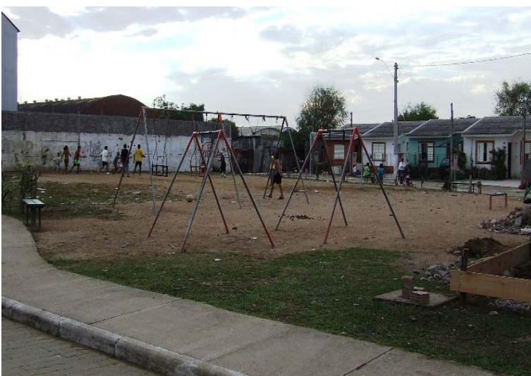
Fig. 8 – Praça localizada junto ao Loteamento Progresso