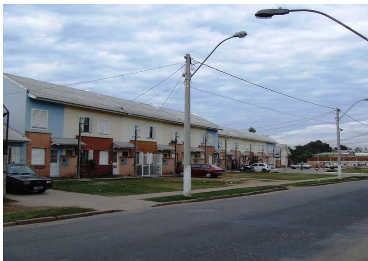
Fig. 1 – Loteamento Progresso