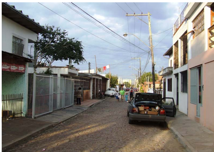
Fig. 5 - Rua Anselmo Manzoli Filho