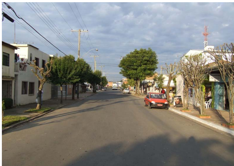
Fig. 4 - Rua Adelino Machado de Souza (Rua "larga")