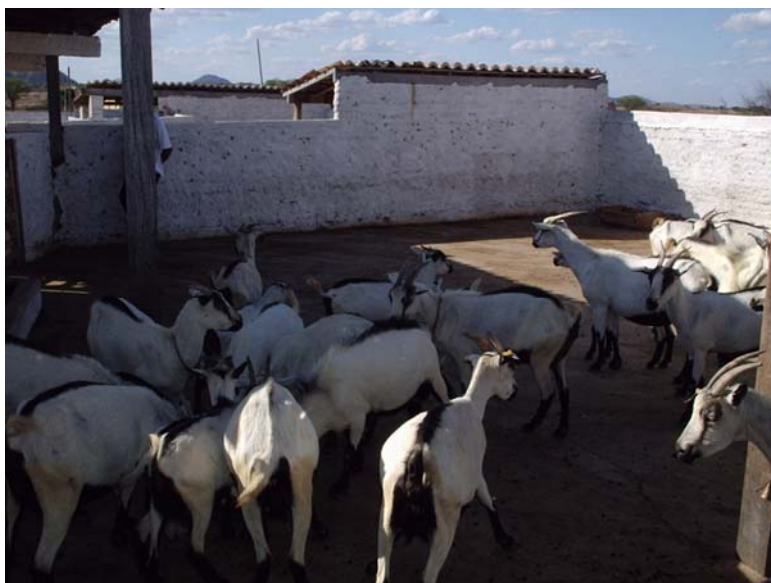
Figura 1 Caprinos Moxotó da Fazenda NUPEÁRIDO