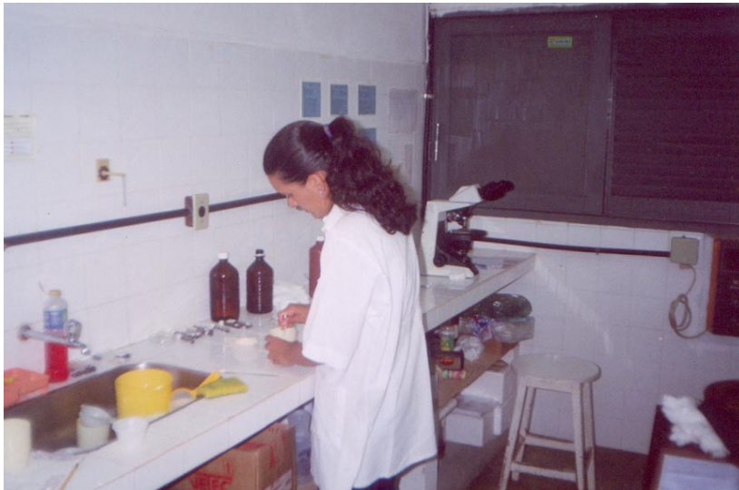
Figura 3. Exames parasitológicos de fezes Fonte LADPAD/UFCG (2004)

O monitoramento da infecção helmíntica foi feito através da determinação do OPG dos animais aos 30 e 60 dias pós-tratamento.