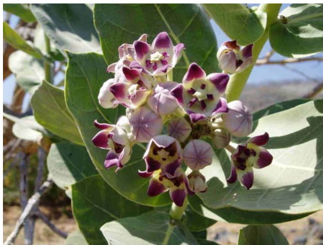
Figura 3. Calotropis procera S. W. – flor de seda.

A Curcubita pepo L. (jerimum ou abóbora), pertence à família das Curcubitáceas . É uma planta rastejante de folhas simples; flores solitárias, unissexuais; fruto peponídeo, muito variável na forma. É comum no Brasil (SALLÉ 1996).