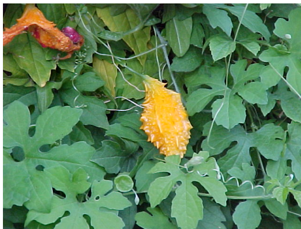
Figura 1. Momordica charantia – Melão de são caetano

Trepadeira encontrada em toda região tropical, muito comum nas cercas à beira de estradas (MATOS, 1994).