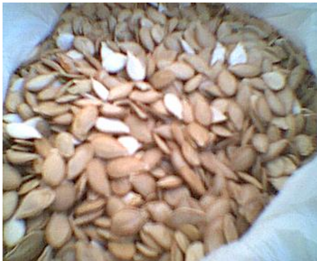
Figura 4. Curcubita pepo L. – semente de jerimum

A Curcubita pepo L. (jerimum ou abóbora), pertence à família das Curcubitáceas . É uma planta rastejante de folhas simples; flores solitárias, unissexuais; fruto peponídeo, muito variável na forma. É comum no Brasil (SALLÉ 1996).