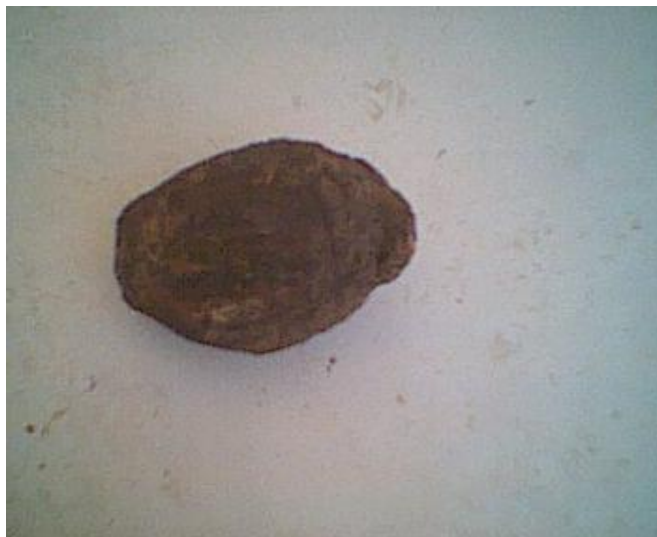
Figura 2. Operculina hamiltonii – batata de purga

permanecem presas à planta por um longo período, até se desprenderem. É uma espécie anual, tem flor amarela e frutos de forma estrelada. Silvestre, mas pode ser facilmente cultivada, plantando-se o seu tubérculo (batata).