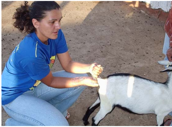
Figura 2 Coleta de fezes

As amostras individuais de fezes foram obtidas diretamente da ampola retal (Figura 2) em tubos de ensaio, devidamente lubrificados com glicerina; identificadas e posteriormente acondicionadas em caixas de isopor com gelo até o encaminhamento ao LDPAD para análises parasitológicas.