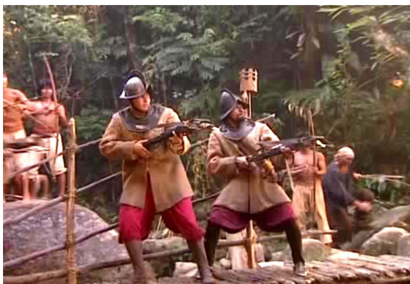
Figura 1 – Cena da batalha no Ribeirão Dourado.

Utilizando a trama ficcional do romance, a minissérie centra seus conflitos na posse do Ribeirão Dourado, tratando em menor grau da atividade de apresamento, que na época expandia-se e tornava-se a principal atividade bandeirante, atingindo seu auge na primeira metade do século XVII. Acreditamos que ao colocar o apresamento de indígenas em segundo plano, a minissérie, em primeiro lugar, aproveita a premissa do romance no qual se baseia, incorporando também uma das importantes razões que fizeram do bandeirante um herói nacional – a descoberta de ouro.