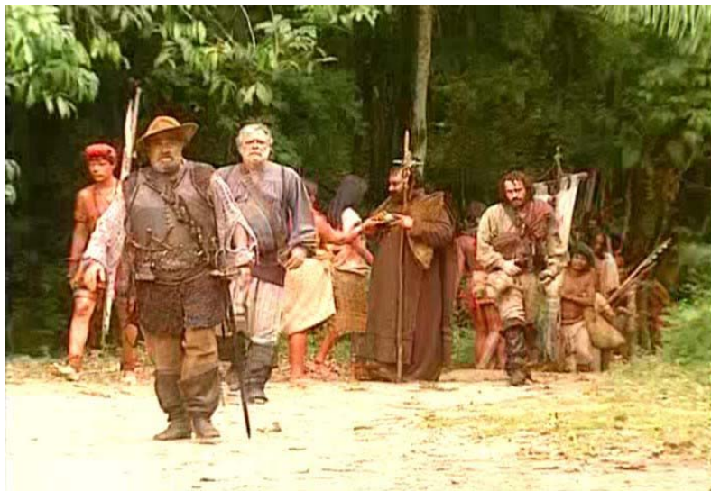
Figura 4 – Imagem da expedição bandeirante. À frente, os chefes brancos, seguidos pelos filhos, pelo capelão e, atrás, por mamelucos e índios.

Os bandeirantes surgem vestidos com coletes de couro marchetados com ferro, os chefes brancos usando botas e chapéus, seguidos por mestiços calçados de alpercatas. Há poucos índios acompanhando a expedição, ao contrário do que apontam os historiadores, como Davidoff (1982), que mostra a importância dos índios nos trabalhos da expedição. Assim, vemos a minissérie conciliar a imagem do bandeirante de botas, branco, líder de subalternos mestiços, com a descrição que encontramos na historiografia, em relação ao número, à estrutura da expedição, aos armamentos e às vestimentas.