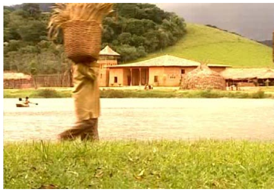
Figura 6 – A fazenda Lagoa Serena.

Como nos descreve Sodré (1979), os inventários e testamentos nos séculos XVI e XVII assinalam a simplicidade da vida piratiningana, a rudeza dos costumes, a carência de recursos, a rusticidade dos utensílios, destacando-se a desvalia dos bens imóveis, em comparação com os dos objetos e roupas de uso. Assim, tal como no romance, Beatriz estranha os trajés simples de algodão das mulheres de Lagoa Serena, bem como as maneiras simples à mesa, e a confusão criada em torno da arca de presentes perdida durante a viagem ilustra a dificuldade em se conseguir adquirir bens de uso em São Paulo.