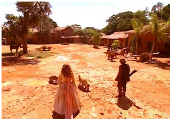
Figura 5 – A Vila de São Paulo de Piratininga.

exercida pelas mulheres da fazenda, no romance e na minissérie, é o comércio doméstico de marmelada que, como aponta mesmo Sodré (1976) foi uma das primeiras atividades comerciais da região.