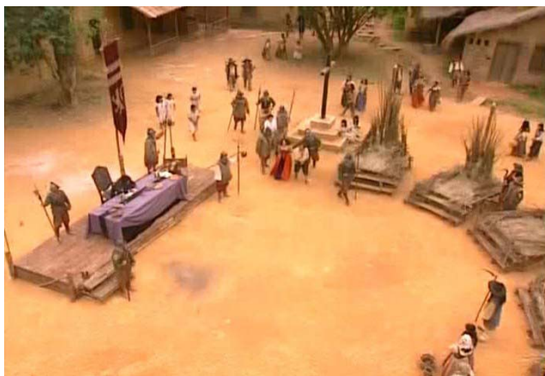
Figura 3 - Tribunal inquisitorial presidido por D. Jerônimo.

Mesmo retirando a ação inquisitorial das mãos dos jesuítas, podemos notar que o tom da minissérie, quando faz uma crítica da Inquisição e da catequização do indígena como forma de dominação, destoa do romance e das comemorações oficiais, que destacam de forma bastante positiva a ação da Igreja Católica na colônia. Quanto ao apresamento, embora a minissérie trate da escravatura dos índios e mostre o sofrimento deles nas mãos dos brancos, mostra e condena a barbárie em si, mas não julga os erros cometidos pelos bandeirantes. Contrariamente aos padres, estes têm a desculpa da dura sobrevivência no meio.