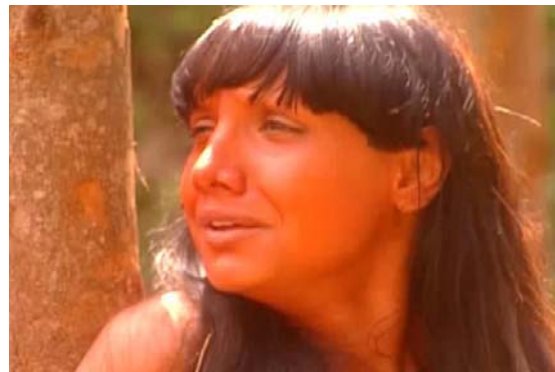
Figura 16 – Moatira, emblema do sofrimento dos índios.