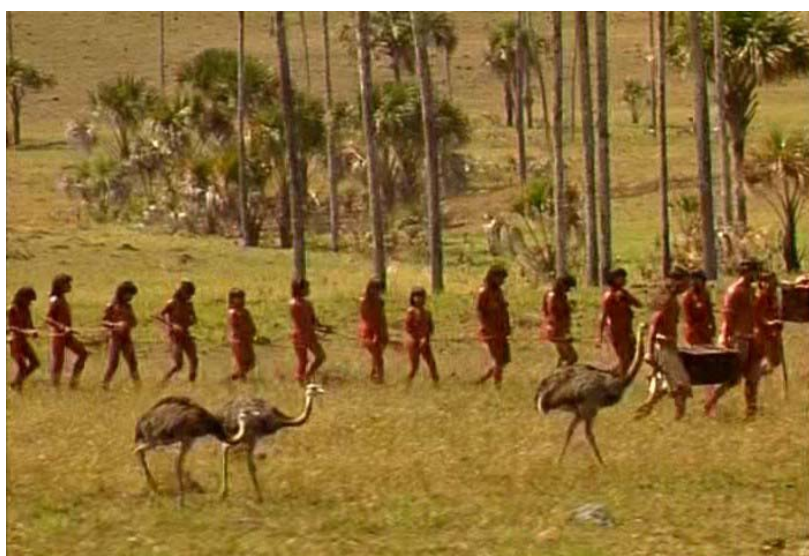
Figura 2 – Transporte de indígenas pela bandeira de Dom Braz.

De acordo com Davidoff (1982), dadas as condições precárias na Capitania de São Vicente, o povoador, não dispondo de recursos para a aquisição do escravo negro, lançou mão do trabalho indígena, que lhe asseguraria os meios de subsistência, de acordo com o regime econômico da época. Com o início efetivo da colonização e a necessidade de braços para o trabalho escravo, para a lavoura e outros serviços é que a “redução do gentio” passou a primeiro plano, levando o colonizador a intermináveis investidas contra a população indígena 118 durante a primeira metade do século XVII.