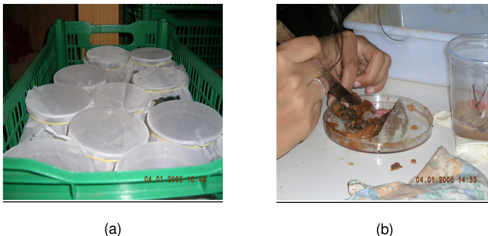
Figura 1- Incubação de frutos de pêsego.(a) forma e local de acondicionamento dos frutos; e (b) avaliação dos frutos incubados.