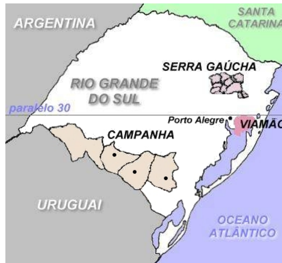
Figura 1- Mapa das regiões vitivinícolas do Rio Grande do Sul.

apresenta, para o amadurecimento das uvas no verão mais ou menos 100 dias de sol, apresenta um solo homogêneo quanto à distribuição, cujas principais limitações são a baixa fertilidade natural, o grande risco de erosão e a baixa capacidade de retenção de água nos períodos de menor precipitação pluvial resultante da baixa proporção de argila (KLAMT et al., 1995).