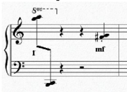
Figura nº 9 - c. 8.

As duas primeiras interferências angulosas (c. 8 e 12) demarcam o início de variações dos materiais antecedentes, sendo que o gesto do compasso 8 prenuncia também a primeira intervenção do motivo nº 3. Neste último (Figura nº 9), o espaço de tempo em que se efetua – a semínima – constitui uma síncope com funcionalidade semelhante à das outras características deste gesto: quebrar momentaneamente a clareza métrica da passagem.