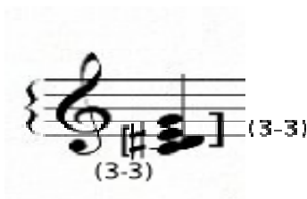
Figura nº 3 - Acorde em Espelho.

Na seção B (c. 13 - 33), a linha melódica é retomada, agora acompanhada por uma sucessão regular de acordes na pauta inferior, os quais impõem estabilidade rítmica ao discurso. Estes acordes não só acompanham a trilha melódica da pauta oposta, como ecoam as alturas que compõem tal trilha . Sua configuração intervalar delinea o conjunto [0, 3, 4, 7] (4-17), que apresenta, por sua vez, dois subconjuntos [0, 1, 4] (3-3) dispostos em espelho 9 .