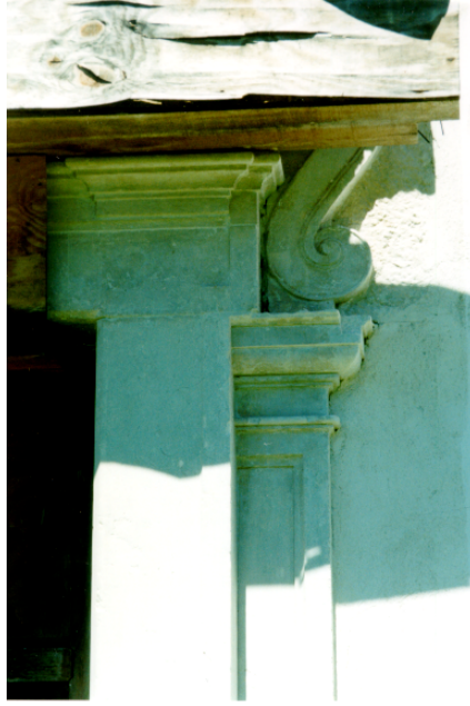
Foto 5 - Detalhes dos ornamentos da parte superior da portada principal da capela