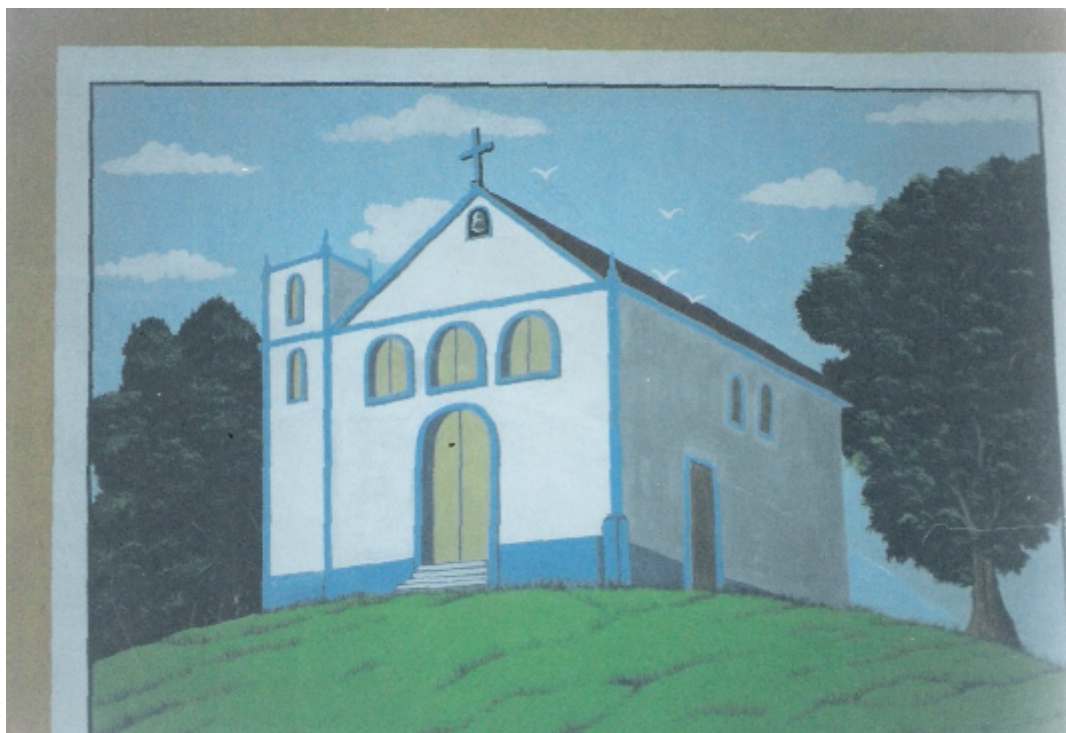
Foto 8 - Painel da Igreja de Nossa Senhora da Conceição de Marapicu

Na descrição acima, a professora C apresenta os painéis com um recurso didático utilizado pela escola, que pode ser explorado pelos demais professores, na apresentação de parte da história da cidade de Nova Iguaçu. Esta iniciativa é prova de que o trabalho de educação patrimonial que desenvolvi na unidade escolar rendeu frutos e pode ser apontado como um recurso didático e uma proposta metodológica mediadora no processo de ensino da História.