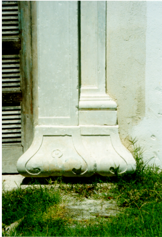
Foto 6 – Detalhes da base inferior da coluna da portada principal da capela

De posse dessas informações, é possível refletir sobre as potencialidades históricas do bairro de Marapicu. Essa história local pode ser explorada na prática pedagógica das escolas que estão no entorno das edificações centenárias, como fiz no CIEP 354 Martins Pena.