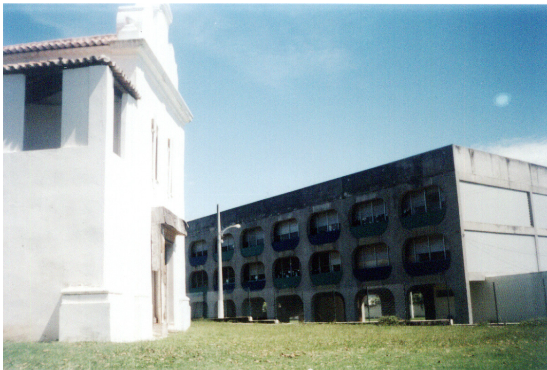
Foto 4 - Contraste da arquitetura barroca da capela do século XVIII, com a edificação contemporânea do CIEP 325 Austregésilo de Athayde

Pelas suas características externas, pode-se considerar que a capela foi construída na fase de transição do estilo maneirista, que predominou na região até o início do século XVIII, para o barroco, arte produzida no Ocidente entre a última década do século XVI e a primeira