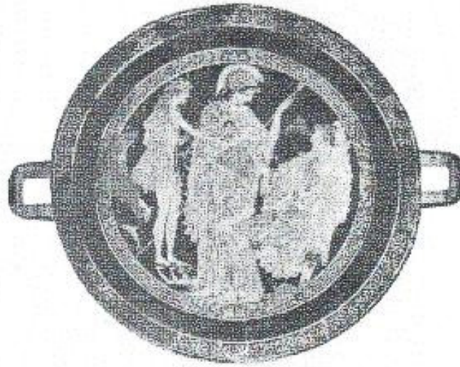
Figura I: Anfitrite entregando a coroa a Teseu. Museu do Louvre, G104.