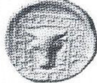
Figura III: O Minotauro no labirinto. Moeda Cretense. Fundo Geral, Gabinete de Medalhas, Bibl. Nat., Paris