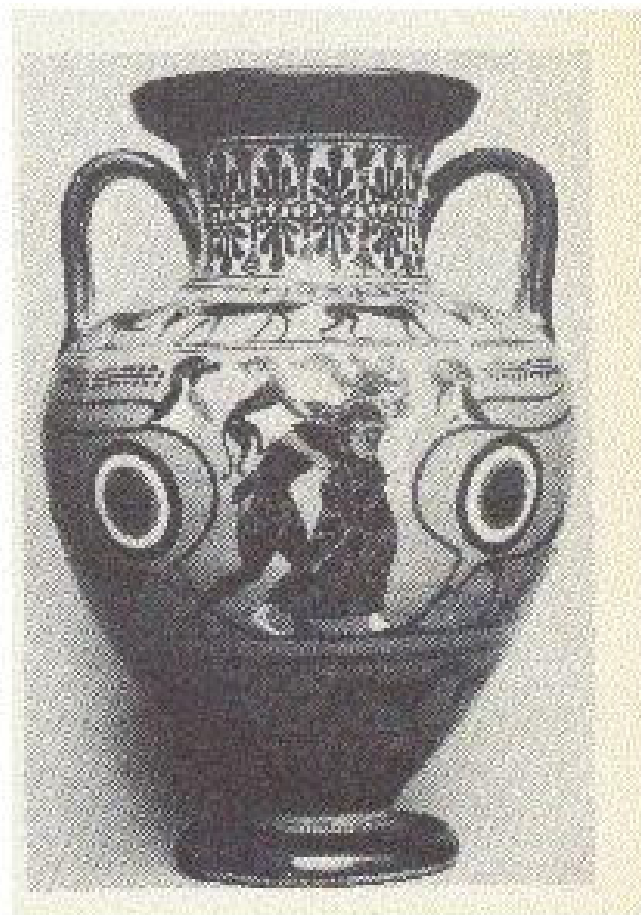
Figura V: Peleu luta com Tétis. Museu Britânico, Londres. B 295. De Vulci ABV290.