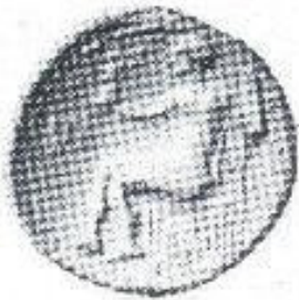
Figura II: Minos (ou Zeus) sobre o labirinto. Moeda Cretense. Fundo Geral, Gabinete de Medalhas, Bibl. Nat., Paris