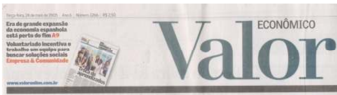
Figura 5 Testeira da capa do jornal Valor Econômico.

Embora venha quase “escondido” na encartação do jornal, Empresa & Comunidade merece sempre destaque na primeira página do Valor. Quando o suplemento é publicado, é feita uma chamada na testeira do jornal na capa (figura 5):