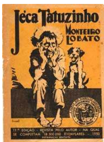
Ilustração 1 Capa do almanaque

No Brasil, proliferaram almanaques de laboratórios, saídos das gráficas que imprimiam os rótulos dos medicamentos. Eram mais que um veículo de propaganda; estabeleceram-se como material de leitura. Afinal, mais que consumidores, buscavam leitores. Neste universo, o Almanaque Biotônico Fontoura é, sem dúvida, o mais importante deles. Impulsionado pelo sucesso do folheto Jecatuzinho (ilustração 1), distribuído anteriormente pelas farmácias, o primeiro número saiu em 1920, elaborado e ilustrado por Monteiro Lobato, com uma tiragem de 50 mil exemplares. Durante muitíssimos anos, das décadas de 30 a 70, o número de exemplares impressos e difundidos do livro do autor de América oscilou entre dois e três milhões e meio. Desde a primeira edição até os anos 70, o Laboratório Fontoura recebeu diariamente uma média de 30 cartas de leitores interessados em seu almanaque (PARK, 1999):