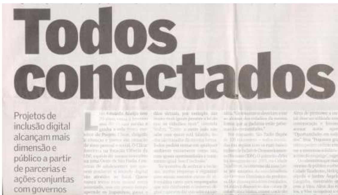
Figura 7 Reportagem de fevereiro de 2004

Um exemplo desta colorização com o elemento humano é a edição de fevereiro de 2004, cujo título é “Todos conectados” (Fig. 7), que fala dos projetos de inclusão digital praticados por diversas empresas.