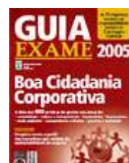
Figura 11 Capa do Guia Exame de 2005

Uma iniciativa que se assemelha é o Guia da Boa Cidadania Corporativa (Figura 1), que já está sua sexta edição anual, lançado pela Revista Exame, do Grupo Abril, em conjunto com o Instituto Ethos. Na edição de dezembro de 2005, 20 empresas foram reconhecidas “por integrar a responsabilidade social às suas estratégias de negócios” 73 : 10 empresas consideradas modelo em responsabilidade empresarial, duas vencedoras consideradas destaques regionais e outras 12 que melhor se classificaram nas sete categorias do anuário.