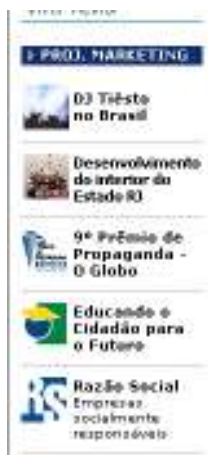
Figura 13 Localização no Globo On line

redação em fevereiro deste ano. A Infoglobo decidiu bancar, mesmo sem patrocínios. Mas já temos Coca-Cola; Furnas e Firjan como patrocinadores”.