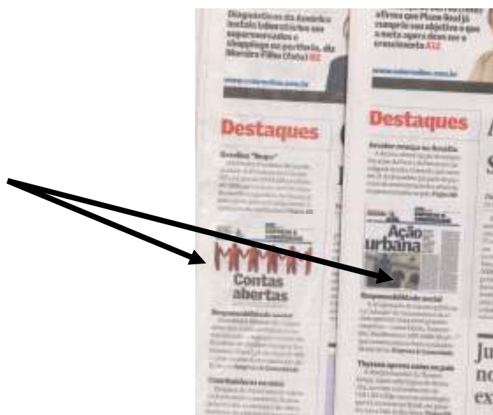
Figura 6 Coluna lateral da primeira página de Valor Econômico

Ou mesmo na coluna da esquerda da primeira página, intitulada Destaques, como se vê nas edições de julho e agosto deste ano: