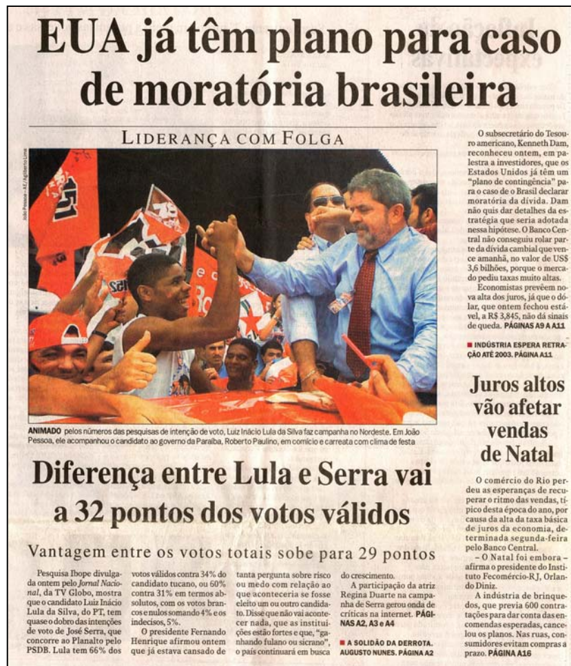
FIGURA 6: JB leva leitor a associar vitória de Lula a calote na dívida externa.

A estratégia da Folha foi pouco diferente: conjugando notícia e propaganda, criou uma atmosfera no caderno Eleições distinta para cada candidato. Uma notícia de capa do dia 29 de setembro falava sobre a possibilidade de vitória de Lula no primeiro turno 34 . Logo abaixo, uma propaganda da Max Steel de bonecos de guerra ocupando cinco colunas, mais da metade da página, dava a ela um aspecto de conturbação. Dois dias depois, uma notícia em cujo título FHC pedia sensatez no lugar de emoção na hora do voto 35 era ilustrada por uma propaganda da boneca Barbie, boneca que materializa para as crianças a imagem de uma vida perfeita.