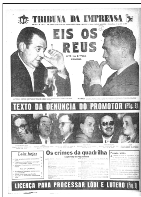
FIGURA 2: Lacerda acusa Wainer (dir.) diretamente (LAURENZA, 1998: 88).

Algumas brigas entre os dois proprietários ficaram famosas. Lacerda foi apelidado de Corvo por Wainer enquanto questionava a origem bessarabiana 22 do adversário. As ofensas entre ambos eram frequentes. Quando Wainer estava sendo investigado por uma CPI, teve sua foto publicada na primeira página da Tribuna.