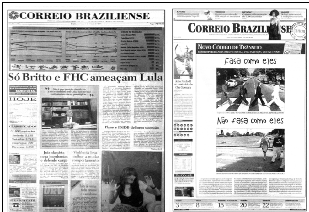
FIGURA 3: Antes (1994) e Depois da reforma (1998): o Correio passou a apresentar um visual mais leve (NOBLAT, 2002: 156 e 158).