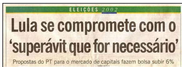
FIGURA 5: Lula passa de vilão a herói.

Vencida a eleição, as organizações Globo prepararam especiais sobre a vida do novo presidente, dando a ele caráter de herói do povo.