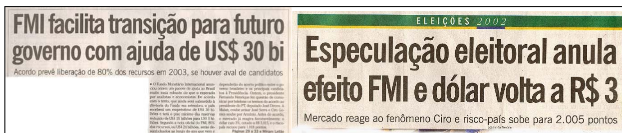
FIGURA 4: O Globo defende o governo e, dois dias depois, ataca a candidatura de Ciro Gomes.

ajudaria o país a fechar as contas públicas no fim do ano, destacando que o valor estava acima das expectativas 29 . Como consequência, o dólar caiu. Dois dias depois, a moeda estadunidense voltou a subir, fato imediatamente atribuído à subida de Ciro Gomes nas pesquisas 30 . O jornal voltaria a atacar o candidato mostrando suas gafes e descontextualizando declarações que poderiam prejudicá-lo. No dia 23 de agosto, publicou na página 4: “TSE proíbe Serra de mostrar na TV Ciro chamando um eleitor de burro” (BRÍGIDO, NAHAS & FILIPINI, 2002).