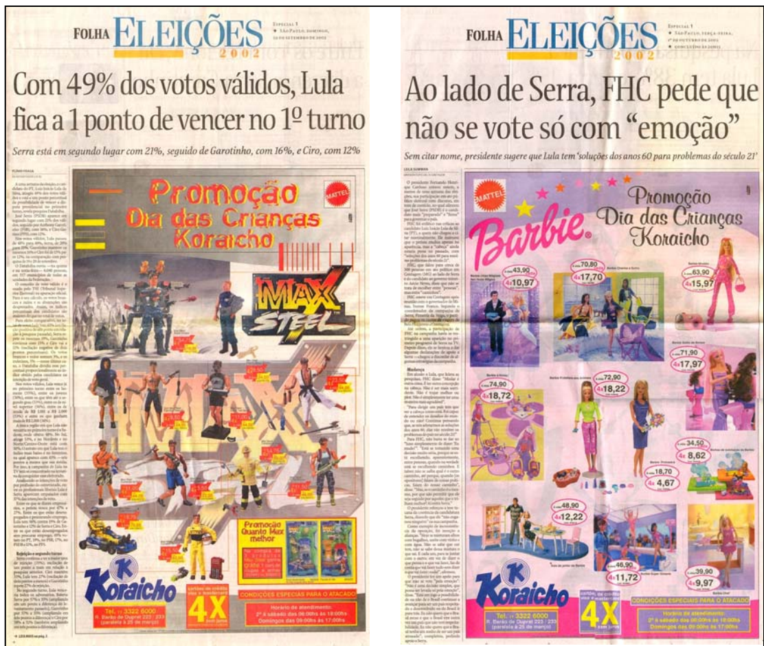
FIGURA 7: Propaganda de brinquedos de guerra logo abaixo do título sobre Lula (E) seguida de propaganda da Barbie abaixo de título sobre Serra dois dias depois.

Ambos os jornais mantiveram os ataques ao presidente Lula tanto durante a fase mais popular de seu governo e durante a crise. O JB assumiu aspectos de imprensa marrom, com manchetes como “PT patina na lama” 36 , “Novas denúncias jogam mais lama nas estrelas do PT” 37 e “Deputados debatem pizza com acórdão” 38 .