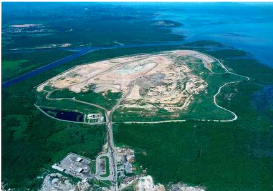
Figura 02 – Visão do Aterro de Gramacho (Junho, 2002).