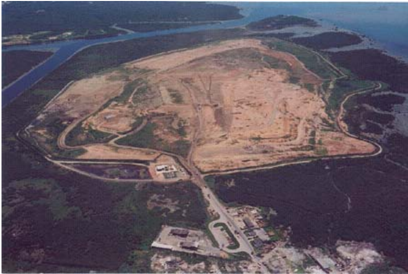
Figura 01 – Visão do Aterro de Gramacho (Novembro, 2000)