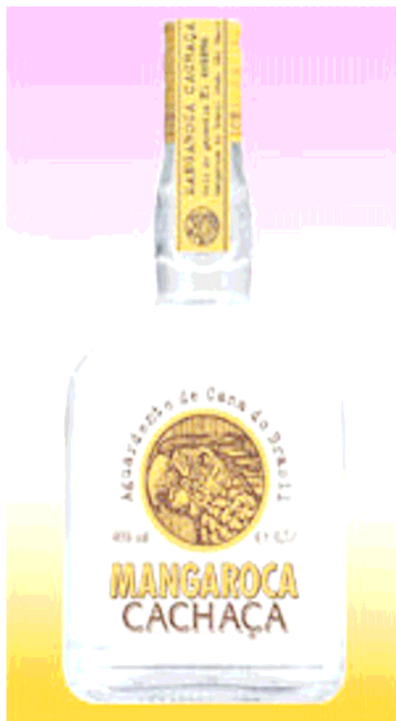
Figura 3 – Marca de produto com Indicação de Procedência “Cachaça do Brasil”

Em seu artigo 1º, o decreto invoca acordo de comércio exterior para assegurar o trânsito dos produtos junto aos países signatários: “O nome ‘cachaça’, vocábulo de origem e uso exclusivamente brasileiros, constitui indicação geográfica para os efeitos, no comércio internacional, do art. 22 do Acordo sobre Aspectos dos Direitos de Propriedade Intelectual relacionados ao Comércio, aprovado como parte integrante do Acordo de Marraqueche, pelo Decreto Legislativo nº. 30, de 15 de dezembro de 1994 e promulgado pelo Decreto nº. 1355, de 30 de dezembro de 1994.” (BRASIL, 2001)