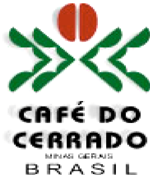
Figura 4 – Marca (selo) da Indicação de Procedência “Café do Cerrado”

O mais recente registro de indicação geográfica concedido no Brasil foi para o Café do Cerrado de Minas Gerais. Em tramitação desde 1999, o selo foi concedido pelo INPI ao Conselho das Associações dos Cafeicultores do Cerrado – CACCER em junho de 2005. (Figura 4)