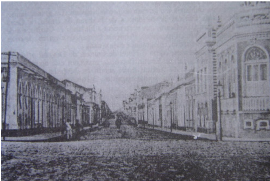
Ruas largas, calçamento de pedra irregular e arborização ausente. A cidade havia parado no tempo? Rua Barão do Rio Branco, em 1922.

comentarista do jornal A Razão . Contudo, sua insatisfação advinha menos dos transtornos ao trânsito que o calçamento pudesse causar, que do aspecto desolador que conferia à cidade, infundindo-lhe, ao lado de outros elementos, certo ar nostálgico, impressionando negativamente o visitante que por ali se demorasse: “Ruas largas, ladeadas de casas baixas, de fachadas arcaicas, sem qualquer arborização, tornam Fortaleza uma cidade nostálgica”. 25