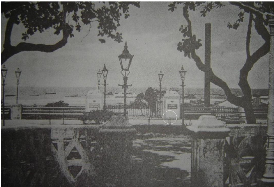
a templo da memória. A segunda imagem confirma o abandono: bancos arrancados (ver destaque) e vegetação escassa.