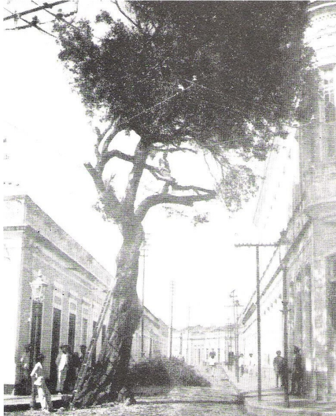
A foto do oitizeiro do Rosário encomendada por Álvaro Weyne. O trabalho ainda se iniciava: notem o funcionário no alto da árvore e o guarda à espreita, na calçada oposta, postado para assegurar o cumprimento do serviço.

A aparente contradição também pode ser divisada na crônica de Alcides Mendes. Ele dizia que fora assistir ao “assassinato” do oitizeiro do Rosário, e alude a um diálogo que mantivera com um “situacionista”. Contou que, aportando ao local, indagara a alguém: “porque se fazia aquilo?”. No que lhe responderam: