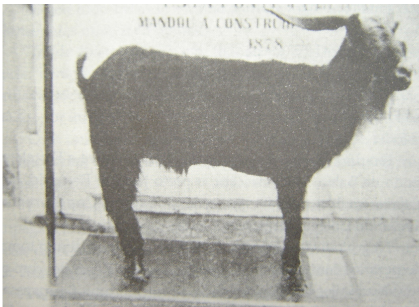
O Bode Yoyô, exposto no Museu Histórico: a cidade perdia sua “mascote”, e o Museu ganhava uma de suas maiores atrações (fonte: MENEZES, 2000, p. 185).

No entanto, cumpre informar que se a morte do Bode Yoyô simbolizava, na crônica de Raimundo de Menezes, o fim da cidade provinciana ainda não civilizada pelo tráfego – “o tráfego de veículos aumentava, a civilização chegava...” – com animais a vagar pelas ruas, estes ainda compunham sua paisagem, não obstante o empenho dos administradores da cidade em civilizá-la, suprimindo traços de outras temporalidades que a habitavam. 214 Estas se mostravam no cotidiano de Fortaleza, em jornais que denunciavam animais soltos em vias públicas e noticiavam acidentes em que estavam envolvidos.