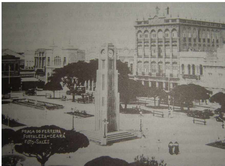
A Coluna da hora, na Praça do Ferreira. O relógio ganhava centralidade, impondo uma nova duração à cidade. A verticalidade urbana também se insinuava no Majestic Palace, o maior prédio ao fundo.

O atraso da urbe não se manifestava apenas em seus cronômetros: a deficiente iluminação pública a gás se constituía em outro elemento que atravancava a marcha da cidade no rumo da civilização. 68 A iluminação elétrica de ruas e praças, inovação de 1934, substituiu um sistema abastecido por combustores “antiquados” e em número insuficiente, na percepção de articulista do jornal A Razão . 69 Não bastasse o apontado, os postes eram acesos alternadamente desde 1914, segundo João Nogueira, em função das dificuldades impostas pela Primeira Grande Guerra ao fornecimento de carvão de pedra, combustível de que dependia o sistema. O que, no entanto, não o impedia de lembrar o tempo em que “a nossa iluminação pública, se não era a melhor, era das melhores do país”, superior, inclusive, à nova iluminação, conforme afirmava em artigo publicado em julho de 1938, dedicado às formas de iluminação pública que a cidade já conhecera.