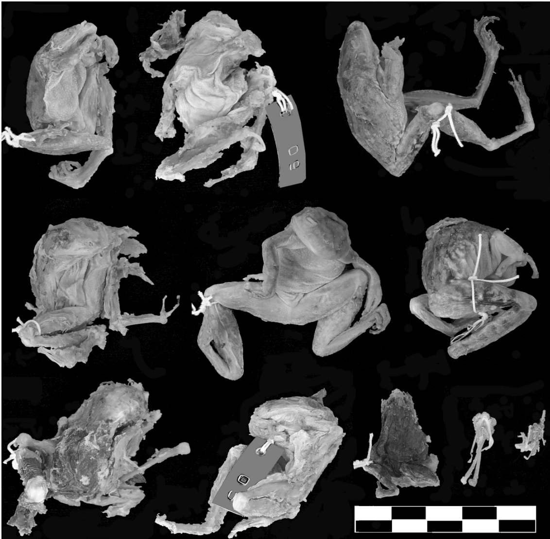
Fig. 2. Ten anurans found in a single female bullfrog stomach (92.6g), (ZUFMSM 3297) weighing 465g and SLV of 145.74mm. Collected in December 2002 at the dam in Dona Francisca (Agudo – Rio Grande do Sul – Brazil). Scale=5cm