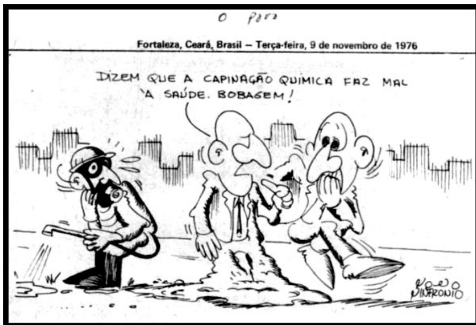
Figura 1. Charge sobre aplicação do herbicida. O Povo, dia 09.11.1976.

Esta charge apresenta uma senhora, dona de casa, de classe social popular, que, consultada a respeito da capinação química, demonstra preocupações com o destino do capim que se transforma em lixo, depois de aplicado o produto. A imagem traz a observação sobre a produção de resíduos, chama a atenção para o percentual do produto exposto ou absorvido pelo solo, podendo contaminar o lençol freático ou outras vias de contaminação. Ainda neste quadro pode-se observar a expressão de surpresa do pesquisador alerta que, provavelmente, não foi informado do processo de capinação.