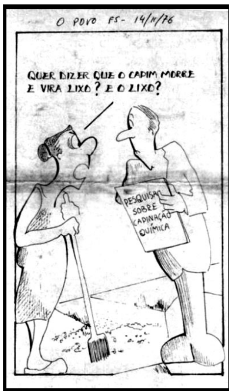
Figura 2. Charge sobre aplicação do herbicida. O Povo, dia 14.11.1976.

A suspensão da capinação química pela Prefeitura Municipal de Fortaleza foi a primeira vitória do grupo da SOCEMA. Todavia as ações e o debate contra o método de capinação química ficaram concentrados entre os técnicos e gestores, e não houve a participação mais efetiva da população dos bairros atingidos pela capinação química. O grupo da SOCEMA demonstrou ousadia ao opor-se à administração pública, ao levantar críticas e exigir mudanças em projetos lançados pelos órgãos governamentais, em período em que não havia espaço para intervenção na sociedade. Outro foco de críticas, no mesmo período, demonstrou a ousadia dos membros da SOCEMA, para sugerir mudanças em projeto do Governo do Estado, pela Companhia de Água e Esgoto do Ceará – CAGECE, que derrubaria os coqueiros da Avenida Beira Mar.