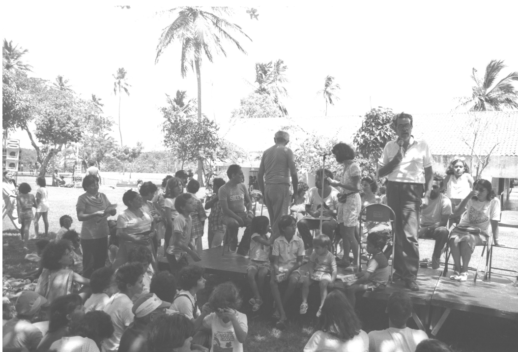
Figura 9. Foto do piquenique.

Novamente as pessoas se reuniram, em apoio aos ambientalistas, participaram das discussões e atividades artísticas, conforme fotografia.