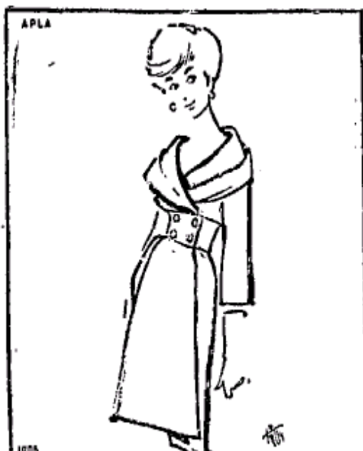
(fig. 3) 26

(Interessante modelo para tarde com saia justa e “painel” que simula cair do corpete. Mangas três-quartos e ampla faixa (cinto) com quatro botões)