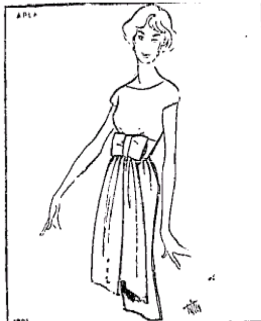
(Fig 2) 25

(Abrigo elegante de grande efeito com dupla fileira de botões. Corte trapézio. Gola drapeada em forma de chale)