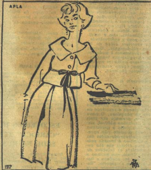
Interessante conjunto de saia pregueada e jaqueta. Grande decote.