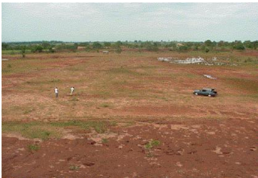
Figura 4- Vista geral do local da área experimental em novembro de 2002.

Pela grande circulação de máquinas, o solo remanescente da área experimental apresentava-se compactado e totalmente desprovido de vegetação (Figura 4), em decorrência da retirada da camada mais fértil.