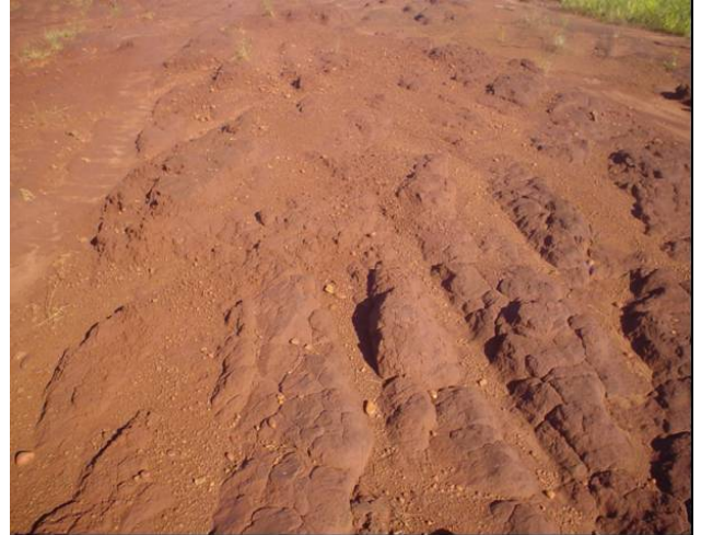
Figura 6 - Vista geral da área com solo exposto (T2).