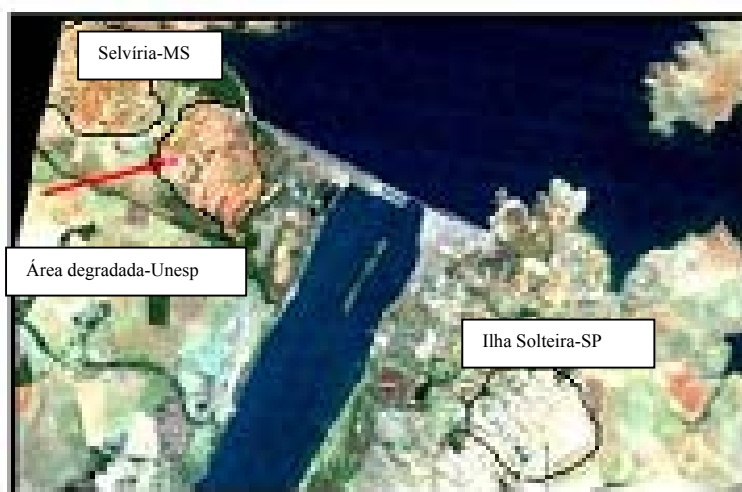
Figura 1- Imagem de satélite mostrando a localização da área experimental.

O trabalho foi conduzido na Fazenda de Ensino Pesquisa e Extensão (FEPE), pertencente à Faculdade de Engenharia, Campus de Ilha Solteira, da Universidade Estadual Paulista (UNESP), no município de Selvíria, MS. A mesma está localizada na margem direita do Rio Paraná, apresentando as coordenadas geográficas de 51^{\circ} 22' de longitude e 20^{\circ} 22' de latitude sul, com altitude média de 327 metros (Figura 1).