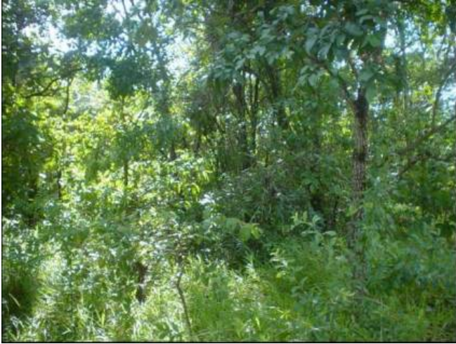
Figura 5 - Vista geral da área com vegetação natural de cerrado (T1).