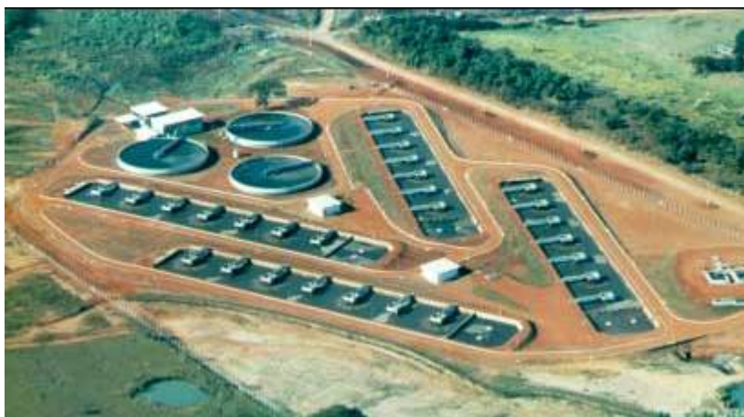
Figura 11- Vista da Estação de tratamento de Esgoto de Araçatuba.

O lodo de esgoto utilizado foi produzido pela Estação de Tratamento de Esgoto – ETE da empresa Saneamento de Araçatuba S/A – Sanear, no município de Araçatuba (Figura 11). Utilizou-se o lodo obtido de efluente predominantemente doméstico, com umidade de 84 %. O teor de metais pesados é baixo e para alguns elementos é nulo (Tabela 7).