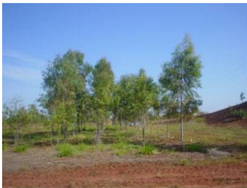
Figura 8 - Vista geral da área experimental em maio de 2006.