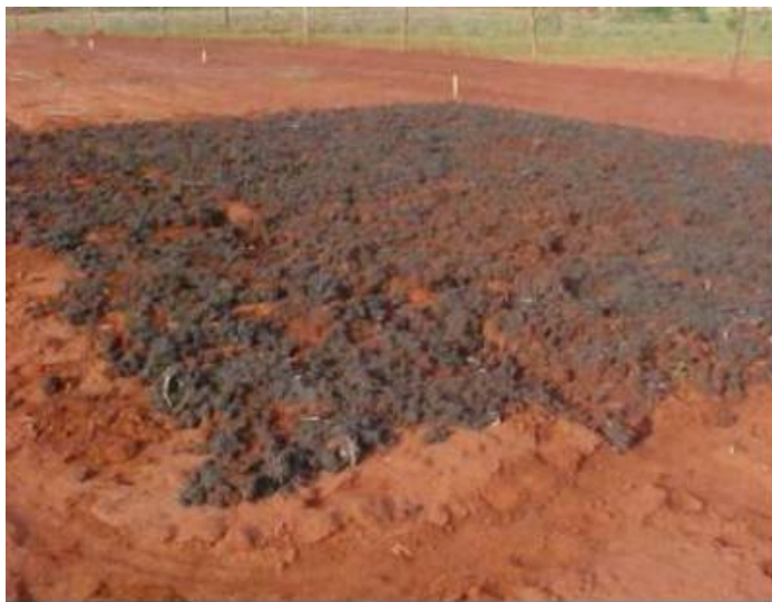
Figura 9 - Vista geral do lodo espalhado na superfície do solo.

incorporação do lodo no solo, mesmo com o uso da enxada rotativa. A área experimental foi cercada, para evitar a entrada de pessoas e animais.