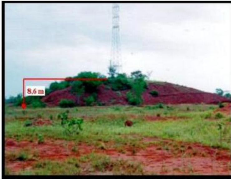
Figura 3- Vista geral do solo decapitado na área de empréstimo.

Pela grande circulação de máquinas, o solo remanescente da área experimental apresentava-se compactado e totalmente desprovido de vegetação (Figura 4), em decorrência da retirada da camada mais fértil.