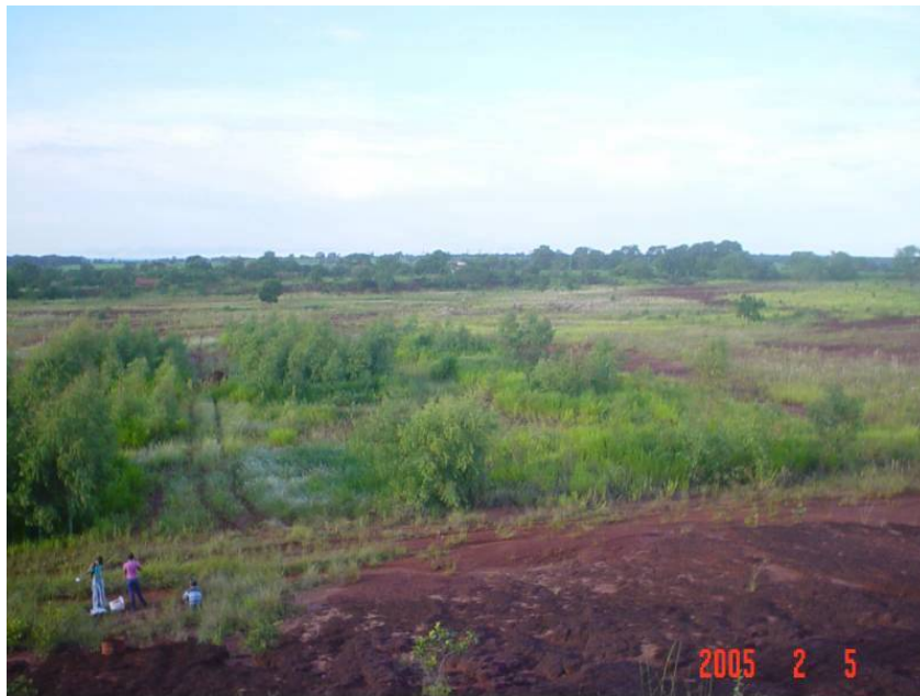
Figura 7 - Vista geral da área experimental em maio de 2005.