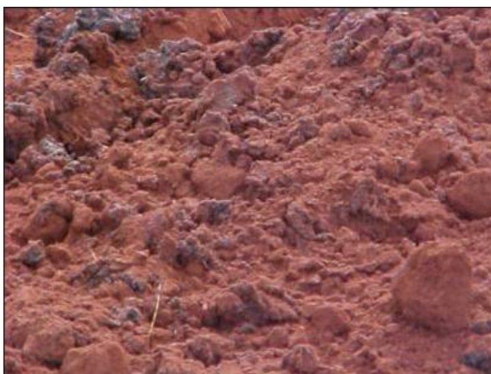
Figura 10 – Vista geral da superfície do solo após a incorporação do lodo com enxada rotativa.

O plantio da cultura de eucalipto e a semeadura da braquiária foram efetuados em março de 2003. O eucalipto foi plantado em sulcos de 0,40 m, tendo sido os mesmos