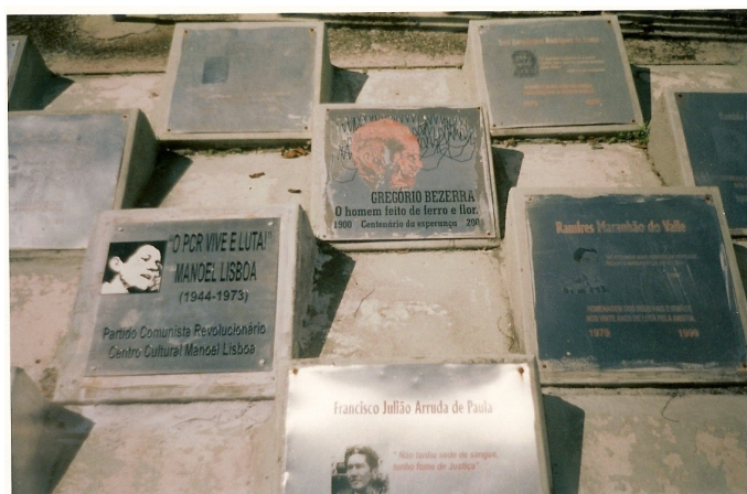
Monumento aos desaparecidos políticos e vítimas da ditadura Julho de 2003

Antes dos discursos iniciarem, diversos grupos tiraram fotos em frente ao memorial, para registrar sua estada naquele lugar. Militantes de antigas organizações se preparavam para registrar em foto suas estadas e os anistiados conversavam entre si. Alguns trouxeram seus filhos (muitos deles eram crianças e, com certeza, não estavam entendendo o que estava ocorrendo).