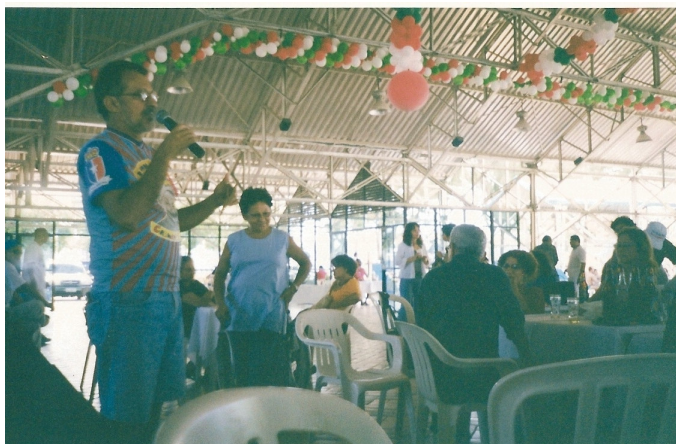
Confraternização de anistiados em dezembro de 2004 no Clube da Petrobras Fortaleza/CE

o tempo da prisão é retratado de uma maneira mais amena do que nas demais situações. Ao contrário, a alegria e efusividade são a marca desses encontros.