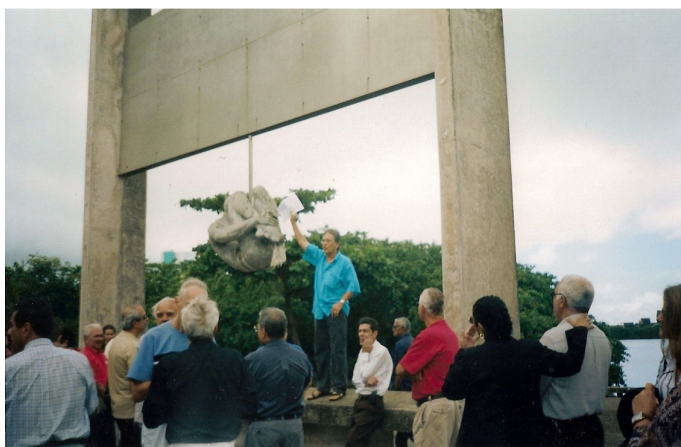
Evento no Monumento contra a tortura Encontro de Anistiados do Norte e Nordeste no Recife/PE Julho de 2003

A homenagem foi marcada pela simbologia, desde o local escolhido para a realização do evento, uma praça no centro da cidade de Recife, onde foi construído um monumento às vítimas da tortura (uma escultura de um homem no pau-de-arara) e placas de pessoas vítimas da ditadura (desaparecidos, mortos nas prisões e assassinados pela repressão). Foram distribuídos santinhos e jornais em que se observava a importância dos homenageados na luta contra a ditadura.