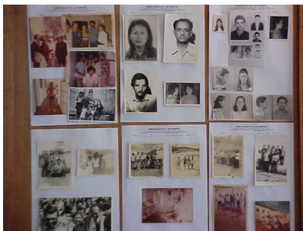
Exposição de fotos Encontro de Anistiados do Norte e Nordeste no Recife/PE Julho de 2003

No segundo dia, as temáticas “indenização, memória e preservação de documentos” dominaram as discussões. Nesse dia, também pode ser percebido o clima de reencontro que marcou todo o evento. A ocasião era bastante especial para muitos daqueles, até porque foi um momento de rever pessoas que não se viam há décadas. Para alguns o reencontro se deu nesse dia, já que nem todos foram ao lançamento do livro no dia anterior. No saguão do centro de convenções do hotel onde se realizou o evento, as pessoas se inscreviam e, enquanto isso, as várias associações de anistiados presentes montavam painéis com fotos das prisões, momentos vividos juntos, recortes de jornais da época e cartas escritas na prisão. Também foram entregues jornais e panfletos explicativos das associações, além de deferências e homenagens às pessoas que os ajudaram na época da ditadura militar.