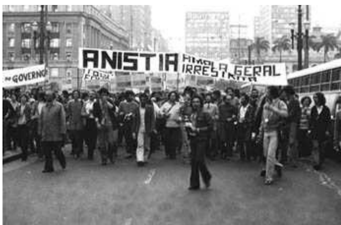
Manifestação pela Anistia Ampla Geral e Irrestrita, realizada no centro de São Paulo. (21/08/79)