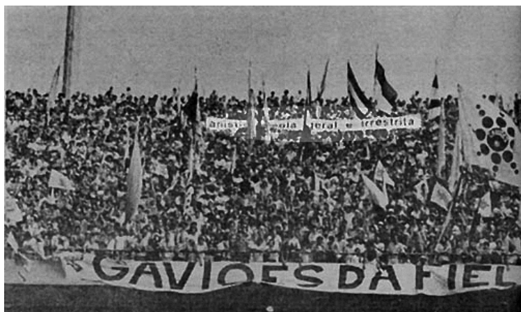
Faixa da campanha pela Anistia Ampla Geral e Irrestrita levantada por torcedores durante o jogo Corinthians

utilizados para fazer propaganda da anistia e conseguir apoio da sociedade civil brasileira.