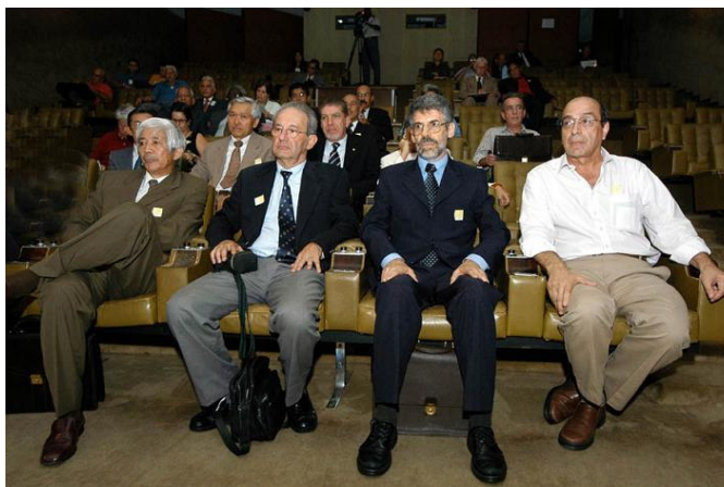
Ex-alunos do ITA na Comissão de Anistia