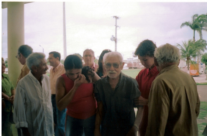
Solenidade de Pagamento de Indenizações em Crateús/CE Março de 2005

Dessa vez, foram trazidas também reportagens referentes à repressão na cidade de Crateús, sobre a luta de setores da igreja em prol dos presos, sobre os funcionários da RFSA. Numa dessas reportagens, havia uma foto de todos os 16 presos, feitos à época e reportadas pelo jornal O Povo no ano de 2004. Essa reportagem foi a mais concorrida e comentada pelos que ali passavam. Todos os ex-presos que pararam defronte a ela se apontavam nas fotos, mostravam aos seus familiares; falavam sobre os companheiros falecidos e discorriam sobre a época. Os filhos apontavam com orgulho o retrato do pai falecido. Pela exposição, também passaram amigos e vizinhos, que decidiram ir assistir ao evento como forma de homenagear os velhos conhecidos.