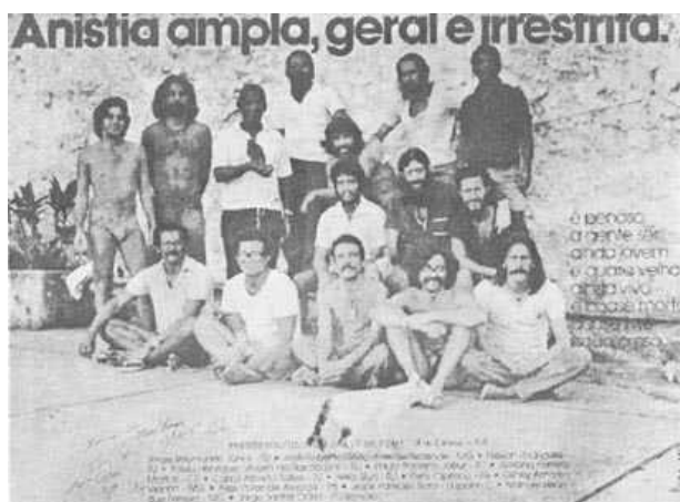
Greve de Fome (22/07 a 22/8/79). Cartaz da campanha pela Anistia Ampla Geral e Irrestrita, produzido pelo CBA/BH, com presos políticos do RJ- presídio Frei Caneca. 1979.

Durante todo o período que vai desde as primeiras propostas até a promulgação da lei, ambos os lados se articularam para viabilizar o seu projeto de anistia. Quando o projeto foi enviado pelo Presidente da República ao Congresso Nacional, os parlamentares da oposição decidiram apoiá-lo, na tentativa de apresentar o maior número de emendas possíveis. A disputa pela inclusão dessas emendas se dava não somente no Congresso, mas refletiam as posições dos grupos articulados. Mesmo assim, no mês em que o projeto esteve em tramitação no Congresso, não se conseguiu concordância sobre os artigos 61 e muitas lutas internas ocorreram para que ao final fosse votada.