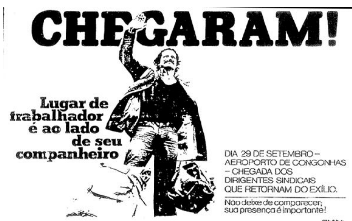
Cartaz de divulgação sobre o retorno ao Brasil de exilados políticos, SP - 29/09/1979

As entidades de anistia procuravam recepcionar os exilados que voltavam, tentavam garantir a segurança no desembarque, prestar assistência jurídica a aqueles que porventura necessitassem, além de tentar reintegrar os presos que saíam das prisões.