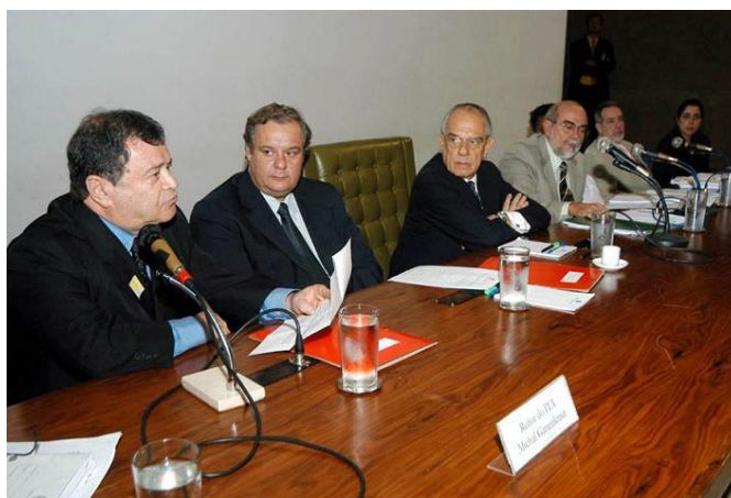
Sessão da Comissão de Anistia

Esses atos foram considerados pelo Grupo dos Sábados como “absolutamente singular e de elevada estatura moral, refletindo os anseios da sociedade brasileira, desejosa de reconciliar-se com seus anos de autoritarismo 299 ”.