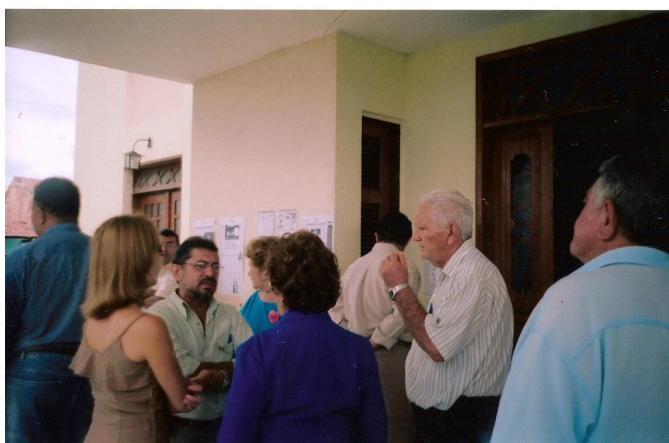
Solenidade de Pagamento de Indenizações em Crateús/CE Março de 2005

Dessa vez, foram trazidas também reportagens referentes à repressão na cidade de Crateús, sobre a luta de setores da igreja em prol dos presos, sobre os funcionários da RFSA. Numa dessas reportagens, havia uma foto de todos os 16 presos, feitos à época e reportadas pelo jornal O Povo no ano de 2004. Essa reportagem foi a mais concorrida e comentada pelos que ali passavam. Todos os ex-presos que pararam defronte a ela se apontavam nas fotos, mostravam aos seus familiares; falavam sobre os companheiros falecidos e discorriam sobre a época. Os filhos apontavam com orgulho o retrato do pai falecido. Pela exposição, também passaram amigos e vizinhos, que decidiram ir assistir ao evento como forma de homenagear os velhos conhecidos.