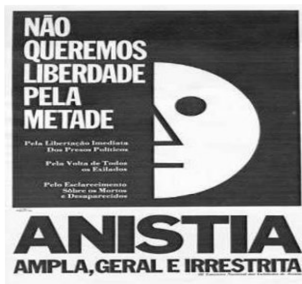
Cartaz de Campanha para o III Encontro Nacional das Entidades de Anistia. 1979

Constituição editada em 1967 que conferia perpetuidade às cassações dos direitos políticos. Para a oposição e os partidários da anistia, a Constituição deveria ser revogada por completo, não se podendo admitir essa negociação em substituição à anistia; Revisão ou revogação das punições, a serem requeridos pelos punidos aos tribunais militares. A proposta foi combatida pelo fato de não ter os efeitos de uma anistia e por abranger uma pequena parcela dos possíveis beneficiários; Revisão da Lei de Segurança Nacional no sentido de redução de algumas penas. A proposta dos opositores se baseava justamente na revogação da referida lei; Anistia recíproca – combatida inclusive por setores das forças armadas para quem aceitá-la seria admitir que a “Revolução” prestasse conta de seus atos. No caso dos opositores, aceitá-la significava tornar impune todos os crimes cometidos em nome da “segurança nacional”.