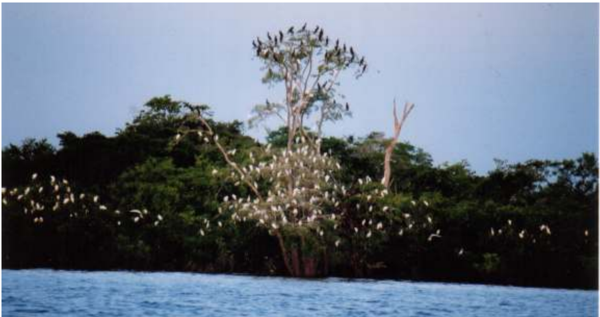
Figura 12 – Revoada de Garças Autor: SAN SOLO, Davis. (2003)

A atividade turística no município é voltada para o ecoturismo e tem sua base de sustentação na atuação de dois meios de hospedagem. O desenvolvimento do ecoturismo relacionado à existência de hotéis de selva, aliás, é lugar comum no cenário de ecoturismo nacional, conforme visto em capítulo anterior.