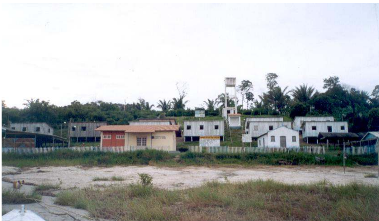
Figura 6 – Comunidade ribeirinha 5

Em pesquisa de campo, observou-se que algumas comunidades, possuem, em sua sede, posto de saúde e unidade de ensino pré-escolar e básico (Figura 6). De acordo com Ribeiro (1991), a maioria dessas escolas foi construída com recursos das comunidades, algumas vezes com ajuda da prefeitura.