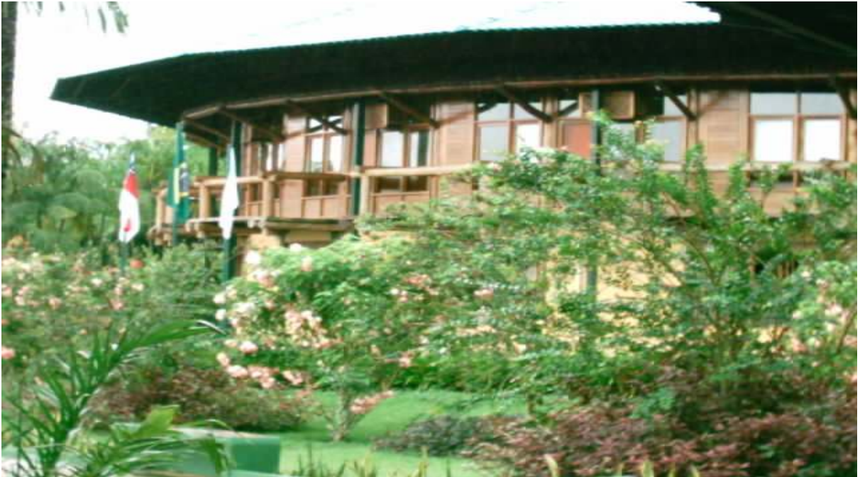
Figura 14 – Pousada dos Guanavenas Autor: SOUSA, Stella. (2004)