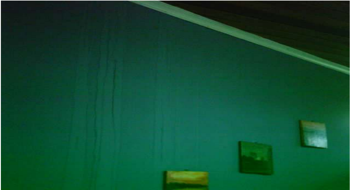
Figura 17 – Goteiras na parede do apartamento Autor: SOUSA, Stella. (2004)