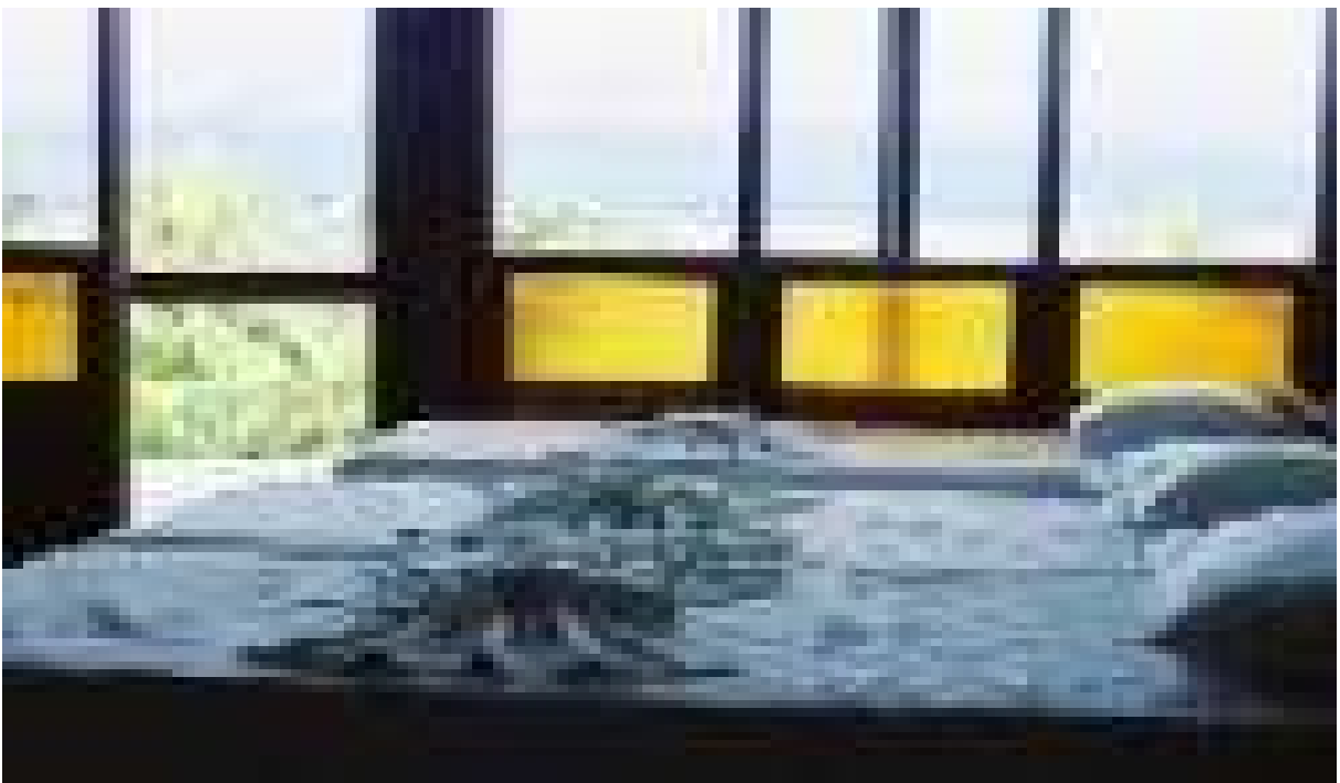
Figura 15 – Apartamento Pousada dos Guanavenas

As vendas e todo o controle administrativo são efetuados pelo escritório da empresa, em Manaus. Nem mesmo ficha de hóspede é preenchida na chegada. De