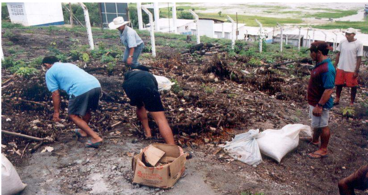
Figura 19 – Compostagem para produção de adubo. Autor: SANSOLO, Davis. (2003)

proposto pela ASPAC: Conservação dos Recursos Naturais de Várzea por meio do Turismo Ecológico e da Gestão Participativa na Região de Silves.