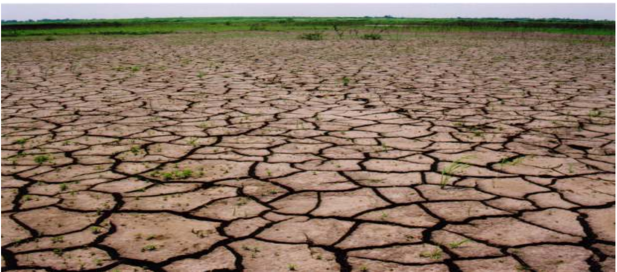
Figura 5 – Várzea seca Autor: SANSOLO, Davis. (2003)