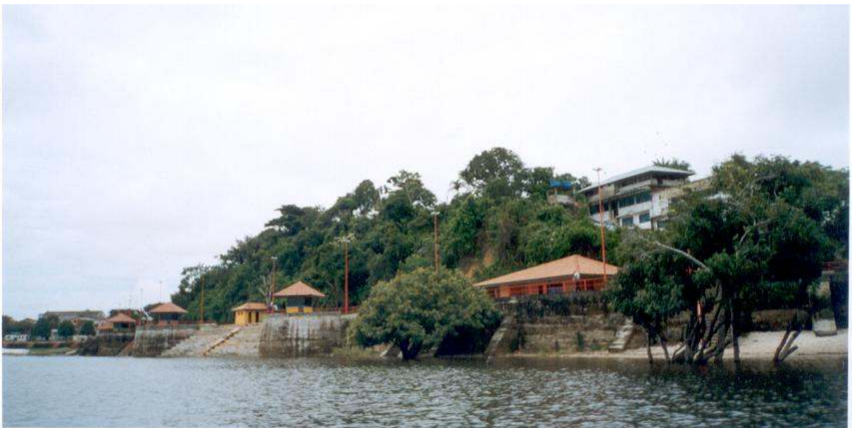
Figura 10 – Vista frontal de Silves, com muro de arrimo. Autor: SOUSA, Stella. (2004)

Após o muro de arrimo (parte alta), há um calçadão e, em seguida, começam as ruas da cidade. À noite, o calçadão torna-se ponto de encontro, pois além de ser um local agradável para passeio, fica próximo à igreja e a alguns pontos de comércio. Em Silves, como é comum nas pequenas cidades, os moradores se conhecem e dificilmente não se localiza alguém dizendo apenas seu nome e alguma referência como filiação ou ocupação. Nas comunidades, esse tipo relação próxima entre os moradores é ainda mais evidente. O senso de coletividade na convivência entre as pessoas dessas comunidades é algo que chama a atenção de quem vive nos centros urbanos, nos quais, por questões de segurança e devido ao individualismo, são cada vez mais raras manifestações de alteridade.