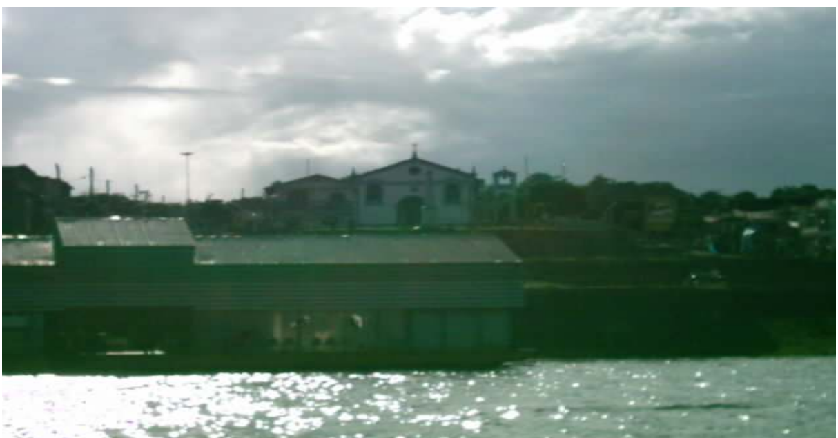
Figura 3 – Porto de Silves. Autor: SOUSA, Stella. (2004)