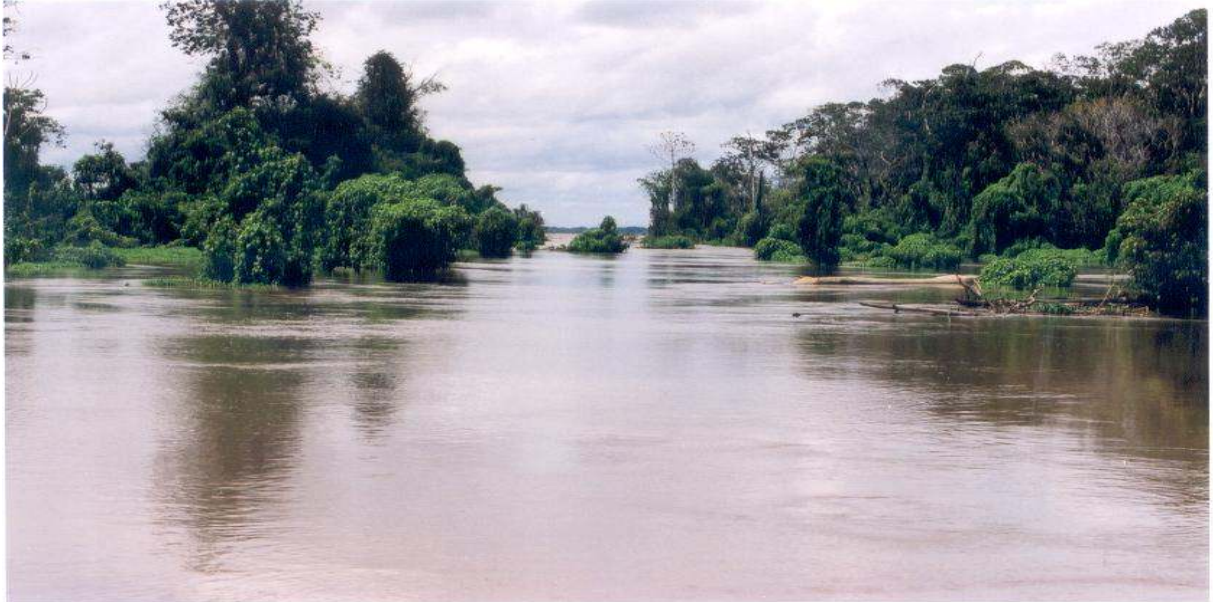
Figura 4 – Várzea alagada Autor: SANSOLO, Davis. (2003)

resultado da interação da floresta com a atmosfera e, portanto, o equilíbrio hídrico e da temperatura dependem dessa interação (RIBEIRO, 1992).