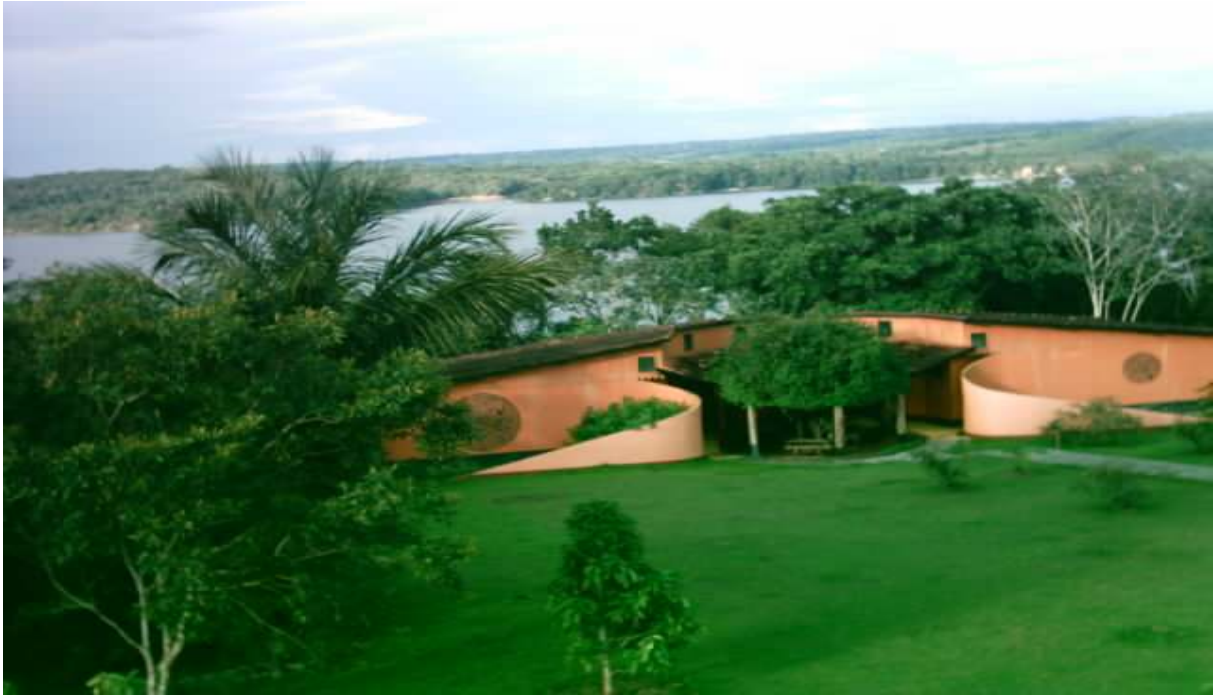
Figura 16 – Pousada Aldeia dos Lagos Autor: SOUSA, Stella. (2004)

necessita de alguns acertos, mas a aparência geral é boa (Figura 16). Os 12 apartamentos possuem banheiro privativo, chuveiro elétrico, armário, ventilador, frigobar, ar-condicionado e varanda. São quartos simples e podem ter uma cama de casal ou duas de solteiro ou até três camas, utilizando-se camas extras.