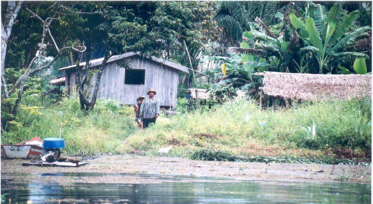
Figura 7 – Casa na zona rural, população ribeirinha. Autor: SAN SOLO, Davis. (2003)