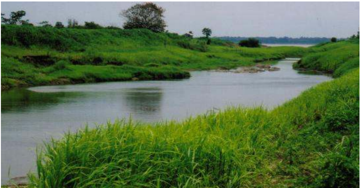
Figura 2 – Furo do Liberato. Autor: SANSOLO, Davis. (2003)

de barco de duas a três vezes, com intervalo de três a cinco horas entre a chegada de um barco e a saída do outro, dependendo da época do ano. As condições do transporte fluvial são deficientes, por vezes chegando a quebrar durante o trajeto; bem como os portos para embarque e desembarque de passageiros e cargas apresentam estrutura precária (Figura 3). Assim, leva-se praticamente metade de um dia no deslocamento. O mesmo ocorre no trajeto Silves / Manaus, com a opção de seguir de ônibus intermunicipal a partir de Itacoatiara.