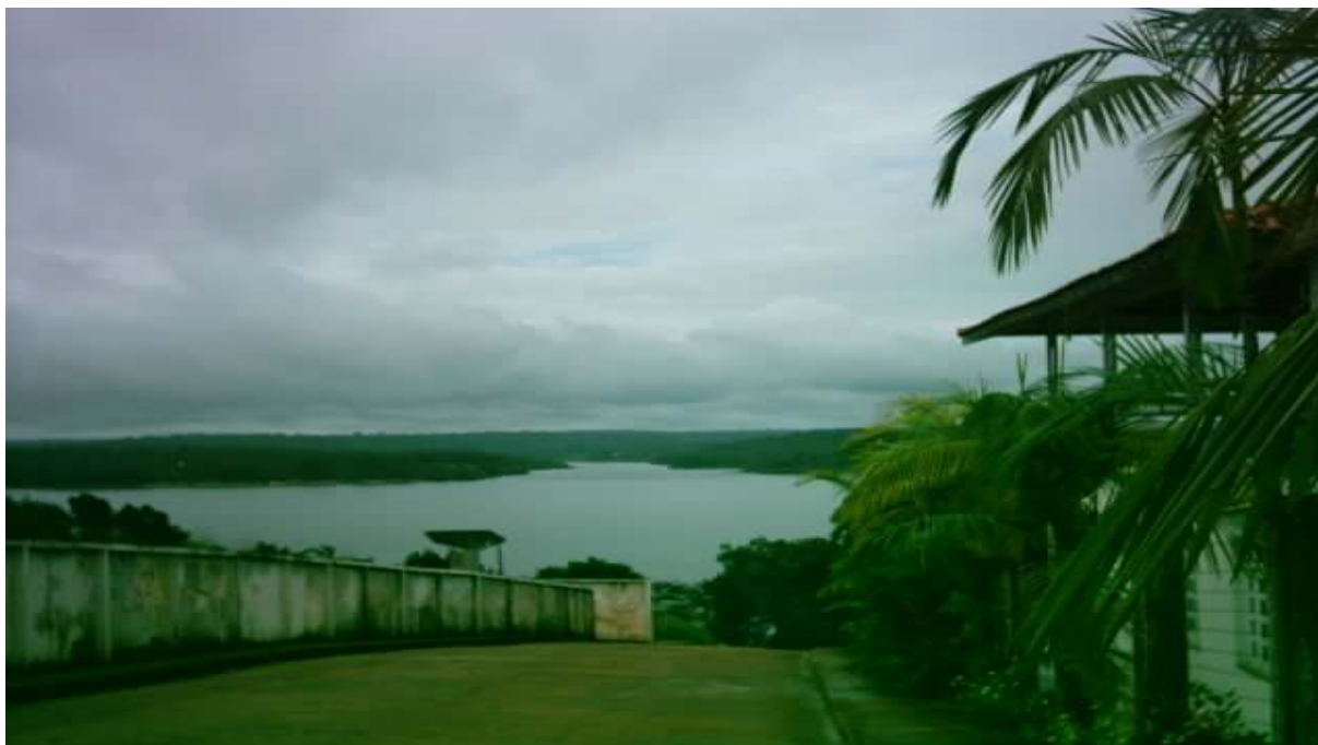
Figura 11 – Rua em Silves Autor: SOUSA, Stella. (2004)

A locomoção na cidade é feita, principalmente, a pé. Há poucos automóveis trafegando nas ruas, que são largas e cheias de ladeiras (Figura 11). Percebe-se também a presença de motos que atuam no serviço de táxi. Já nas comunidades rurais ribeirinhas, o barco é o principal meio de locomoção. A relação com o rio é intrínseca. “O amazonense passa horas, dias, dentro dos motores 8 , em canoas, em pequenos cascos em cima das águas. Desde pequeninas, as crianças aprendem a nadar [...]. Vão à escola de canoa.” (RIBEIRO, 1991, p. 32)