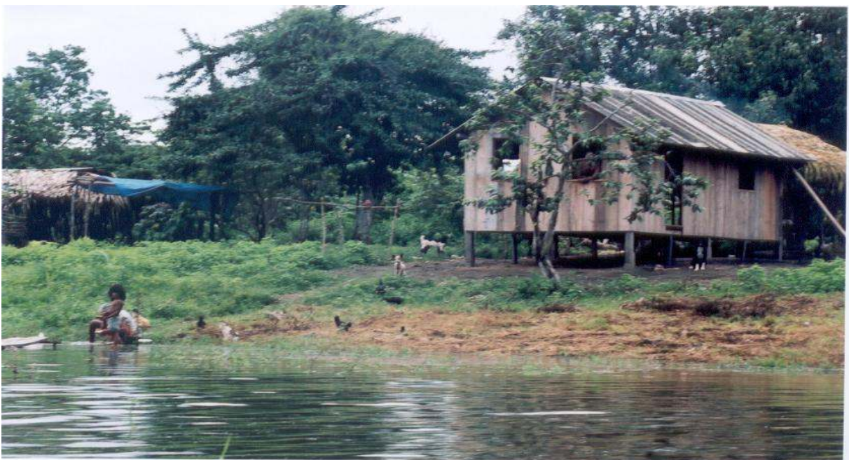
Figura 8 – Casa população ribeirinha. Autor: SAN SOLO, Davis. (2003)

Segundo Ribeiro (1992), o padrão de ocupação ribeirinha predominante na Amazônia tem sido de fundamental importância para a manutenção do ecossistema de várzea. A pesca para autoconsumo, combinada com agricultura de subsistência são as principais atividades desenvolvidas pelos ribeirinhos. Assim, a baixa