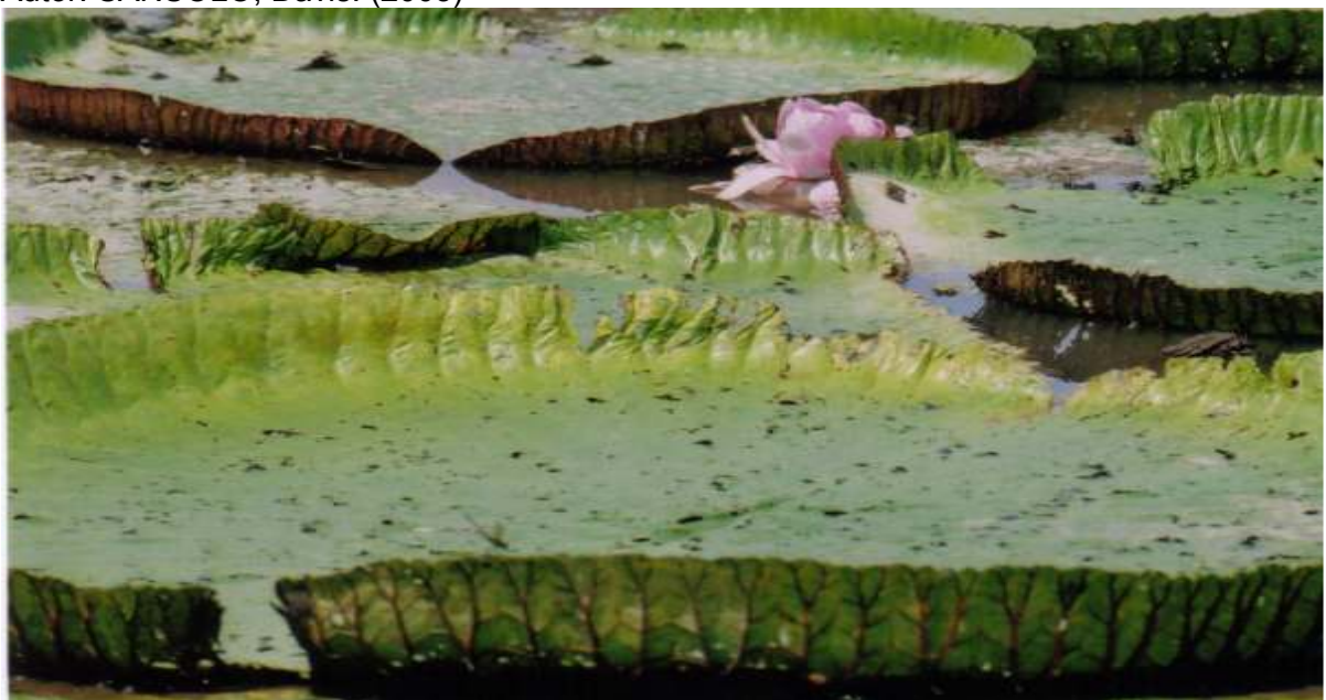
Figura 13 – Vitória Régia. Autor: SAN SOLO, Davis. (2003)