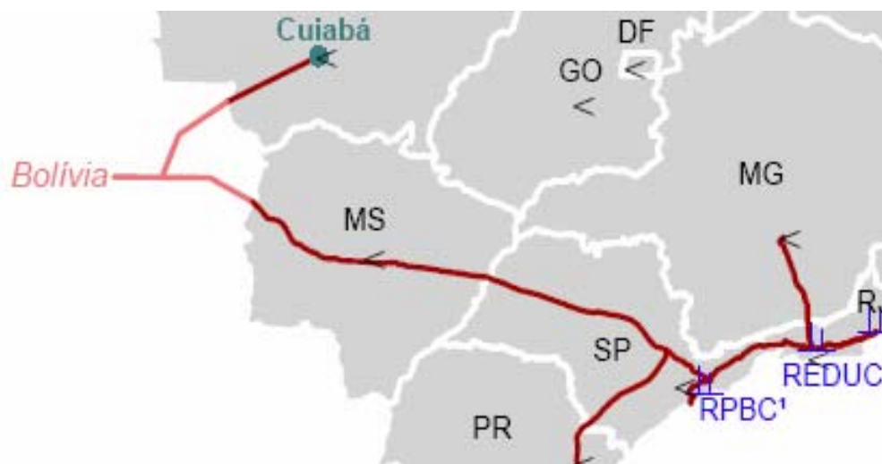
Figura 4. Mapa do gasoduto lateral a Cuiabá

A Licença de Operação foi obtida em 5 de julho de 2001 29 . A construção foi iniciada no segundo semestre de 1999 e concluída em junho de 2001. O gasoduto foi inaugurado em 7 de março de 2002, transportando em média 2 MMm 3 /dia. A seguir pode ser observado o percurso do gasoduto na figura 4.