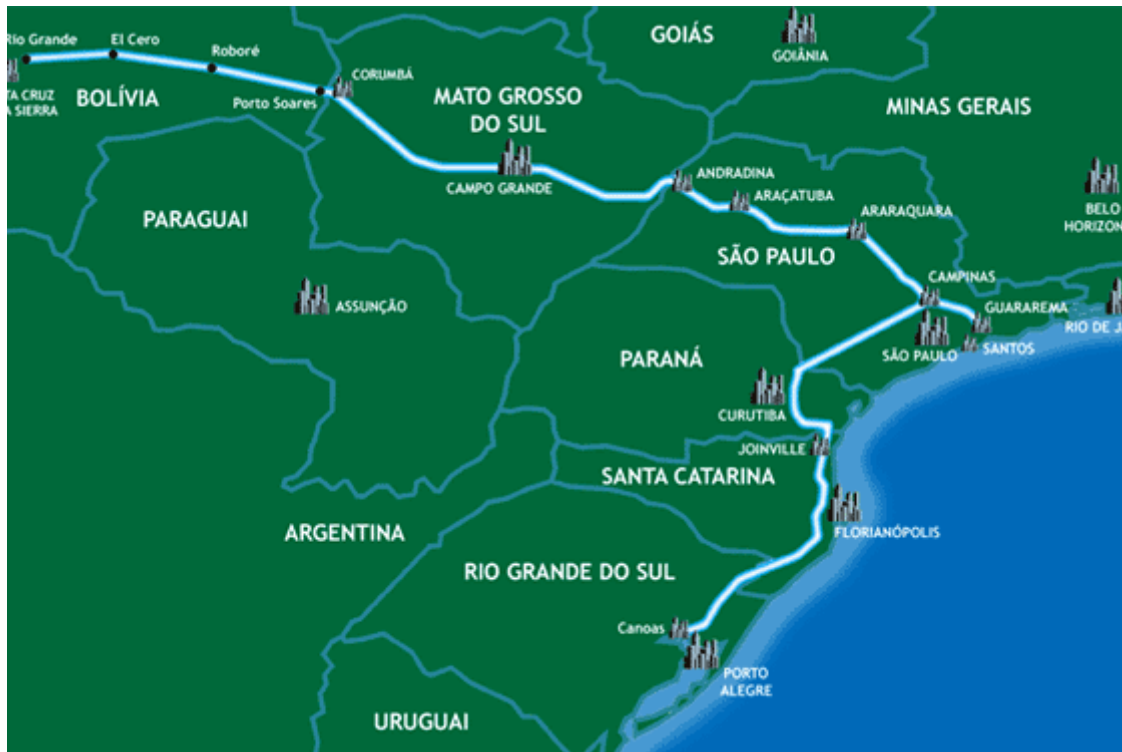
Figura 3. Mapa do gasoduto Bolívia – Brasil. GASBOL