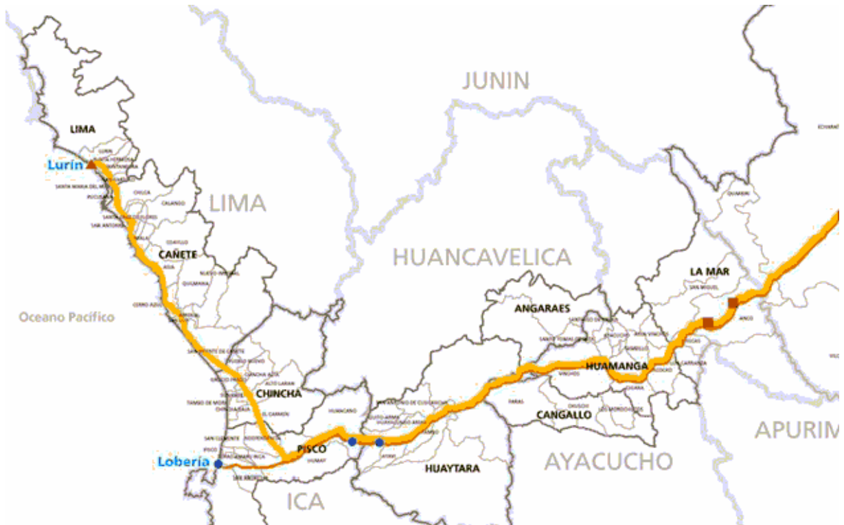
Figura 6. Mapa do gasoduto e do poliduto de Camisea

Na figura 6 observa-se o trajeto do poliduto e gasoduto de transporte do projeto de Camisea.