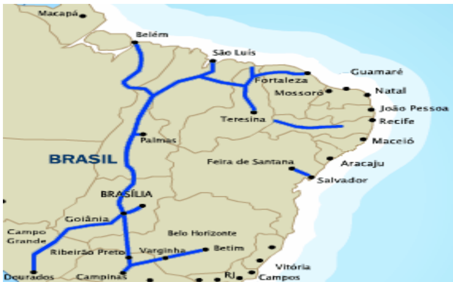
Figura 1. Mapa de gasodutos previstos no Brasil

A continuação, pode-se observar na figura 1. alguns dos projetos de gasodutos previstos para os próximos anos no Brasil