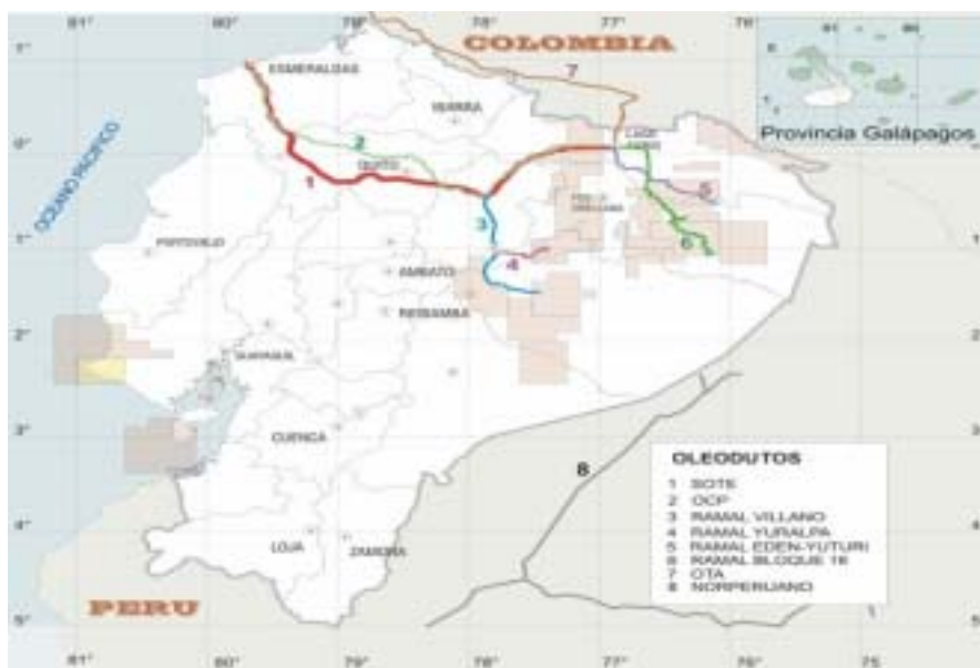
Figura 5. Mapa de oleodutos no Equador

Em fevereiro de 2001, o Estado Equatoriano autorizou a construção do oleoduto. Em junho do mesmo ano foi aprovado o “Estudo de Impacto Ambiental” pelo “Ministério de Médio Ambiente” e concedida a “Licencia Ambiental” do projeto. Três semanas mais tarde começou a construção. Em 11 de novembro de 2003, obteve a permissão de operação do Ministério de Minas e Energia e dois dias mais tarde a “Licencia Ambiental de Operação del Ministerio de Medio Ambiente”. No dia 14 de novembro de 2003 o oleoduto começou a operar. A figura 5, a continuação, mostra o mapa de oleodutos do Equador.