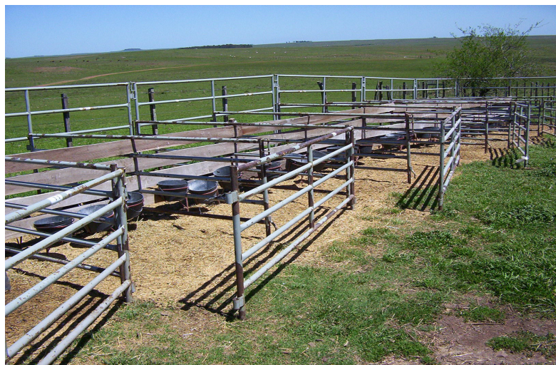
Figura 2. Baias individuais utilizadas no confinamento

Tanto nos tratamentos em pastejo como no confinamento foi utilizado um suplemento composto por 72% de grão de milho quebrado e 28 % de farelo de soja. O suplemento foi calculado para preencher as exigências nutricionais de animais em crescimento com um ganho médio diário de 180 gramas (NRC, 1985; NZSAP, 1980).