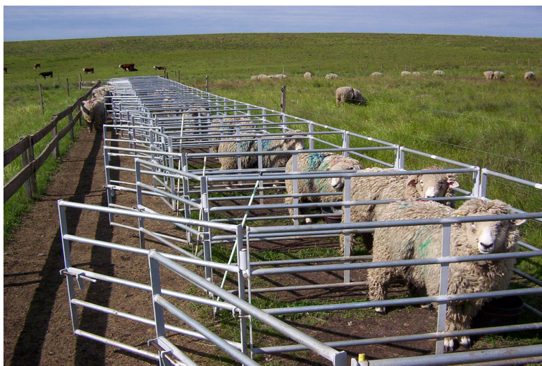
Figura 1. Baias individuais: suplementação de cordeiros em pastejo