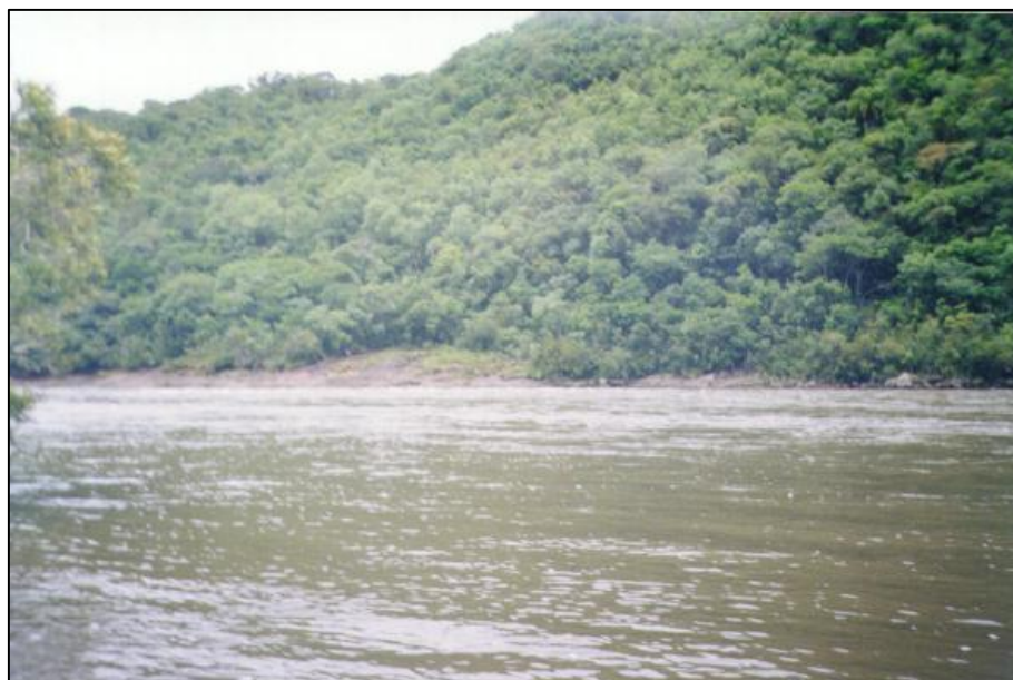
Foto 02: Aspecto da vegetação da margem esquerda do rio Pelotas. Capão Alto (SC), novembro de 2002.