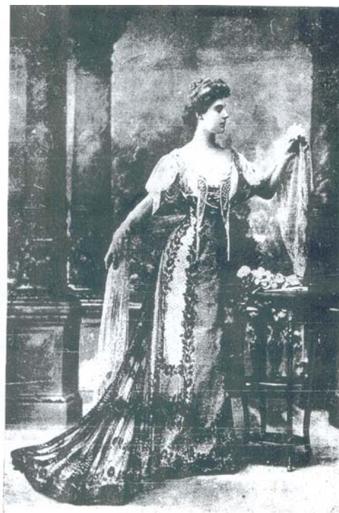
ROBE DU SOIR EN TULLE ARET Com encadramentos de gessamento de gaze e pailletes. Luz, confeccionado nos ateliêrs da MAISON-BLANCHE da RUA URUGUAYANA N. 78 A loja e o gabinete dependem do conhecido estabelecimento das Fazendas Pretas do Rio Uruguayan n. 24. As sobretas de Maison-Blanche mantêm em si a elegância com as mais sumptuosas confeccionadas em Paris, Londres e Vienna. E os seus preços são os mais reducidos desta capital.