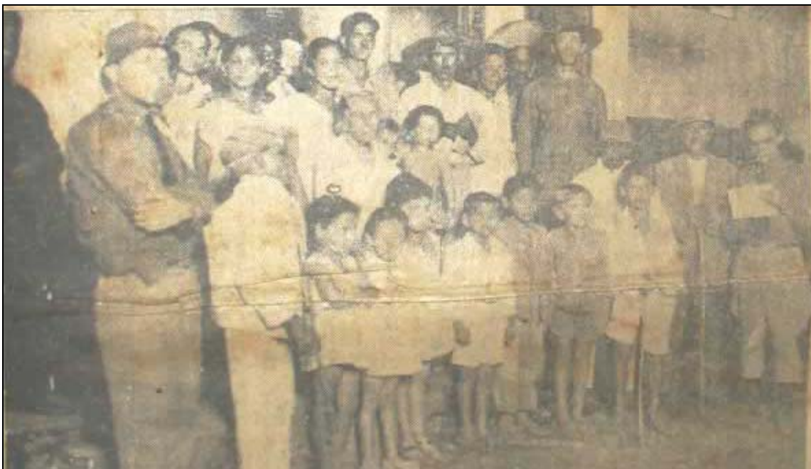
Figura: Visita de integralista a localidade de Muriqueira ( O Imparcial , edição n.1327, 11 mai. 1935, p. 1).

A Ação Integralista está tomando providencias urgentes no sentido de enviar socorros ás populações de Parafuso, Muriqueira que, segundo informações, atravessa, também, situação calamitosa. Serão enviando viveres e medicamentos para evitar o ameaçador surto epidêmico. É de elogiar-se mais essa atitude da Ação Integralista, que tão relevantes e inestimáveis serviços vem prestando em prol das vítimas desamparadas das águas torrenciais que, por dias seguidos, devastaram a capital e vasta zona do interior (...) “O IMPARCIAL” presenciou a ação dos bravos milicianos da turma e reconhecimento, que não pouparam esforços para cumprirem com eficiência, a missão que lhes foi designada pelos chefes.(...) ( O Imparcial , edição n.1327, 11 mai. 1935, p. 1)