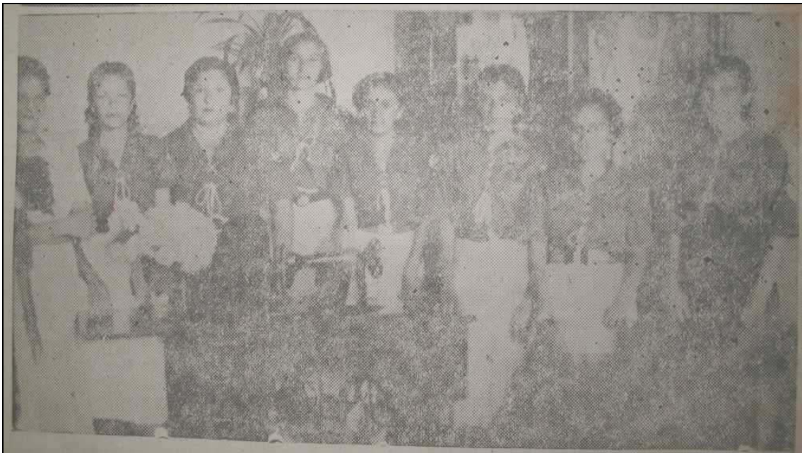
Figura 2: Instalação da Escola de Corte no núcleo distrital de Santo Antonio. O Imparcial , 22/11/37.

obra feminina no setor; 78% em atividades domésticas (remuneradas ou não) e escolas (discentes e magistério exercido no lar, o que torna impossível particularizar o percentual das mulheres dedicadas exclusivamente à primeira; 4% corresponde às mulheres em condições inativas e em atividade mal definidas ou não declaradas (...)) (ALMEIDA, 1986, p. 44-45).