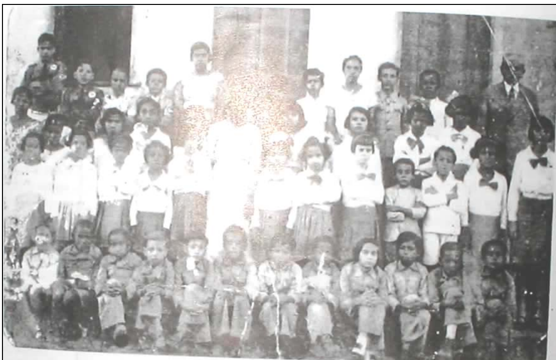
Figura 1: Escola integralista em Barra do Rocha, distrito de Rio Novo ( Revista Cidades em Foco: informação e cidadania , ano I, n.11, p. 24, out. 2002).

Nas escolas integralistas, cabia a professora influir no sentido de ser dado ao ensino um cunho puramente brasileiro ( A Província , I, nº 5, 28 fev. 1935, p. 2). A educação integralista primava pelo: civismo, ordem, disciplina, religiosidade cristã na formação intelectual, cívica, moral e física do indivíduo.