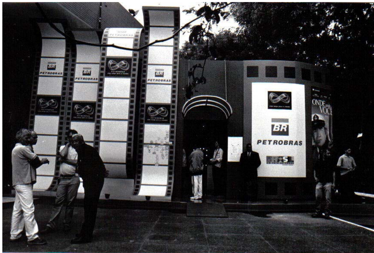
Foto 3 – Montado logo à entrada do Cine Brasília, no stand da Petrobrás, foram exibidos filmes e organizados bate-papos com convidados do Festival.