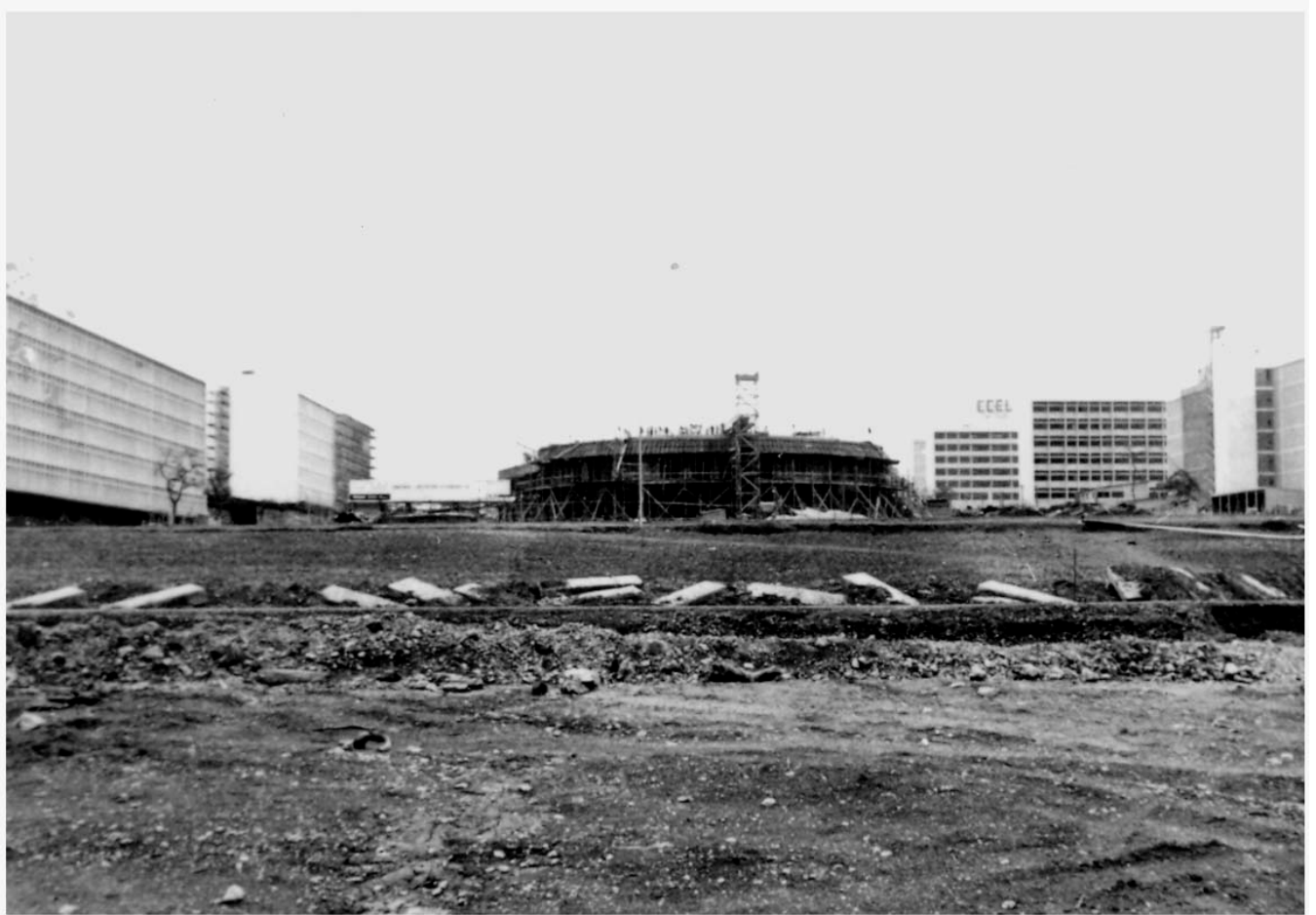
CONTEÚDO: CONSTRUÇÃO DO CINE-BRASÍLIA NA 107/108 SUL LOCAL: BRASÍLIA-DF DATA: [1957-1960]