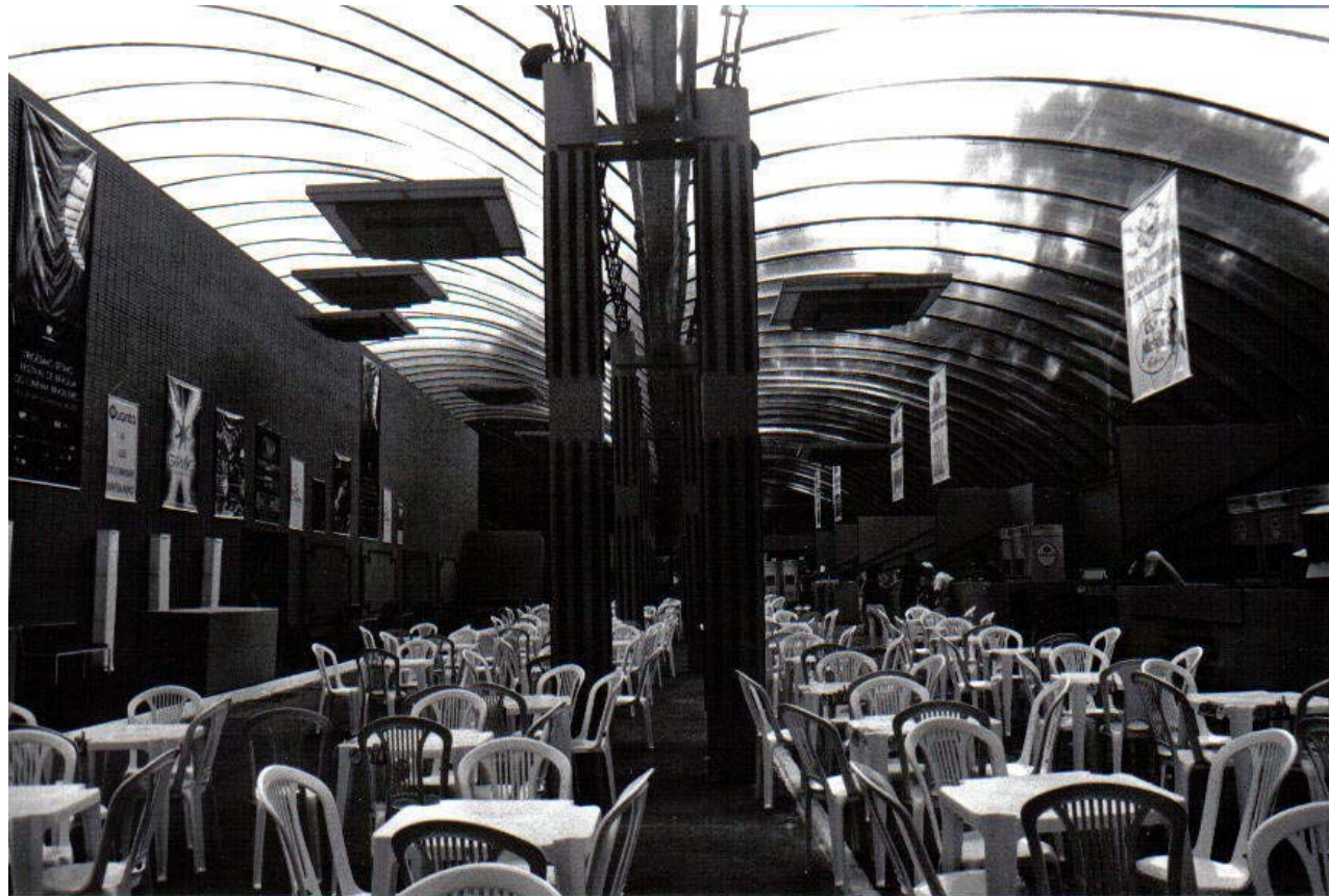
Foto 6 – Praça da Alimentação montada no espaço do Cine Brasília para o Festival.