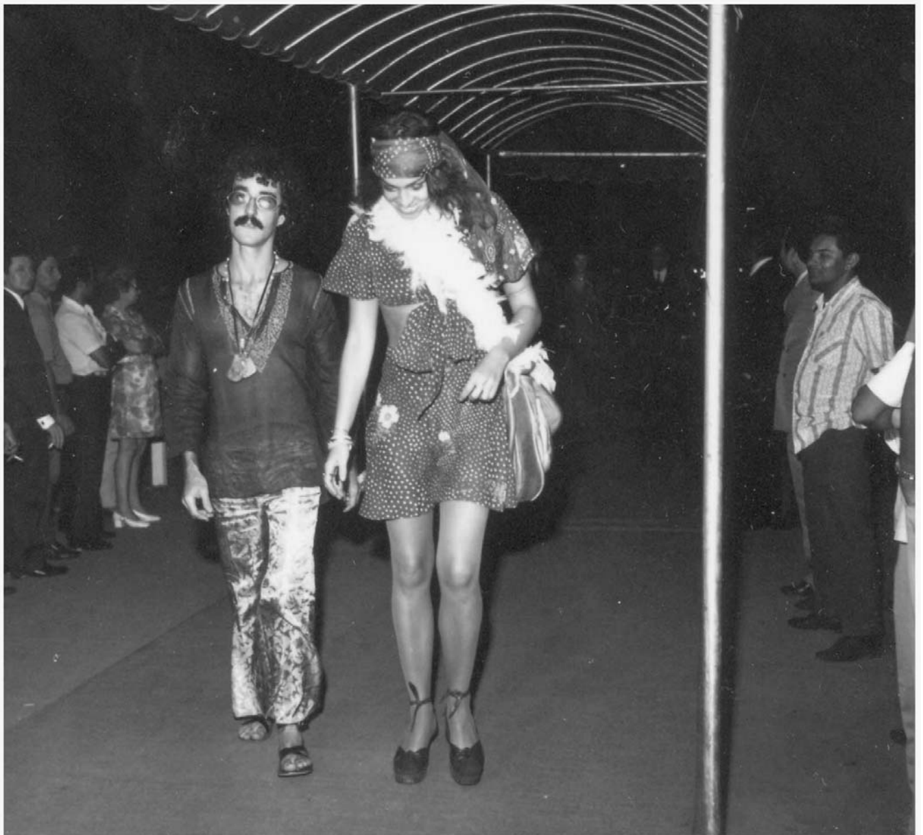
ARQUIVO PÚBLICO DO DF SCS.HF.11.2.C.3. Nº 47775 CONTEÚDO: INTEGRANTES DO FESTIVAL DO CINEMA BRASILEIRO LOCAL: BRASÍLIA-DF DATA: 03/12/1971 AUTOR: NÃO IDENTIFICADO