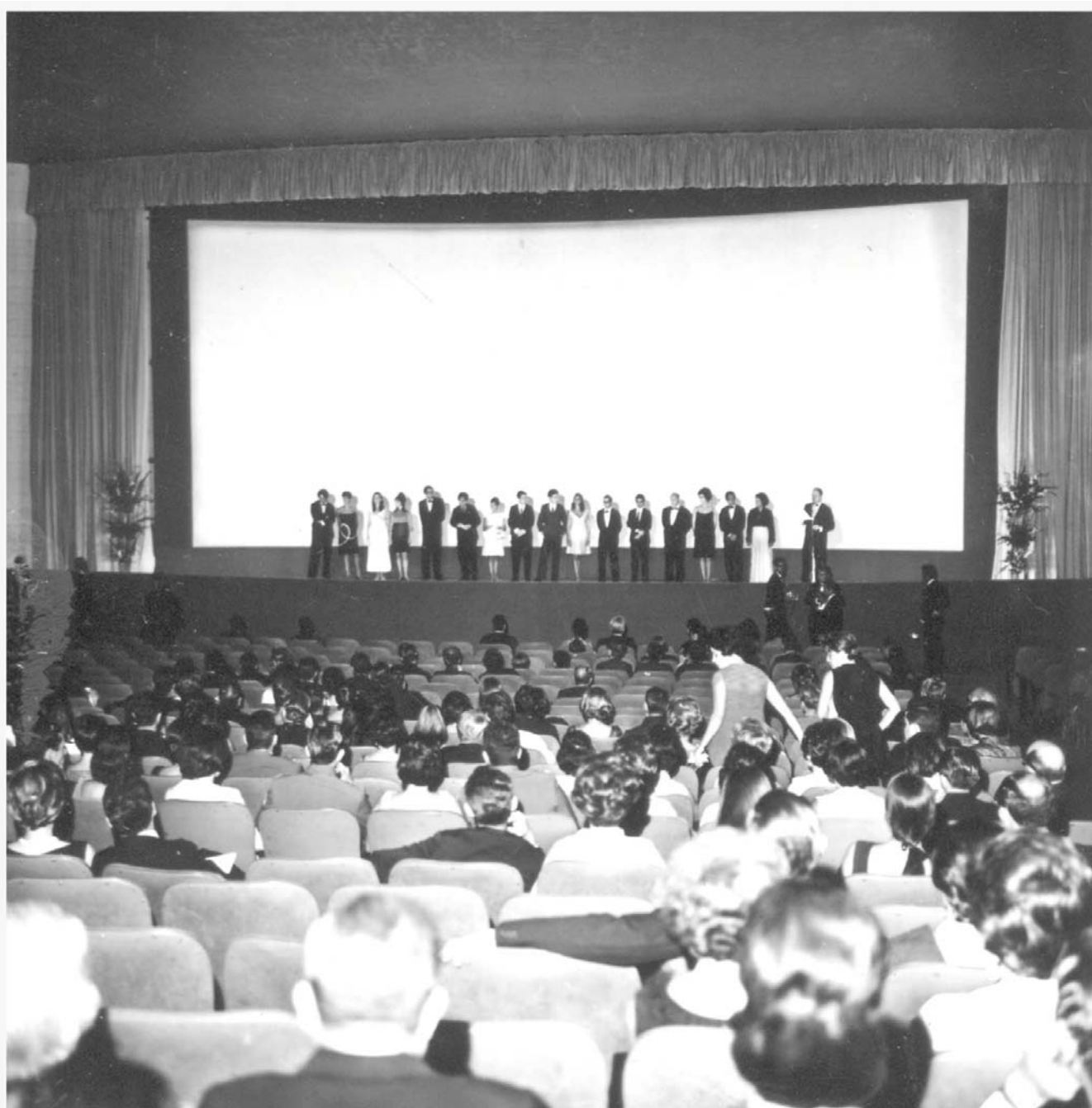
ARQUIVO PÚBLICO DO DF SCS.FF.11.2.C.3. Nº 2496 CONTEÚDO: PARTICIPANTES DO II FESTIVAL DO CINEMA BRASILEIRO LOCAL: BRASÍLIA-DF DATA: 11/12/1966 AUTOR: NÃO IDENTIFICADO