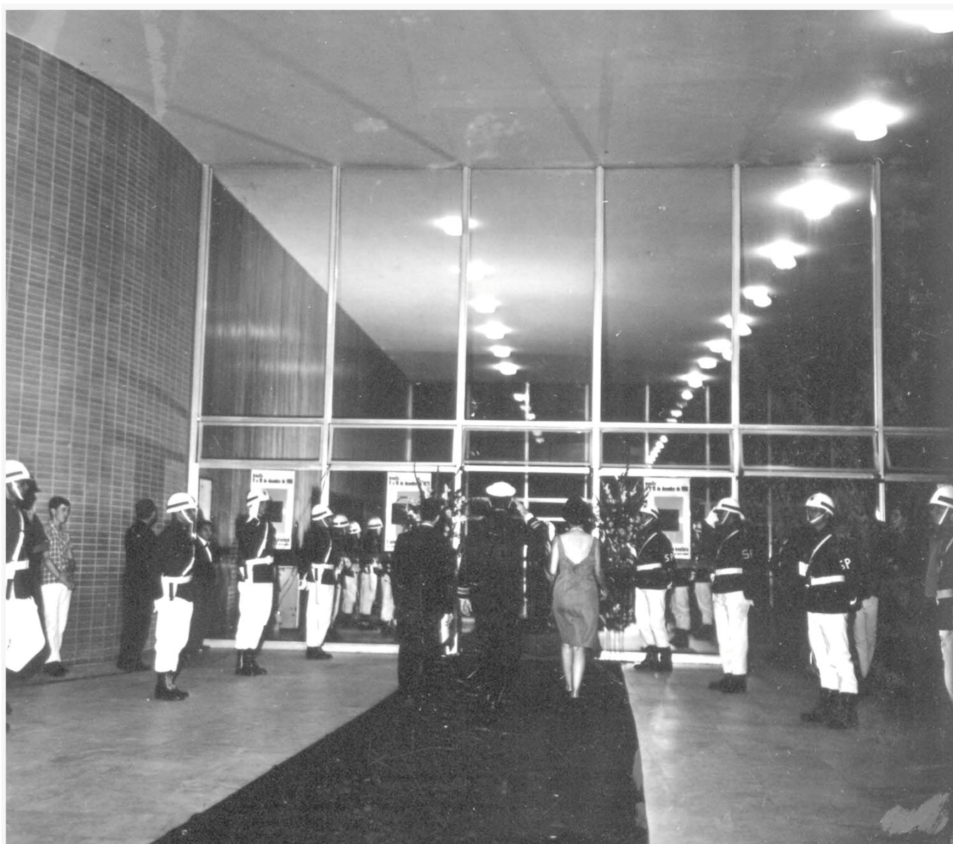
ARQUIVO PÚBLICO DO DF SCS.FF.11.2.C.3. Nº 2493 CONTEÚDO: PARTICIPANTES DO II FESTIVAL DO CINEMA BRASILEIRO LOCAL: BRASÍLIA-DF DATA: 11/12/1966 AUTOR: NÃO IDENTIFICADO