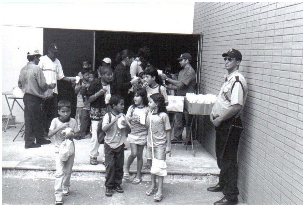
Foto 1 - Saída das crianças da sessão do Festivalzinho, no Cine Brasília.