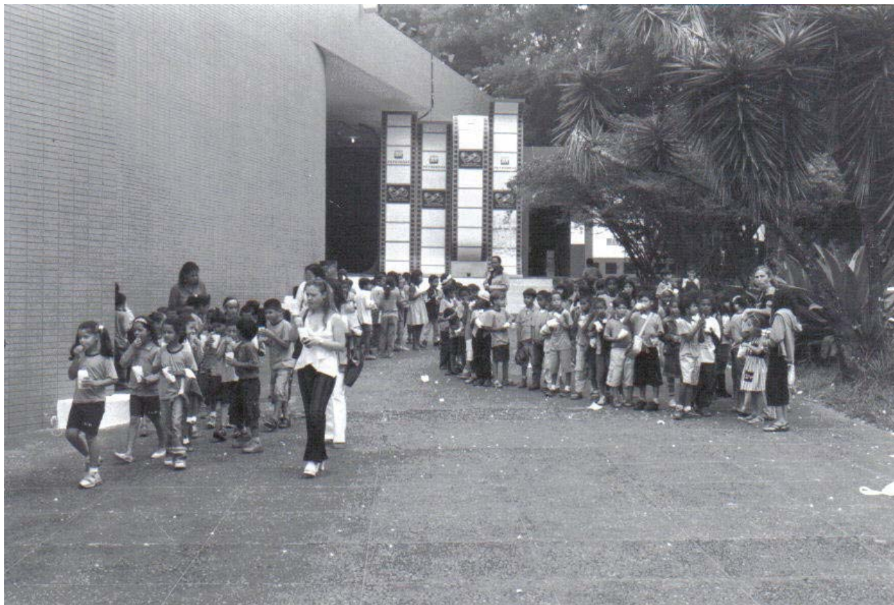
Foto 2 – À saída da sessão do Festivalzinho, crianças em fila para entrar nos ônibus.