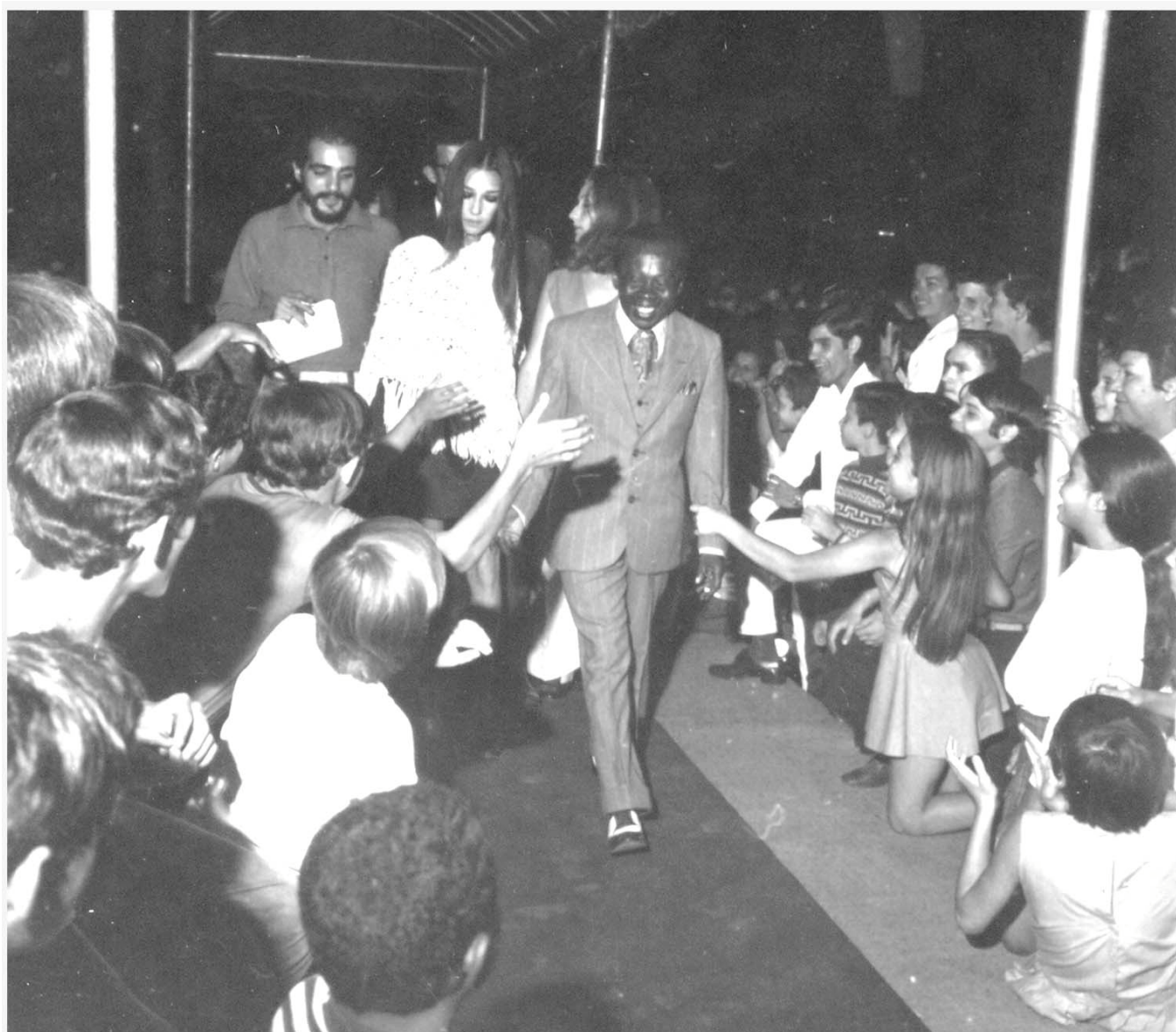
ARQUIVO PÚBLICO DO DF COD: SCS.HF.11.2.C.3 N° 29775 CONTEÚDO: 5º FESTIVAL DO CINEMA BRASILEIRO LOCAL: BRASÍLIA-DF DATA: 16/11/1969 AUTOR: JOAQUIM FIRMINO