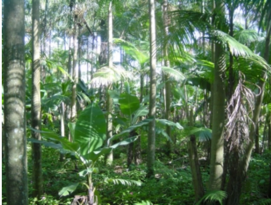
Figura 02: Consórcio de E. edulis e banana