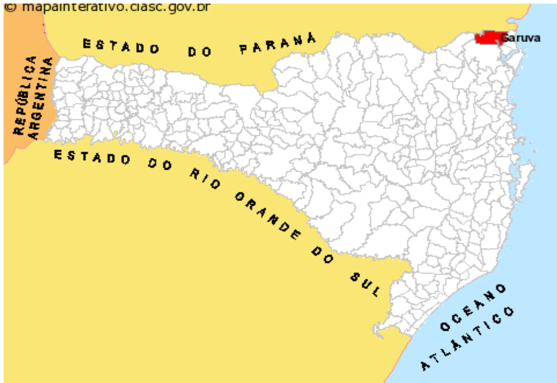
Figura 05 Localização de Garuva.

Garuva está situada em Planícies Litorâneas resultantes dos processos de acumulação marinha e fluviomarinha. Esta Unidade Geomorfológica ocupa nesta porção norte do Estado, uma extensa área e apresenta um litoral com baías e enseadas, a exemplo a Baía da Babitonga, geralmente guarnecidas por pontais que correspondem a relevos residuais pronunciados. Em relação a geologia o Complexo Tabuleiro ocupa grande parte do município de Garuva. É composto por granitóides foliados diversos, não diferenciados associados a remanescentes de xistos supracrustais e migmatitos de injeção (EPAGRI/CIRAM, 1999).