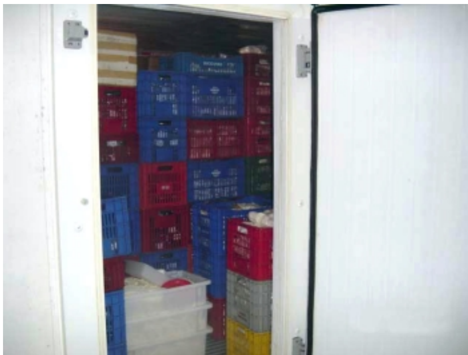
Figura 04 - Câmara fria. Foto: João Silva, Garuva, 2005

A maioria das agroindústrias de açaí utilizam-se deste método para atender os mercados no sul do país e no exterior.