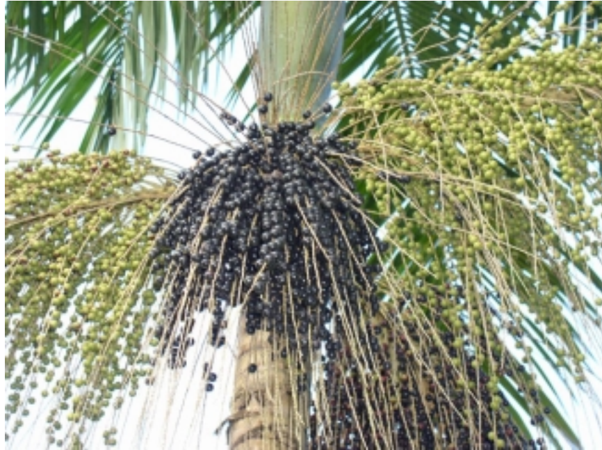
Figura 1: Frutificação do E.edulis .

com a maturação dos frutos de dezembro a fevereiro. Nas regiões com menores elevações, os dois eventos ocorrem em épocas inversas.