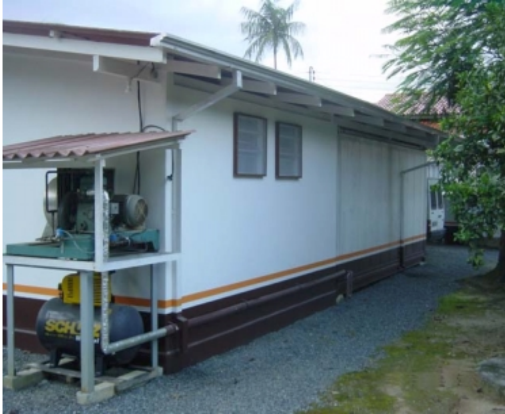
Figura 06: Agroindústria- Garuva - Foto: João Silva, 2005

A Figura 07 mostra as etapas de processamento do fruto. A primeira etapa do processamento, no início do dia é o recebimento da matéria-prima em cachos inteiros. Após a entrada na ARPP, é feito a debulha dos frutos, a seleção e o descarte dos frutos verdes e a imersão dos frutos maduros. Três funcionários, com rendimento médio de aproximadamente 27kg/hora homem de frutos selecionados, em uma jornada de oito horas diárias, resulta no preparo de 640kg de frutos para a despolpa, suficiente para a operação das duas despoldadoras. A técnica de despoldamento utilizada na agroindústria é a partir de despoldadoras elétricas, de pequena capacidade, sendo necessário a operação de um funcionário para cada despoldadora.