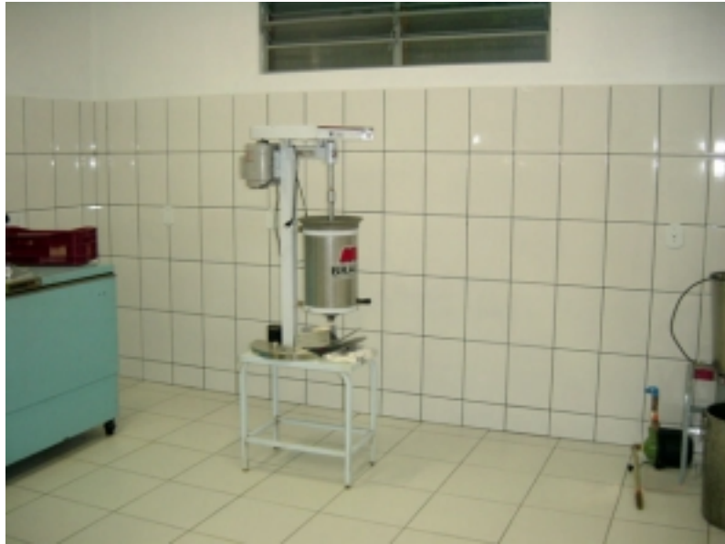
Figura 03 - Despolpadora. Foto: João Silva, Garuva, 2005

A padronização do açaí para comercialização foi realizada em 2000 pelo Ministério da Agricultura e do Abastecimento. O critério de classificação do açaí está baseado na porcentagem de sólidos totais. Dessa forma o açaí foi classificado em açaí grosso ou especial, o qual a composição de sólidos totais deve ser acima de 14%; açaí médio ou regular, apresentando sólidos totais entre 11 e 14%; e açaí fino ou popular, que possui entre 11 e 8% de sólidos totais (BRASIL, 2000). Para a produção do açaí grosso ou especial, médio e fino, a adição de água para 8kg de frutos a quantidade de uma máquina comercial (Figura 02), em média é de 4,5 litros, 6 litros e 8 litros respectivamente.