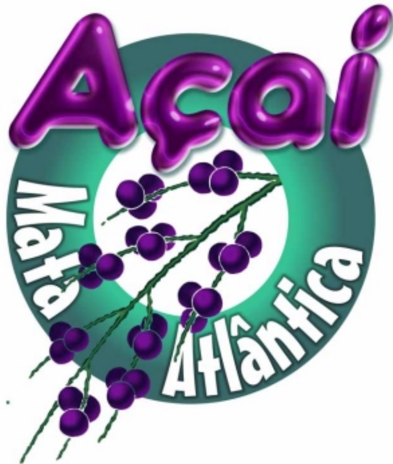
Figura 11: Logotipo utilizado nos produtos Açaí Mata Atlântica 2005

produtos similares do Norte, e reconhecido como de melhor qualidade nos estabelecimentos que compram o Açaí Mata Atlântica.