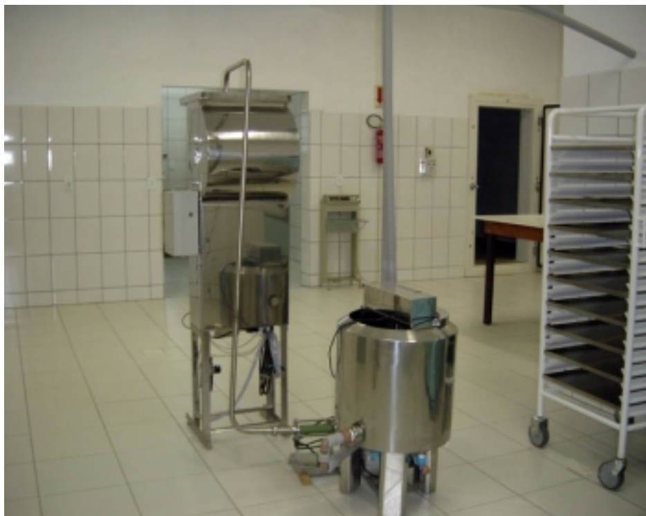
Figura 08: Embaladora – homogenizador – Garuva.

Imediatamente após o despulpamento, o açaí é colocado em um homogenizador, componente da embaladora e envasado (Figura 08). Esta embaladora tem capacidade de 1.500 litros/hora e é operada por uma pessoa, que também se encarrega de transportar o açaí para o interior da câmara-fria, que deverá manter uma temperatura de -22^{\circ}\text{C} .