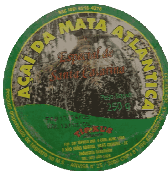
Figura 10: Rótulo do Produto Açaí da Mata Atlântica utilizado em 2004

O mercado da região Sul, até o ano de 2003 era abastecido somente com açaí de proveniência da região Norte do Brasil. Após o início da operação da agroindústria em 2004, começou a ser vendido nos mercados de Florianópolis, Curitiba, Garuva e região a produção de 2,5 toneladas. O açaí produzido em 2004, foi exclusivamente do tipo grosso ou especial (>14% M.S.), Figura 10. A embalagem escolhida foi o sachê de 100 gramas, forma possível de atender consumidores em pequenas quantidades. No decorrer das vendas identificou-se que a grande maioria dos locais varejistas não aceitavam a embalagem pequena, e não valorizavam o tipo especial.