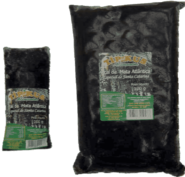
Figura 09: Embalagens de 100 e 1000 gramas