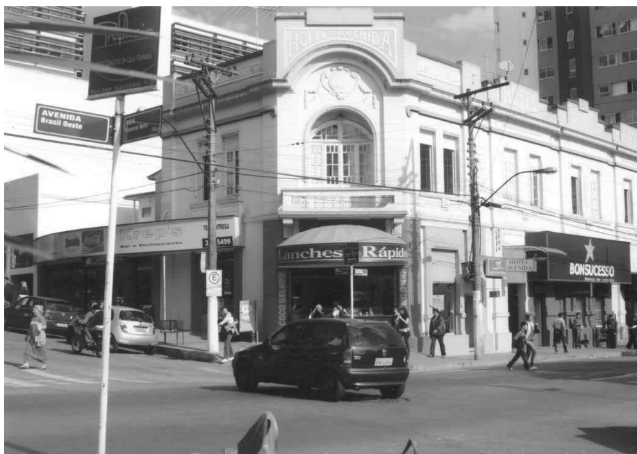
Foto: Hotel Avenida, localizado na Av. Brasil, ainda em funcionamento. 2005.

Por iniciativa do Comitê local do P.C.B. foi organizado um jornal mural de propaganda democrática e anti-fascista nesta cidade. O referido jornal é constituído exclusivamente de estampas e recortes de jornais e revistas criteriosamente escolhidos pelo Serviço de Divulgação do Comitê local, e, afixado em ponto de grande movimento, tem sido muito apreciado pelo público. 311