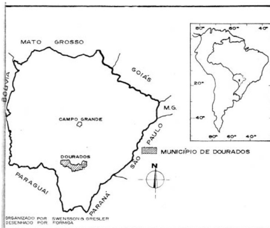
Mapa nº 1: Localização do Município de Dourados.