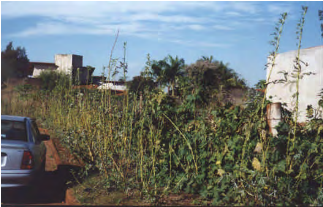
FIGURA 1: Plantação de quiabos e abóboras em área de calçada no Bairro Carvalho, próximo ao Bairro Junqueira, em Ituiutaba – 2001.