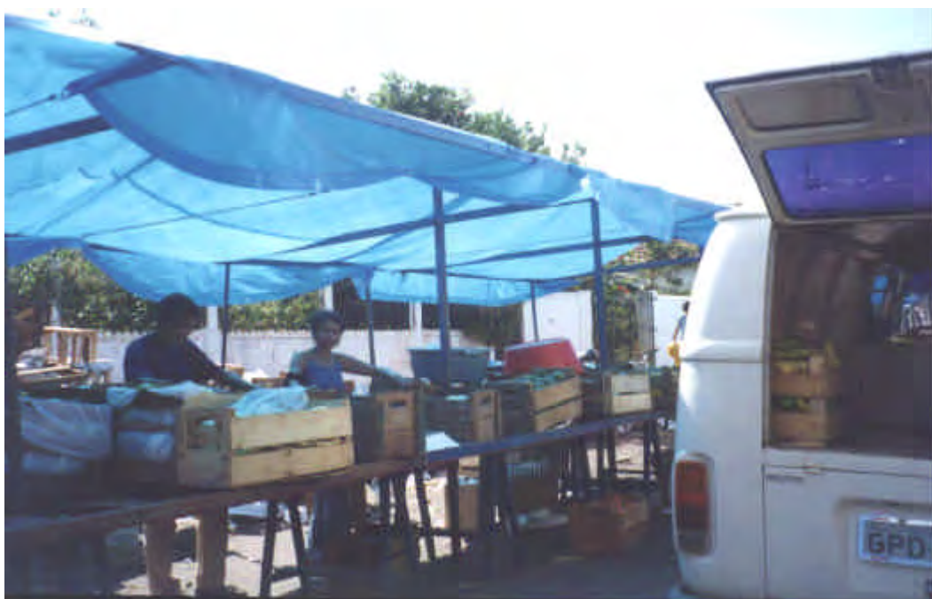
FIGURA 2: Barraca de feira no Bairro Junqueira, em Ituiutaba, onde Eronides vende guariroba – 2001.