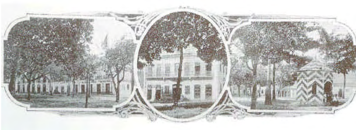
Fonte: BARROS, Valdenira. Imagens do Moderno em São Luís , São Luís: 2001.

Abaixo podemos ver três ângulos do Largo do Carmo em 1923, onde se realizava a festa de Santa Filomena, sendo que à esquerda podemos ver o quiosque de venda de gelo instalado em 1912.