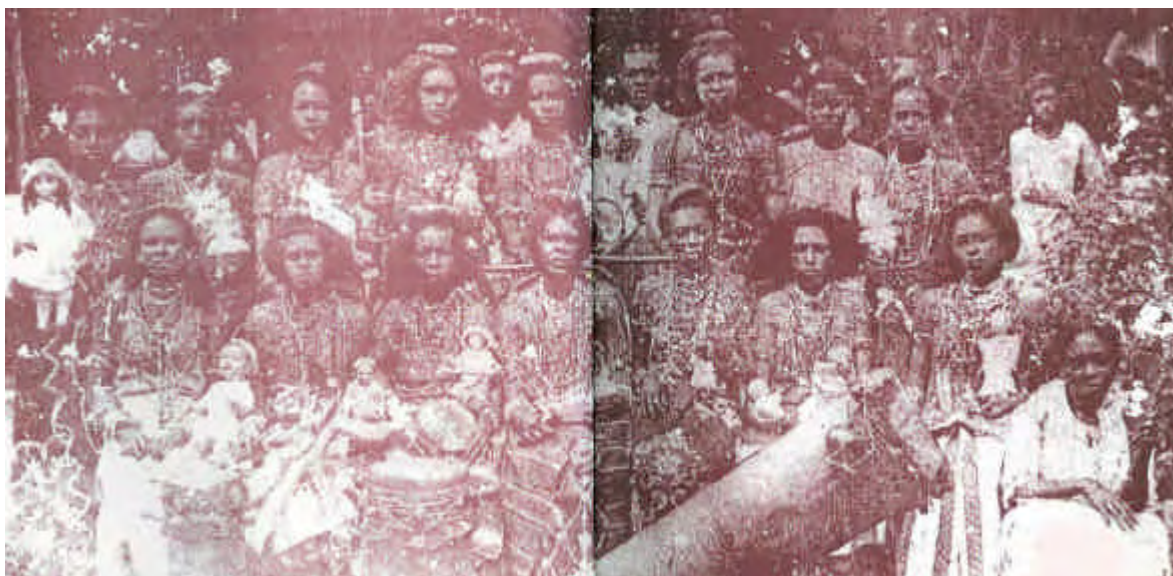
Fonte: FERRETTI, Sérgio Figueiredo. Querebentã de Zomadônu: etnografia da Casa das Minas , São Luís: EdUFMA, 1996. 2 ed. rev. atual.

Abaixo as mulheres que freqüentavam as festas das irmandades afro-brasileiras. A foto data de 1915 e retrata uma feitória na Casa das Minas