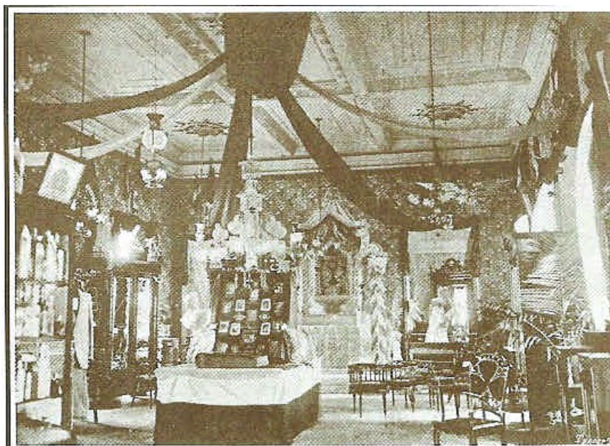
Fonte: BARROS, Valdenira. Imagens do Moderno em São Luís , São Luís: 2001.

Abaixo podemos ver uma das salas da Exposição, em cujo fundo há um altar com um ostensório.