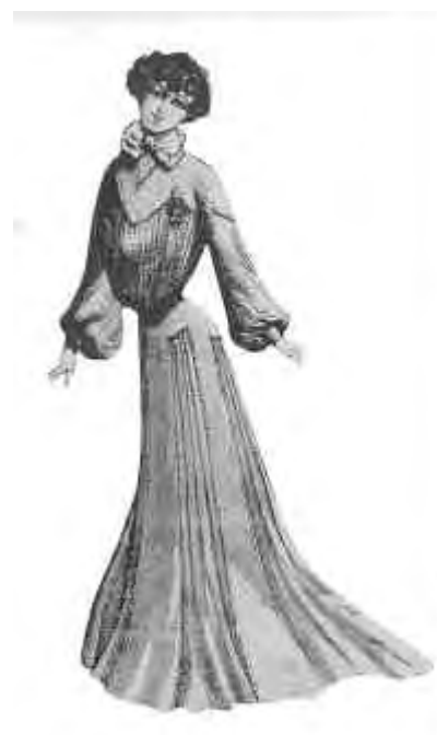
Fonte: BARROS, Valdenira. Imagens do Moderno em São Luís , São Luís: 2001.

Acima podemos ver o protótipo de beleza feminina idealizado pela Revista do Norte, responsável pela edição do jornal A Novena , que cobriu a festa de Santa Filomena em 1909.