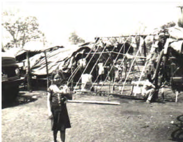
Figura 7. Assentamento temporário na Vila São Pedro.