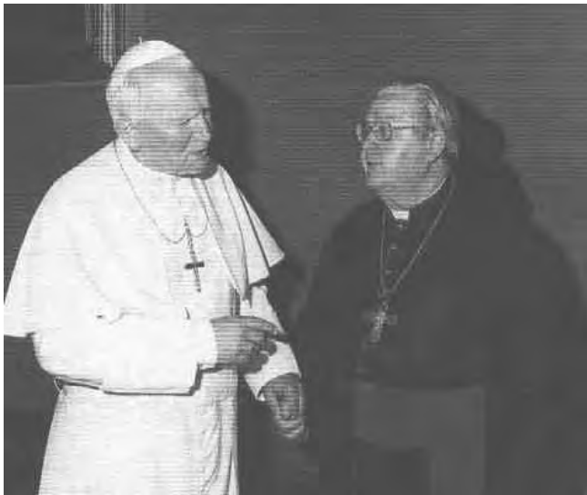
Reprodução do encarte dos 70 anos de vida.

A eleição de João Paulo II, em 1978, representou para a Igreja Católica um novo período para a instituição. O novo Papa tinha uma interpretação minimalista do Vaticano