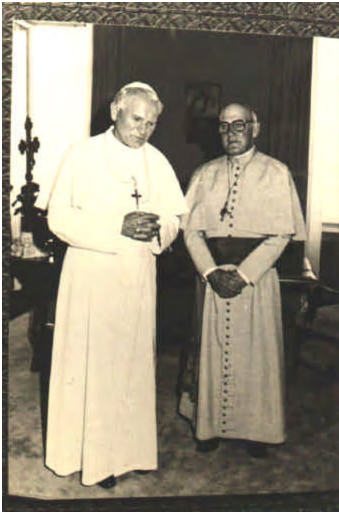
Figura 2. D. Teodardo com João Paulo II. Visita à Santa Sé