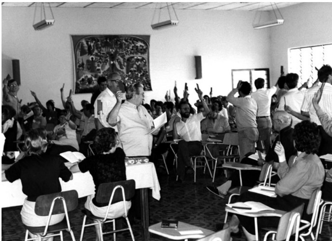
Figura 8. Votação das propostas do Sínodo.

Durante os quase três anos de discussões do Sínodo, ocorreram quatro etapas específicas de trabalho, sendo que a Comissão Pastoral da Terra e o Conselho Indigenista Missionário foram discutidos e delimitados a partir da discussão do papel do leigo na Igreja. Assim, analisaremos cada uma das quatro etapas, observando a temática e as propostas de trabalho enquanto diretrizes a serem postas e em prática na Diocese.