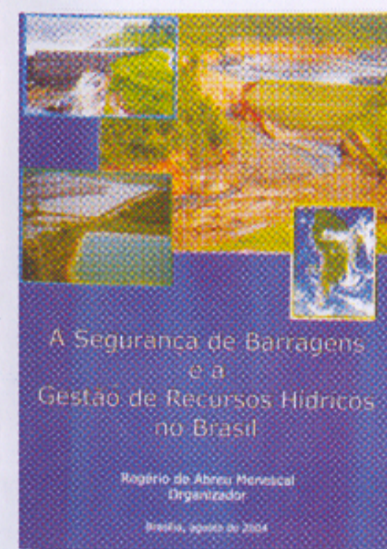
Livro: A Segurança de Barragens e a Gestão de Recursos Hídricos no Brasil