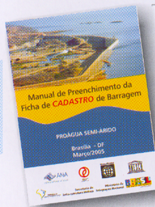
Livro: Manual de Preenchimento da Ficha de Cadastro de Barragem

As informações inseridas no Formulário de Cadastro de Barragem devem ser fidedignas, para tanto é primordial que a obra tenha sido inspecionada, a fim de que seja feito o registro da situação atual em que se encontra.