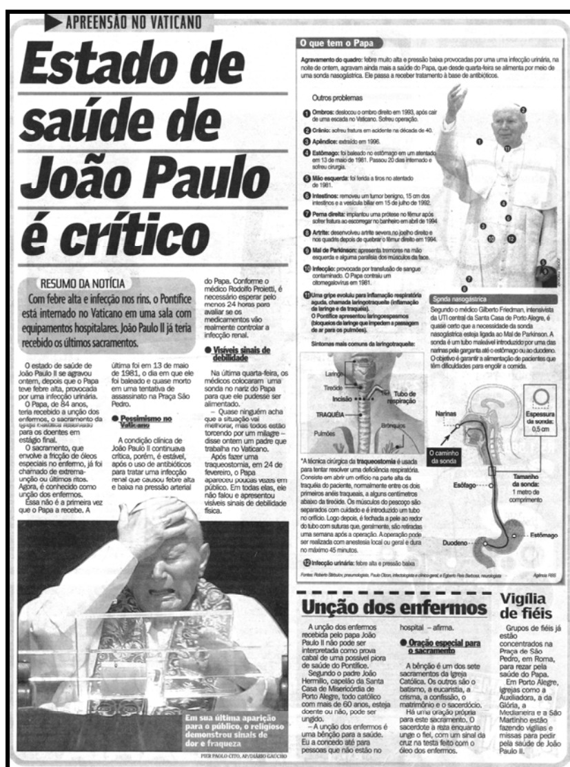
Figura 5 – Exemplo de matéria na categoria Saúde de pessoas famosas

A saúde entra em pauta a partir de problema vivido por alguma personalidade. Dependendo do grau de importância desta, do interesse que possa despertar no leitor e da complexidade de seu problema, pode variar desde uma pequena nota de pé de página, apenas registrando a ocorrência, até matérias de páginas inteiras, com fotos e gráficos de manchete de capa etc.