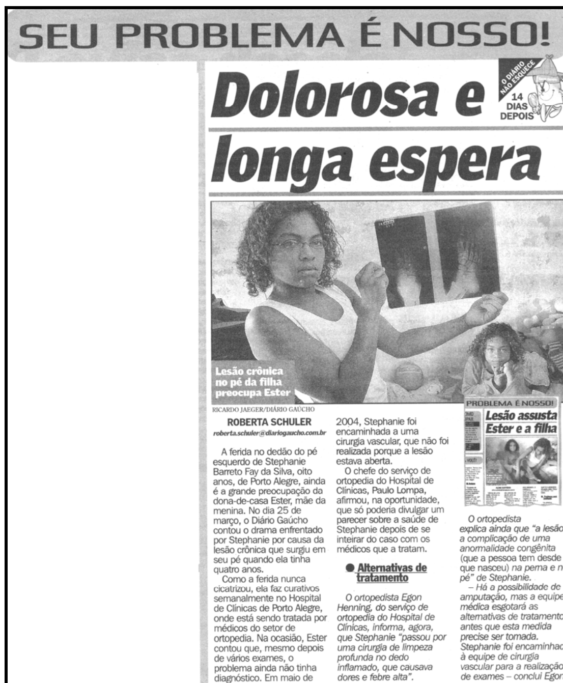
Figura 13 – Exemplo da coluna Seu problema é nosso!