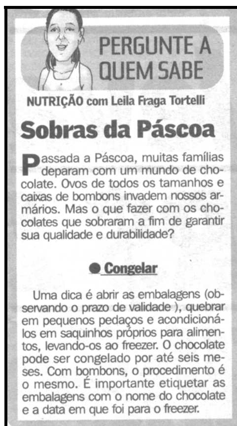
Figura 14 – Exemplo da coluna Pergunte a quem sabe/ Nutrição