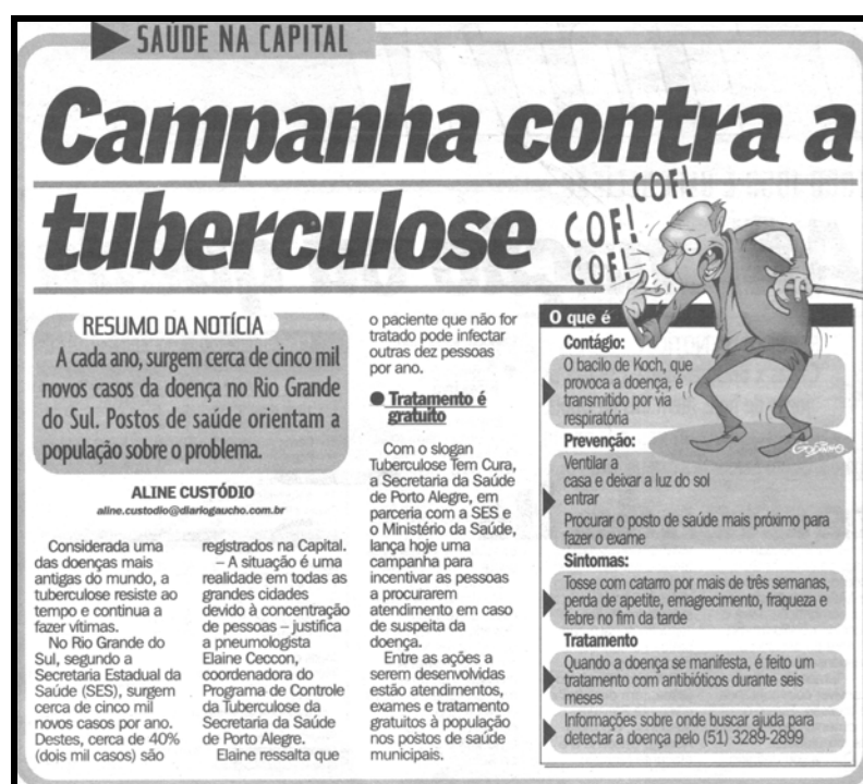
Figura 4 – Exemplo de matéria na categoria Problemas de saúde pública