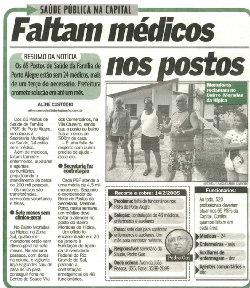
Figura 3 – Exemplo de matéria na categoria Serviços de saúde