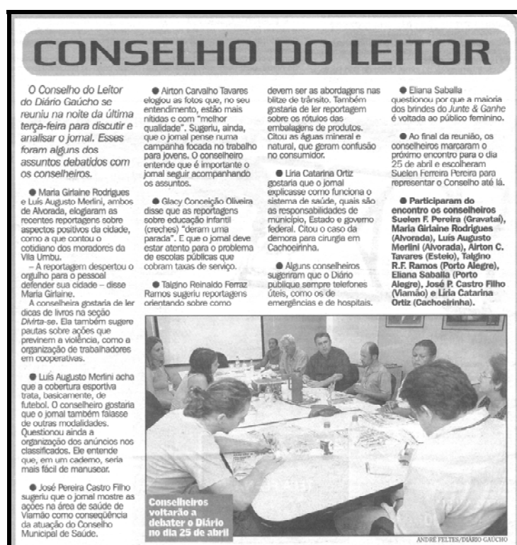
Figura 19 – Exemplo da coluna Conselho do leitor