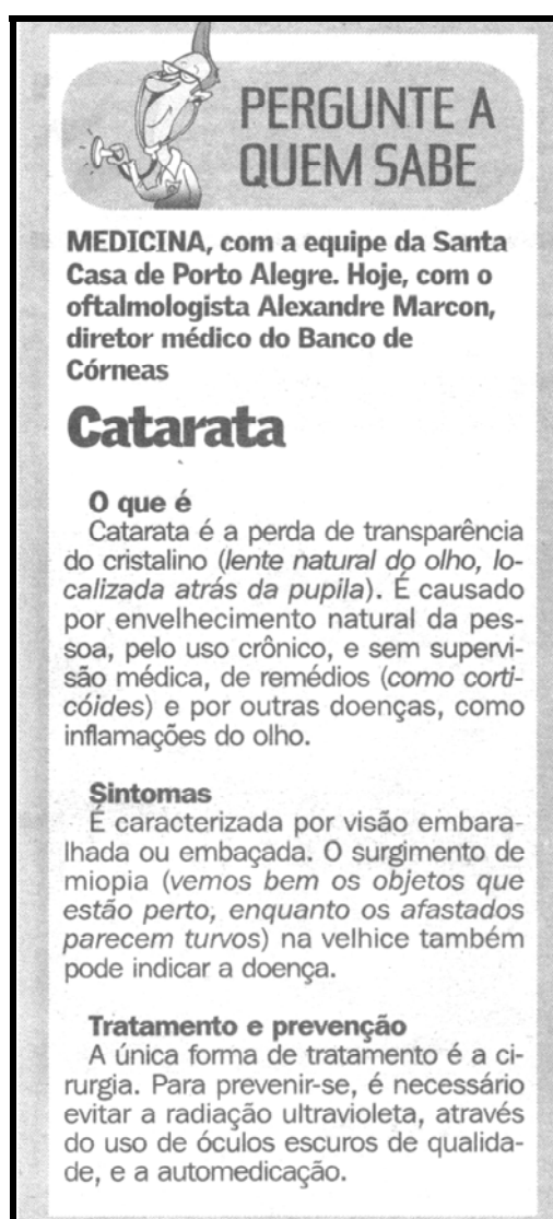
Figura 15 – Exemplo da coluna Pergunte a quem sabe/ Medicina