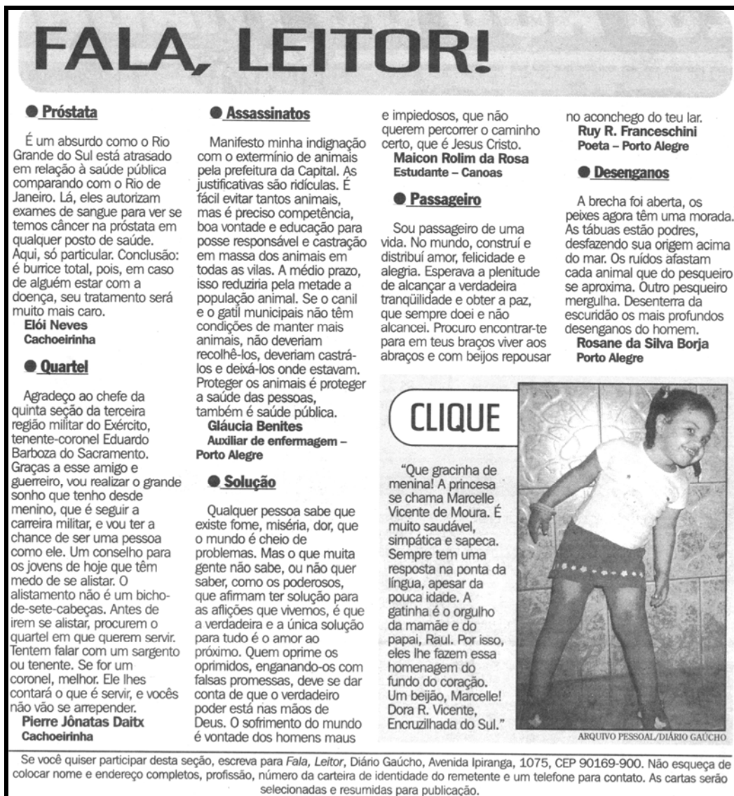
Figura 10 – Exemplo da coluna Fala, leitor!

Todos os autores das cartas mencionadas são homens.