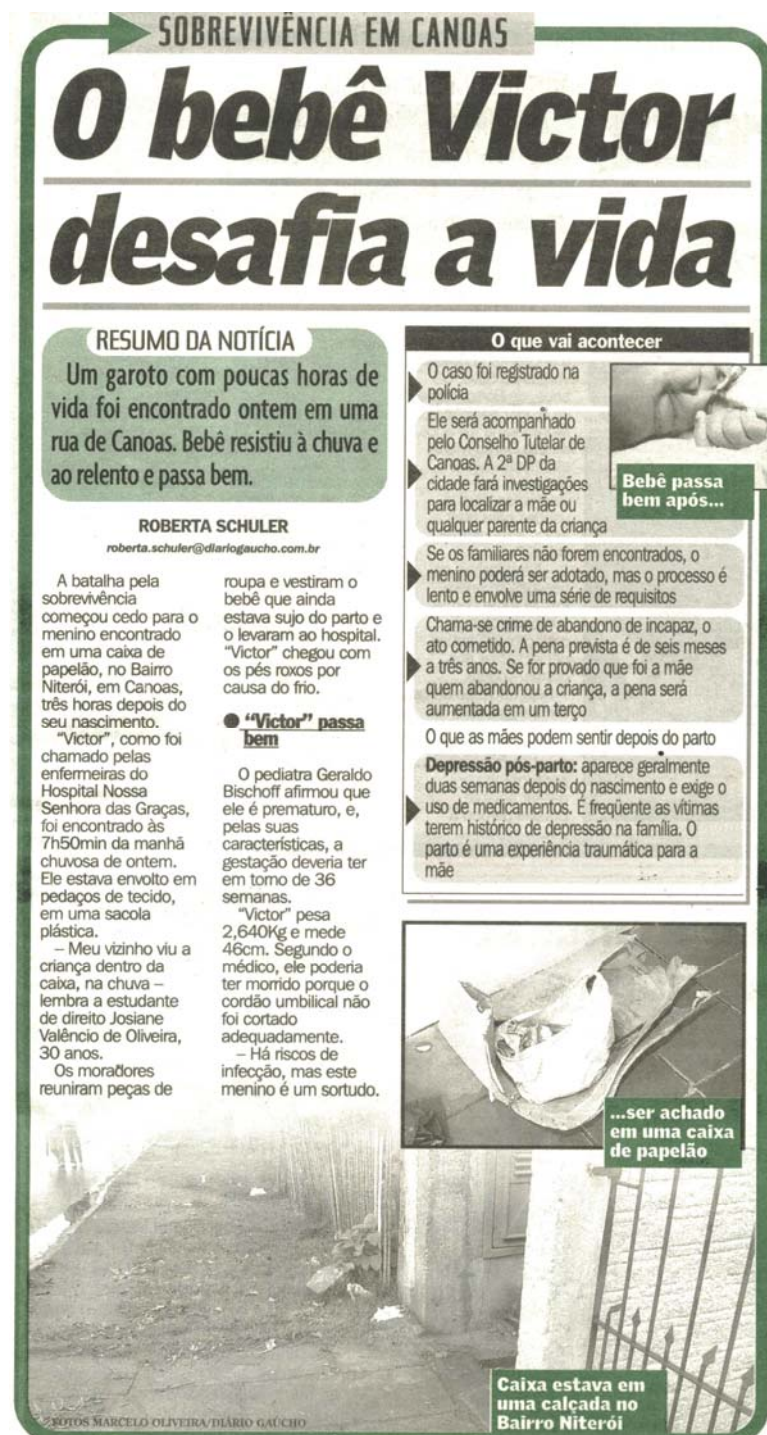
Figura 6 – Exemplo de matéria na categoria Diversas/ Outras

- apresentação do caso de uma mulher que, em um município do interior, deu à luz em sua residência.